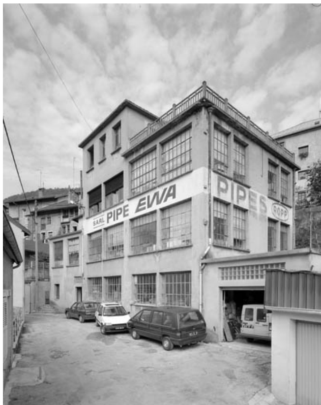
Façade antérieure de trois quarts droite.