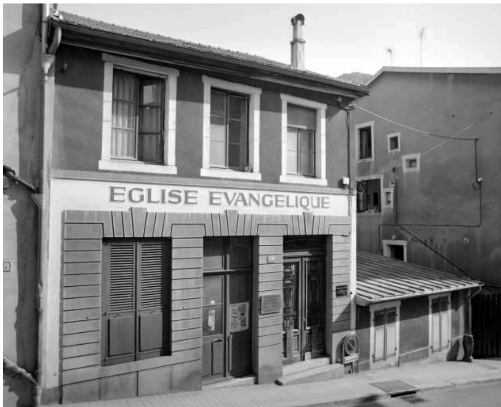
Façade antérieure du bâtiment rue de la Poyat. 39, Saint-Claude, 5 rue Saint-Oyend