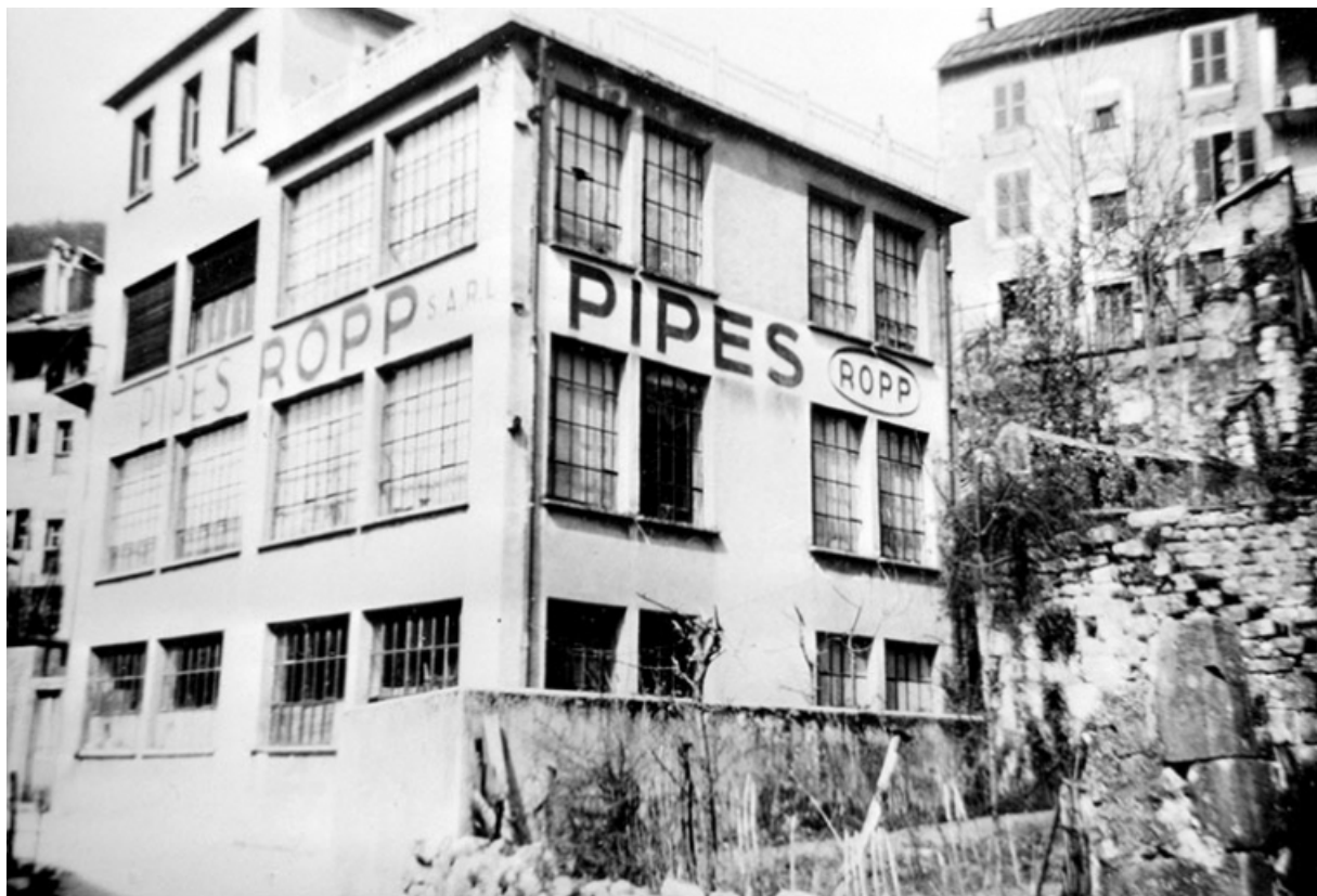
[Façade antérieure de trois quarts droite].