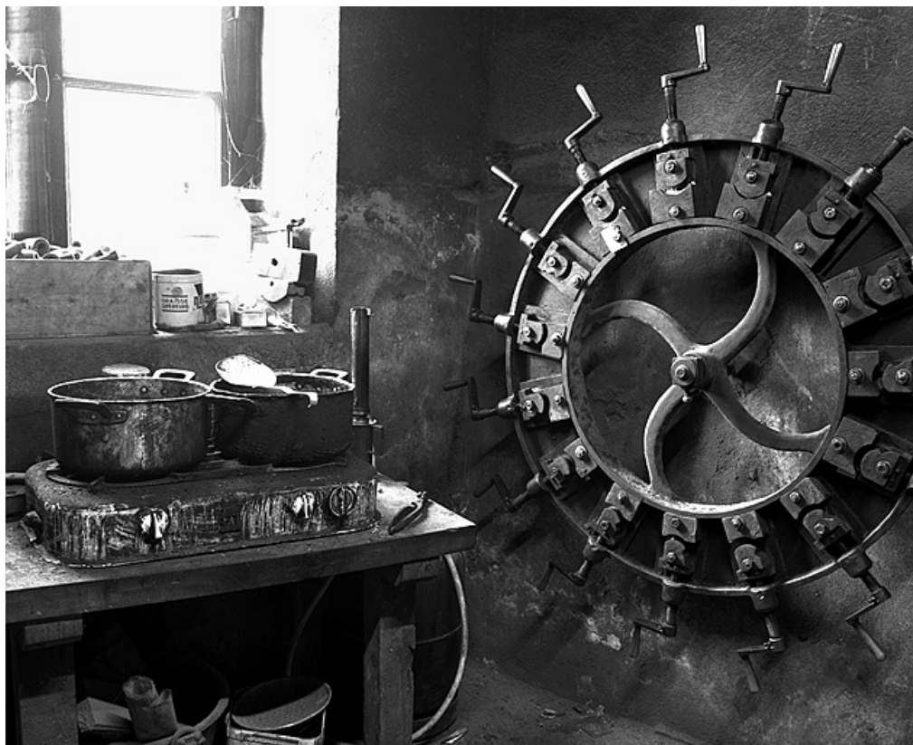
Atelier de fabrication des tuyaux en corne. Grillée pour en «tirer le nerf», la corne est redressée, tournée pour obtenir le tuyau, percée puis cintrée.