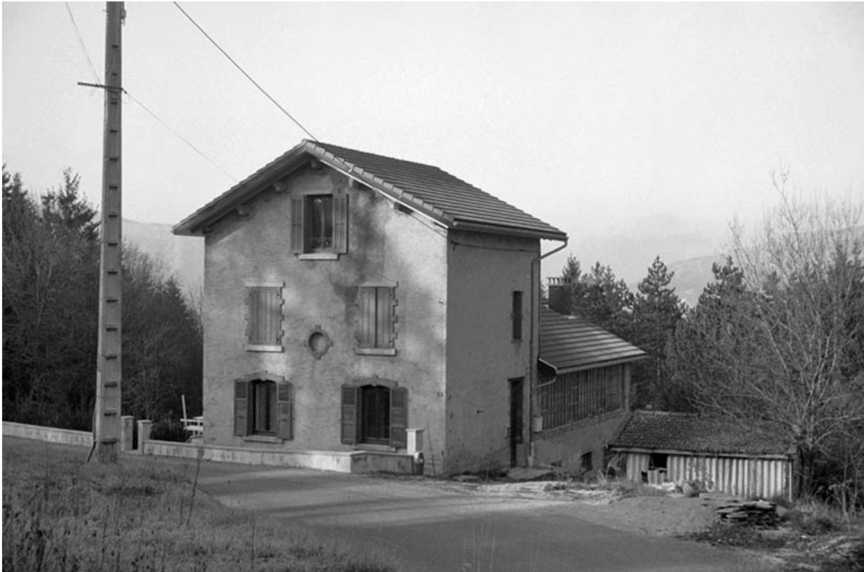
Façades antérieure et latérale droite.

39, Saint-Claude, 1 rue des Lapidaires, lieudit : Chaumont