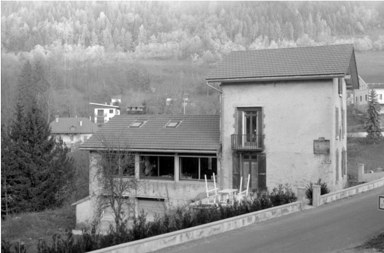
Façade latérale gauche.

39, Saint-Claude, 1 rue des Lapidaires, lieudit : Chaumont