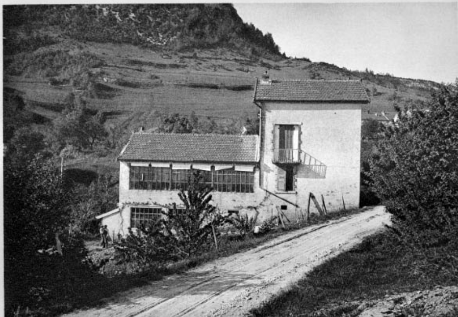
62. — Adamas, Société coopérative diamantaire; sa succursale à Chaumont (Jura).

Adamas, Société coopérative diamantaire ; sa succursale à Chaumont (Jura), début des années 1920.