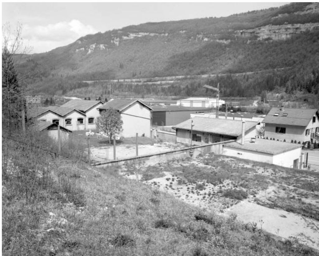
Vue d'ensemble depuis l'arrière.

39, Saint-Claude, 13 route de Lyon, lieudit : la Patience