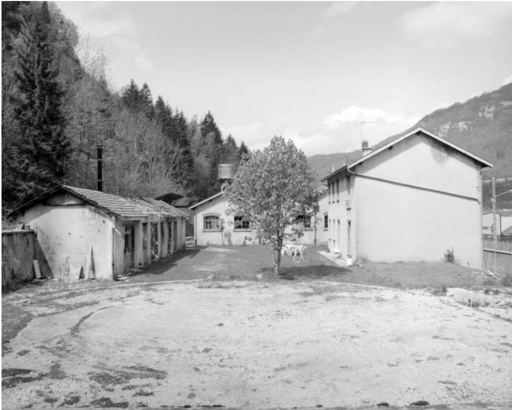
Au premier plan, emplacement du gazomètre.

39, Saint-Claude, 13 route de Lyon, lieudit : la Patience