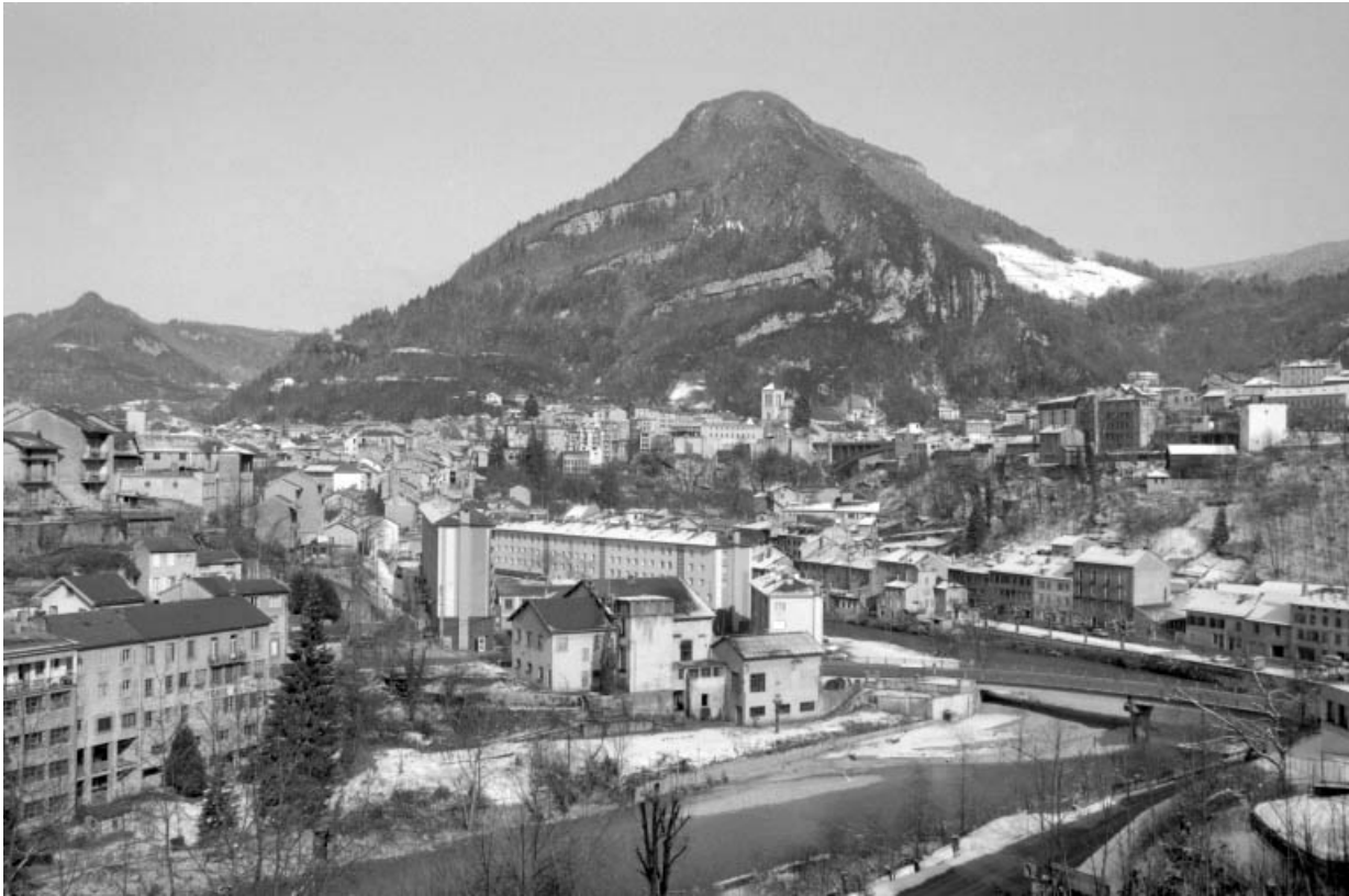
Vue d'ensemble depuis l'ouest. 39, Saint-Claude, 46 rue du Miroir