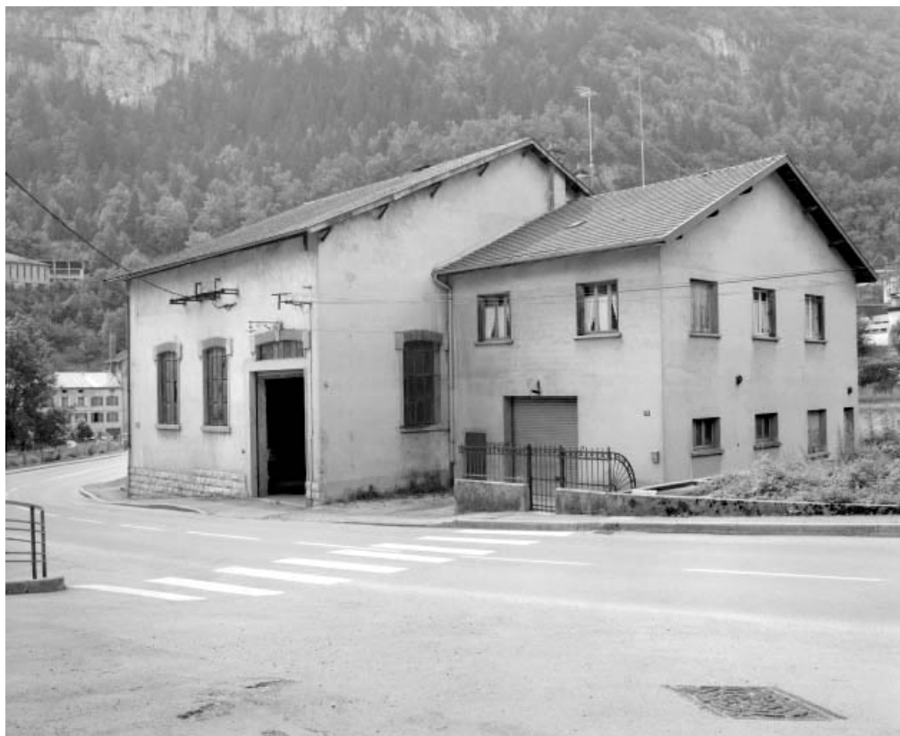
Façade antérieure vue de trois quarts droite.