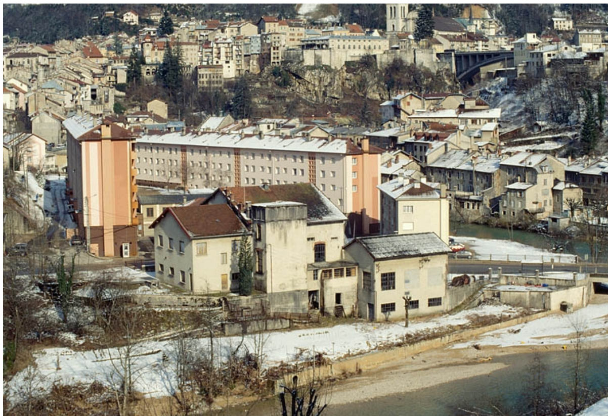
Vue d'ensemble rapprochée depuis l'ouest.