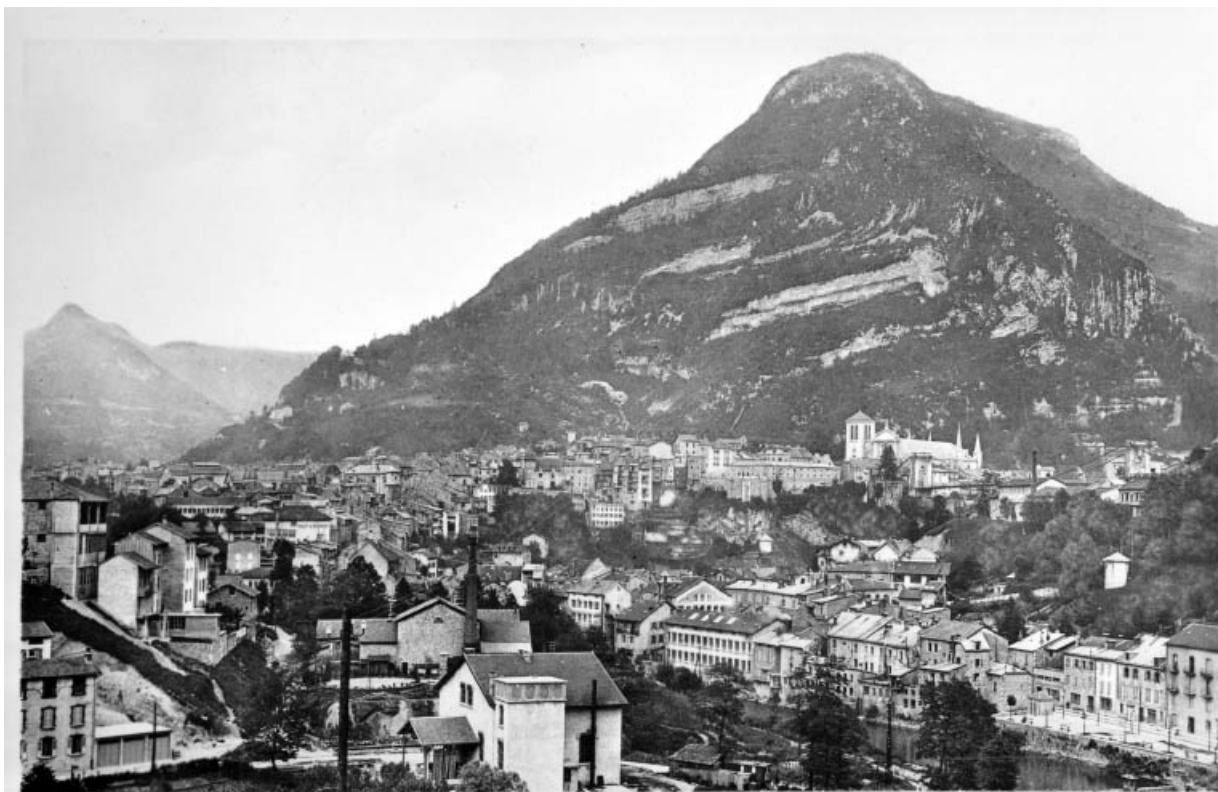
Saint-Claude (Jura) - Vue Générale et le Mont Bayard (alt. 990 m.). 39, Saint-Claude, 46 rue du Miroir