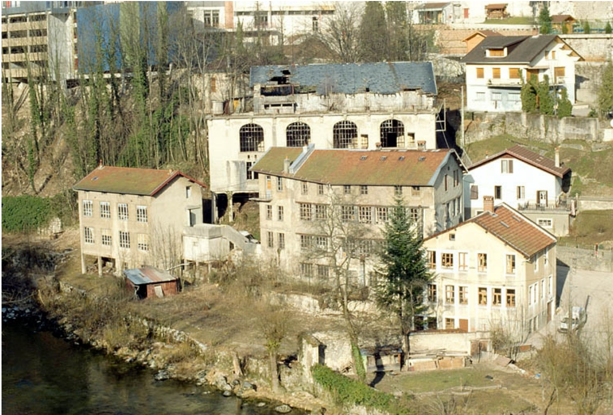
Vue d'ensemble depuis le sud-ouest.