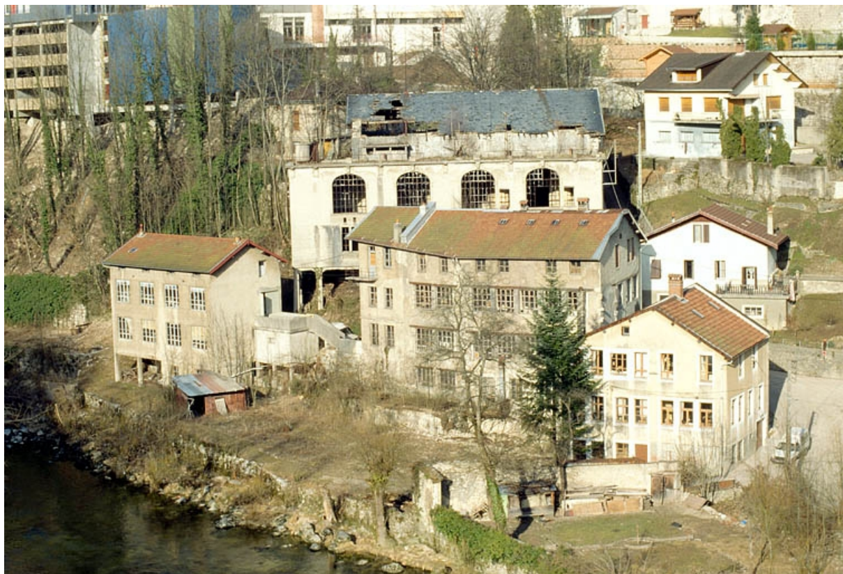
Vue d'ensemble depuis le sud-ouest. 39, Saint-Claude chemin de la Coupe