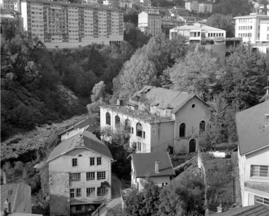
Vue d'ensemble depuis le sud.