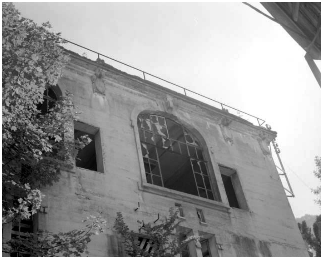
Façade latérale gauche du transformateur : baies à l'étage.