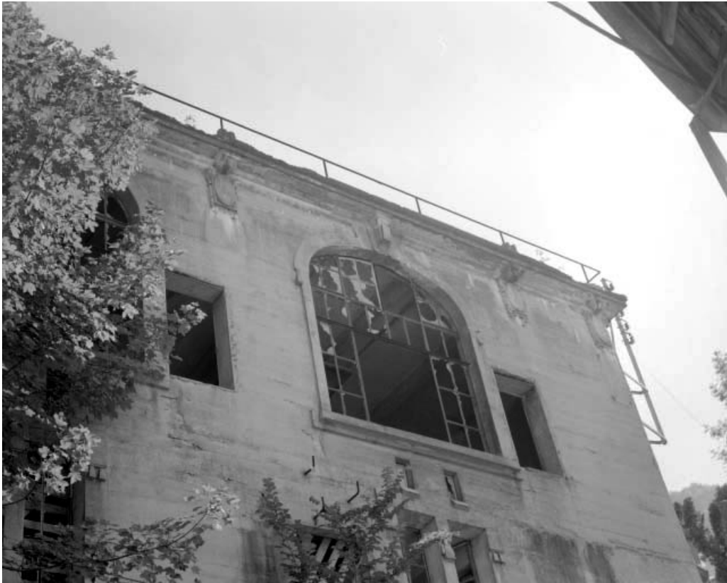
Façade latérale gauche du transformateur : baies à l'étage.