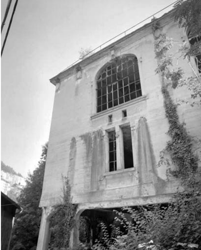
Façade latérale gauche du transformateur : une travée.