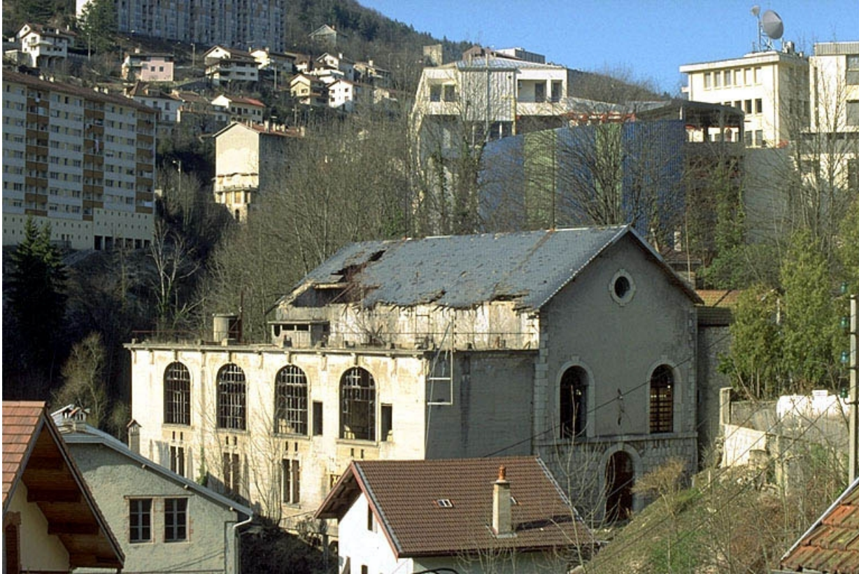
Vue d'ensemble rapprochée depuis le sud.