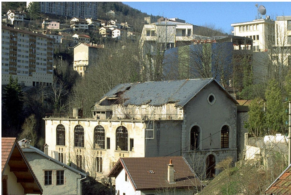
Vue d'ensemble rapprochée depuis le sud.