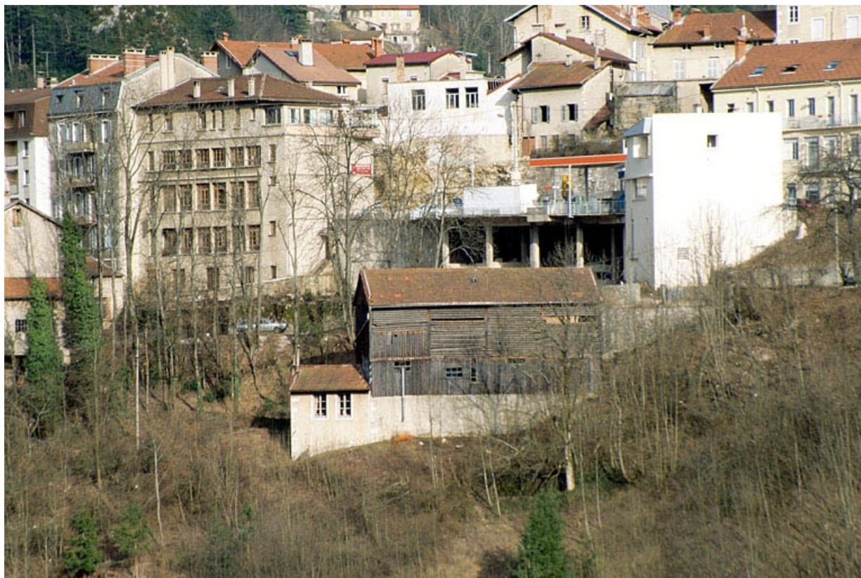
Vue d'ensemble du séchoir à ébauchons depuis l'ouest.