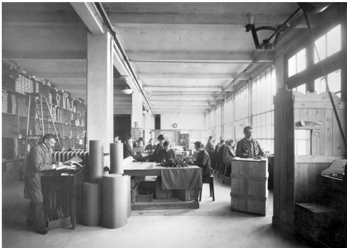
Marquage, emballage et expédition, en 1926.