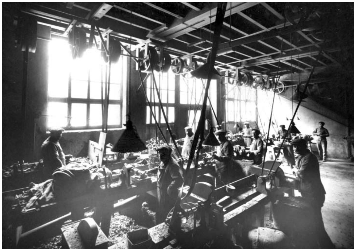
Ebauchage, en 1926.