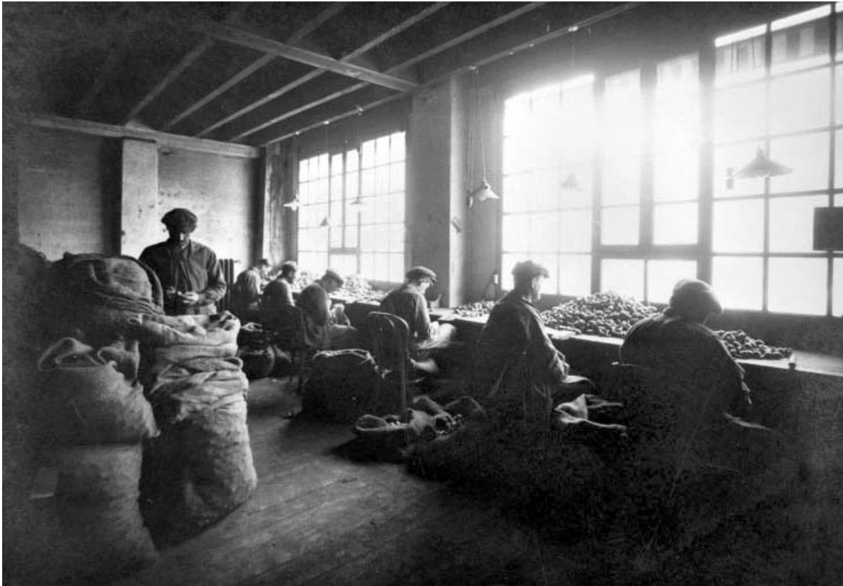
Triage des têtes, en 1926.