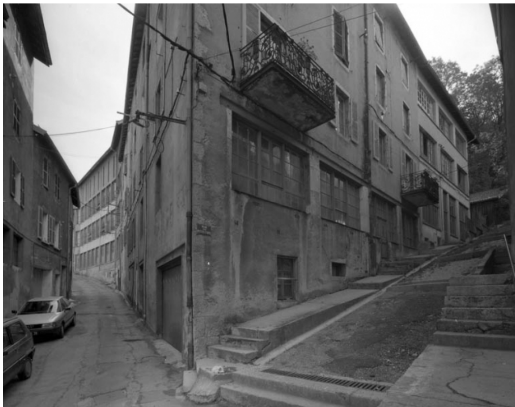
Façades à l'angle de la rue des Etapes et de celle des Petites Etapes.