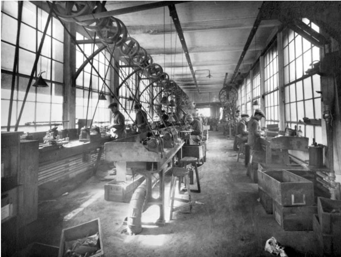
Ebauchage (actuel atelier de menuiserie), en 1926.