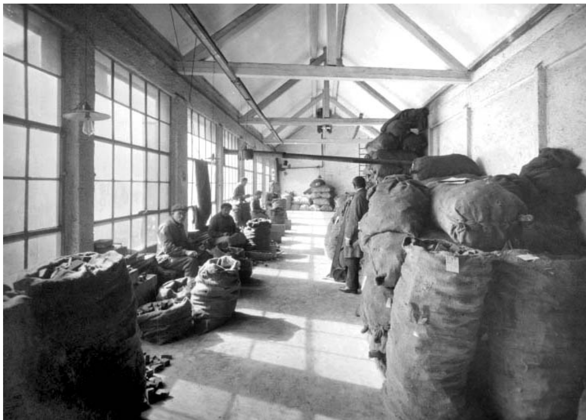
Triage des ébauchons, en 1926.