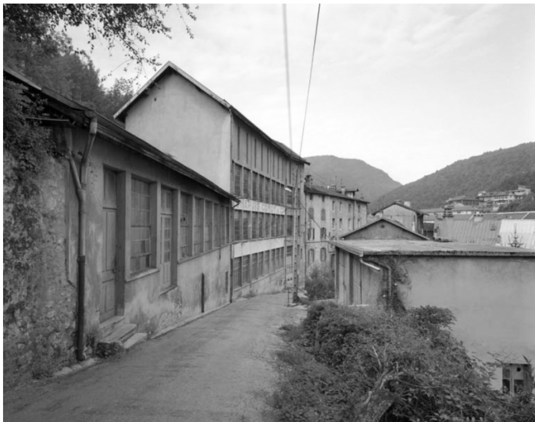
Façades sur la rue des Etapes, depuis le haut de la rue.