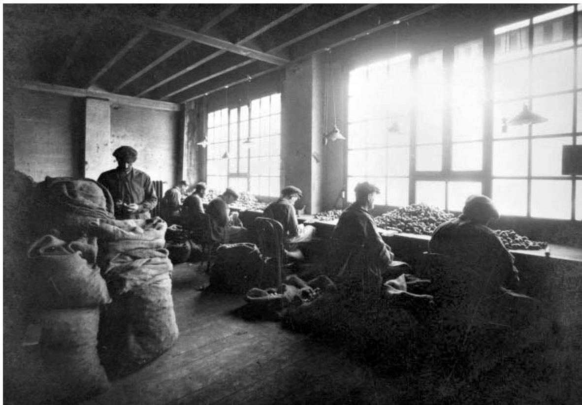
Triage des têtes, en 1926.