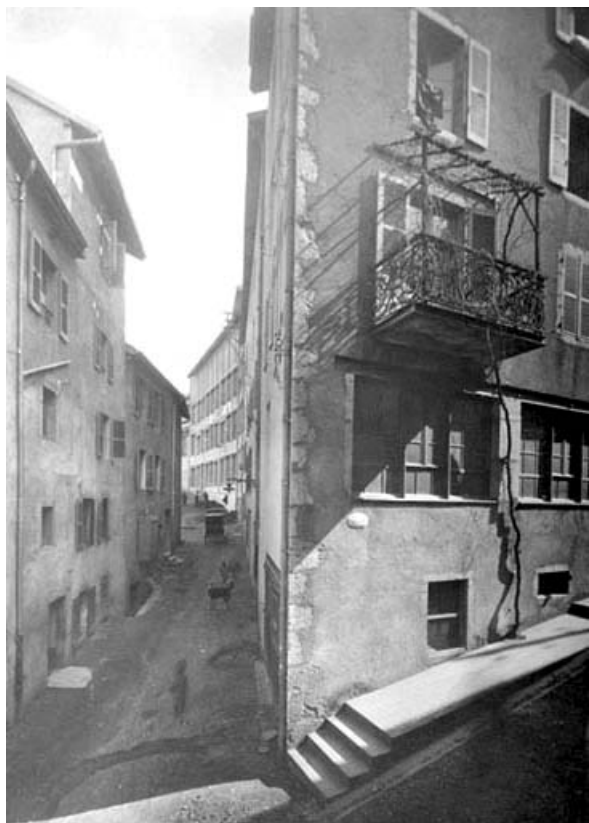
Façades à l'angle de la rue des Etapes et de celle des Petites Etapes, en 1926. 39, Saint-Claude, 2, 4 rue des Etapes