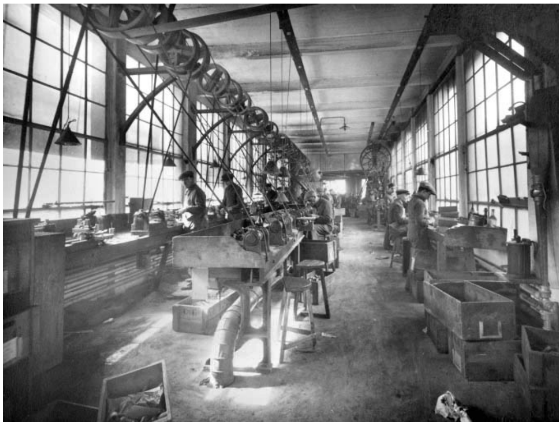
Ebauchage (actuel atelier de menuiserie), en 1926.