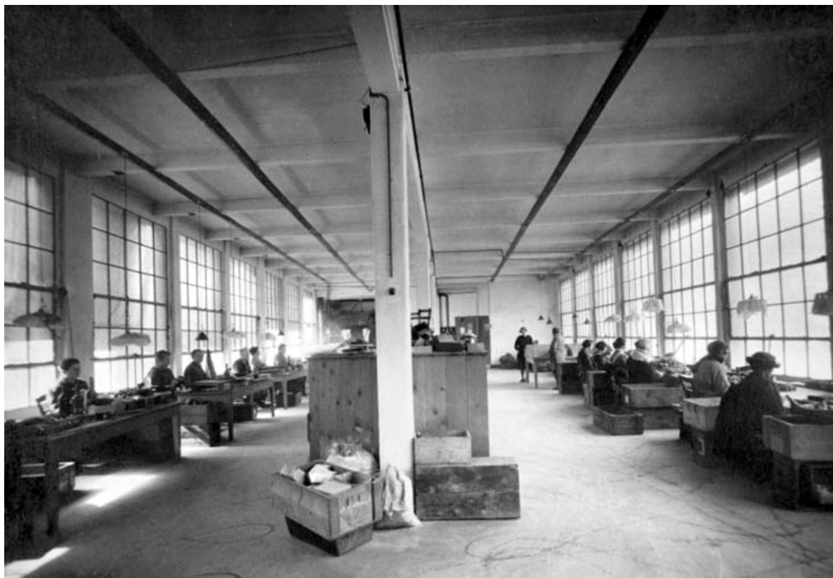
Mise en couleur, masticage et choix (1er étage), en 1926.