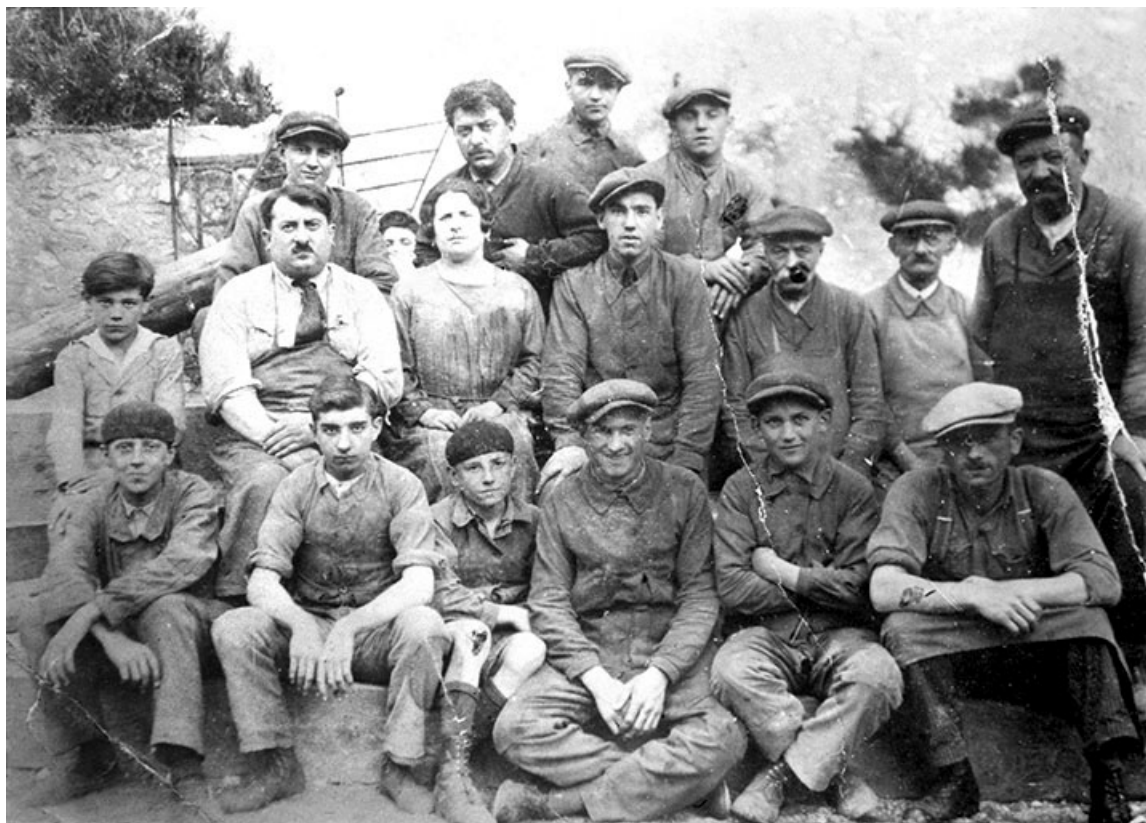
[Monteurs à floc].