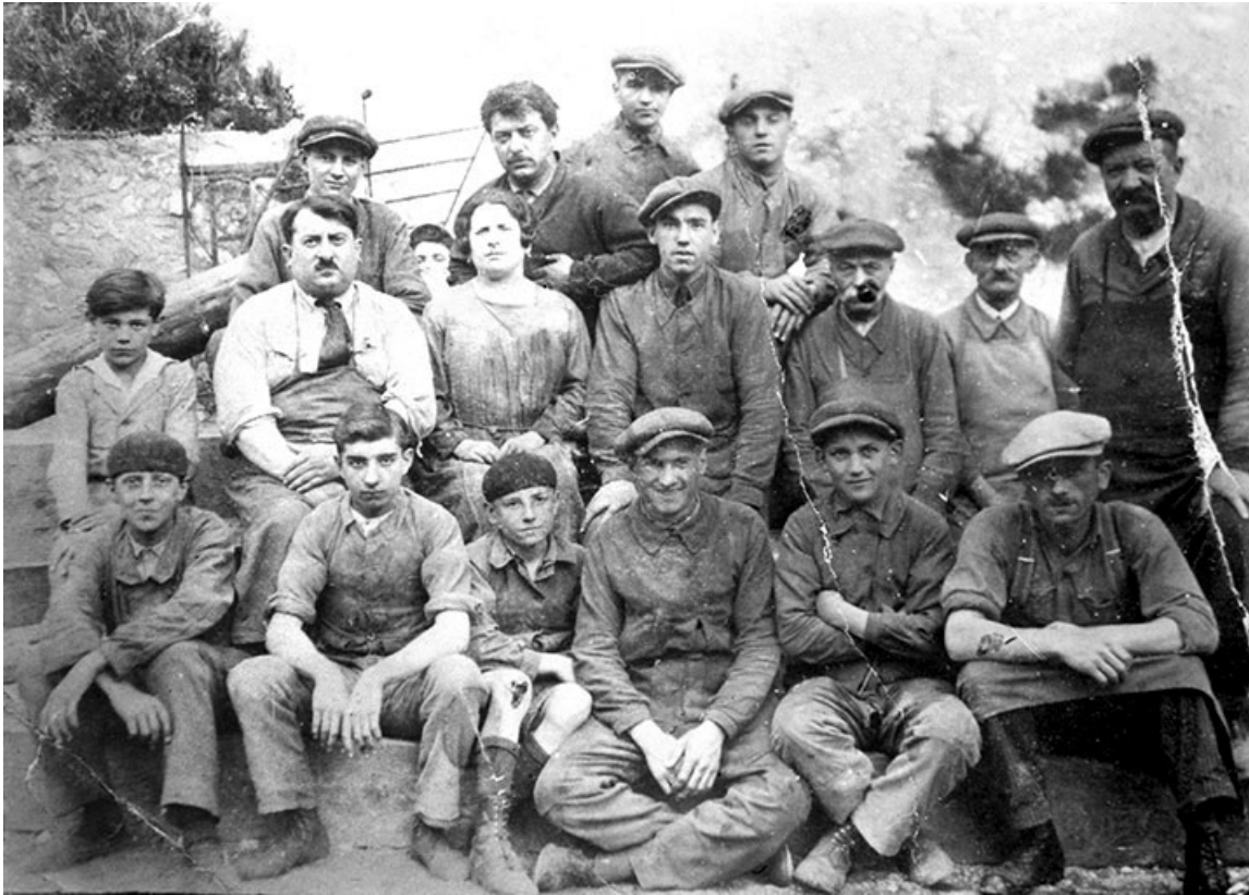
[Monteurs à floc].