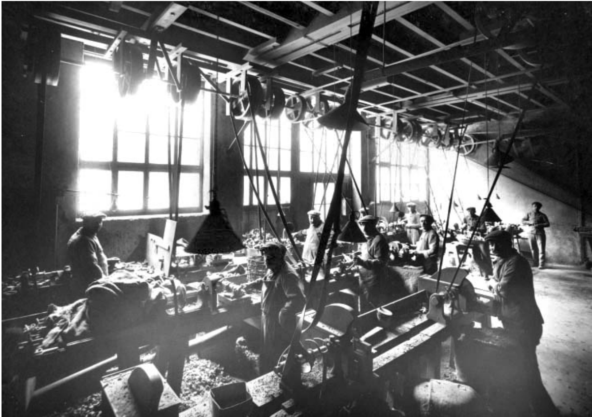
Ebauchage, en 1926.