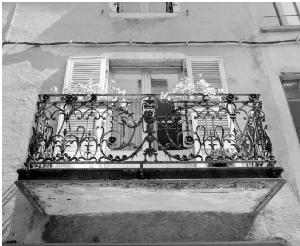
Balcon du magasin industriel et logement d'ouvriers, rue des Petites Etapes, vu de face. 39, Saint-Claude, 2, 4 rue des Etapes