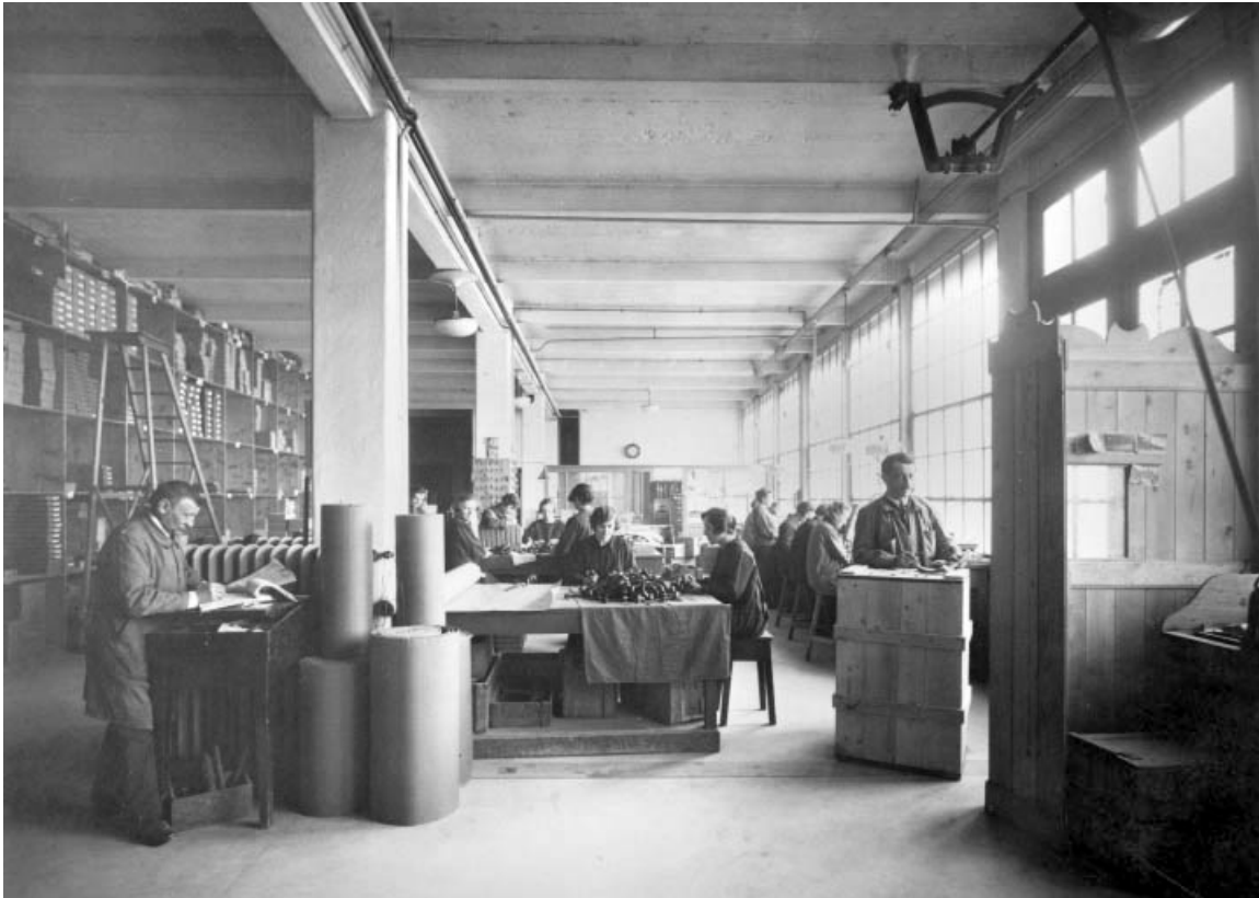
Marquage, emballage et expédition, en 1926.