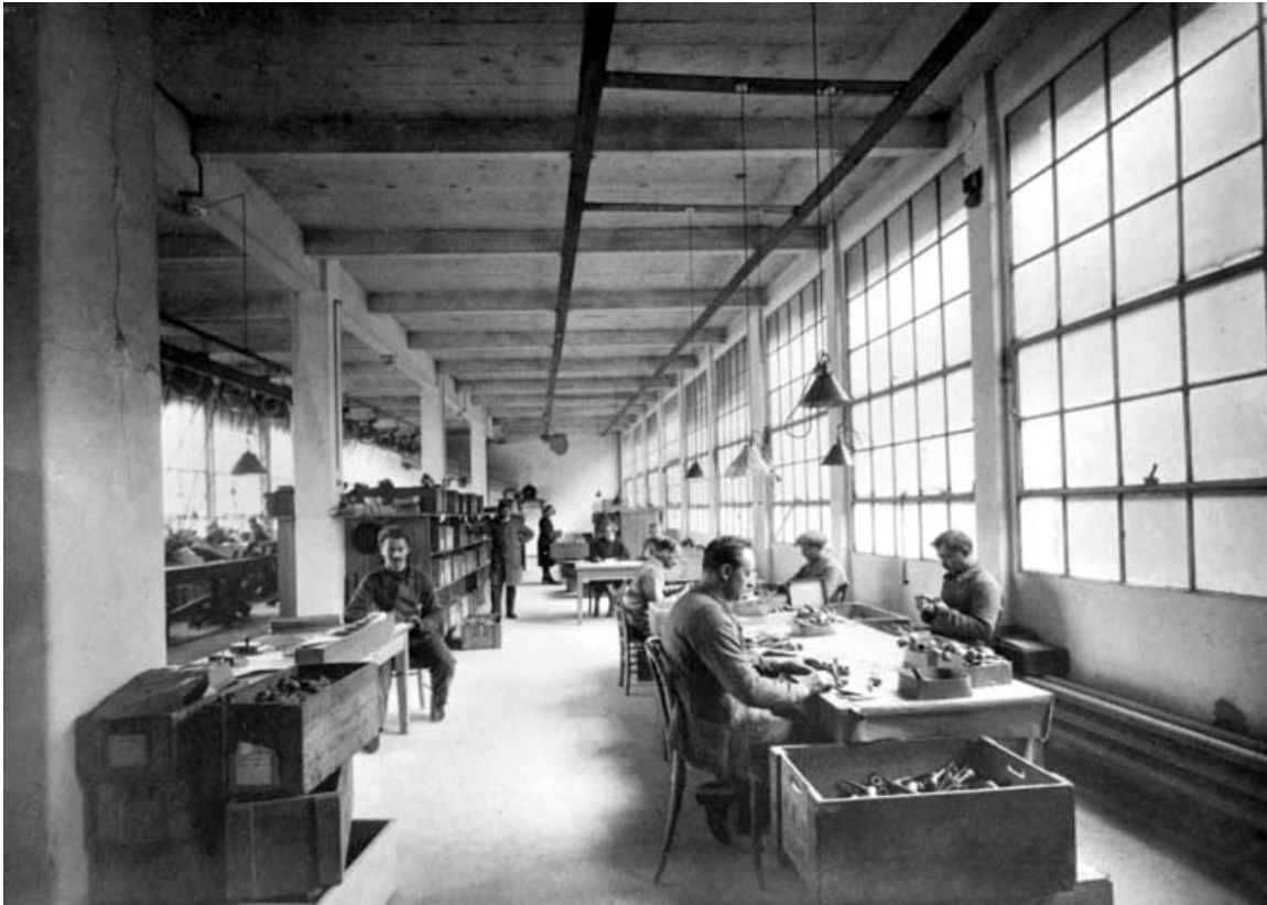
Triage ou tubage des pipes, en 1926.