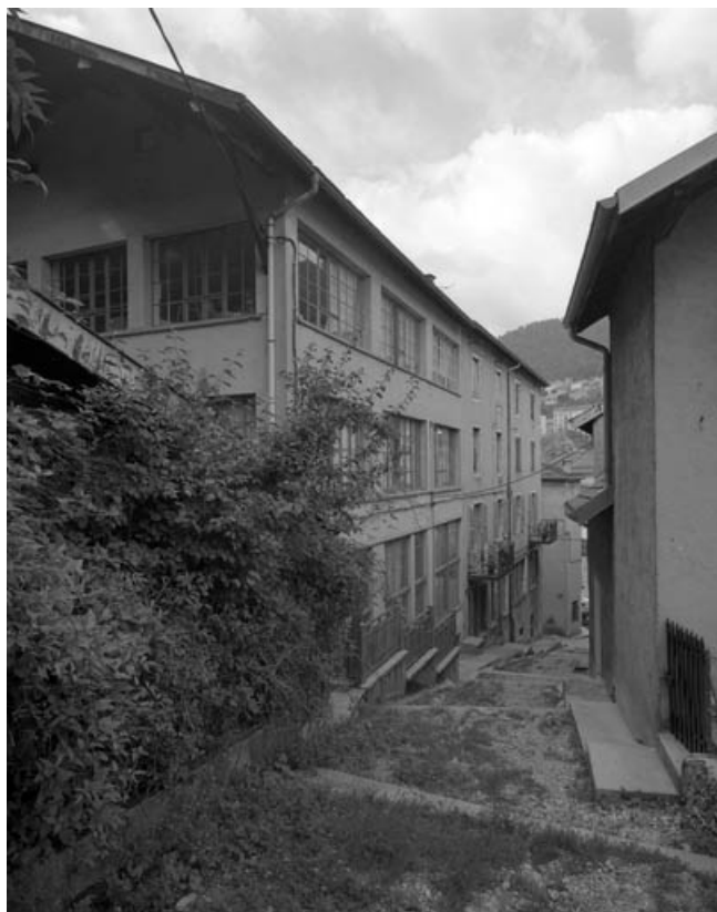
Façades sur la rue des Petites Etapes, de trois quarts droite.