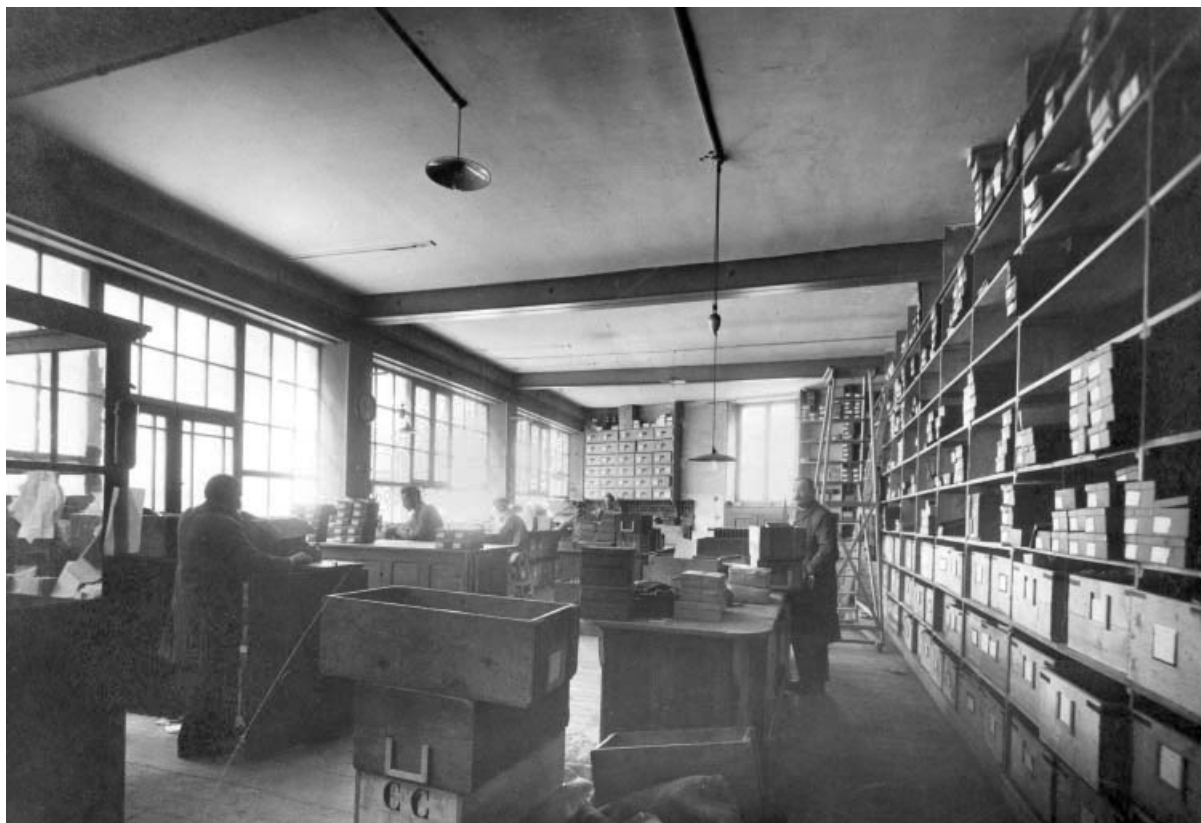
Stockage des têtes, en 1926.