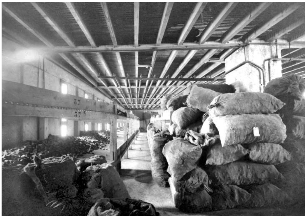
Intérieur du séchoir à ébauchons (3e étage), en 1926.