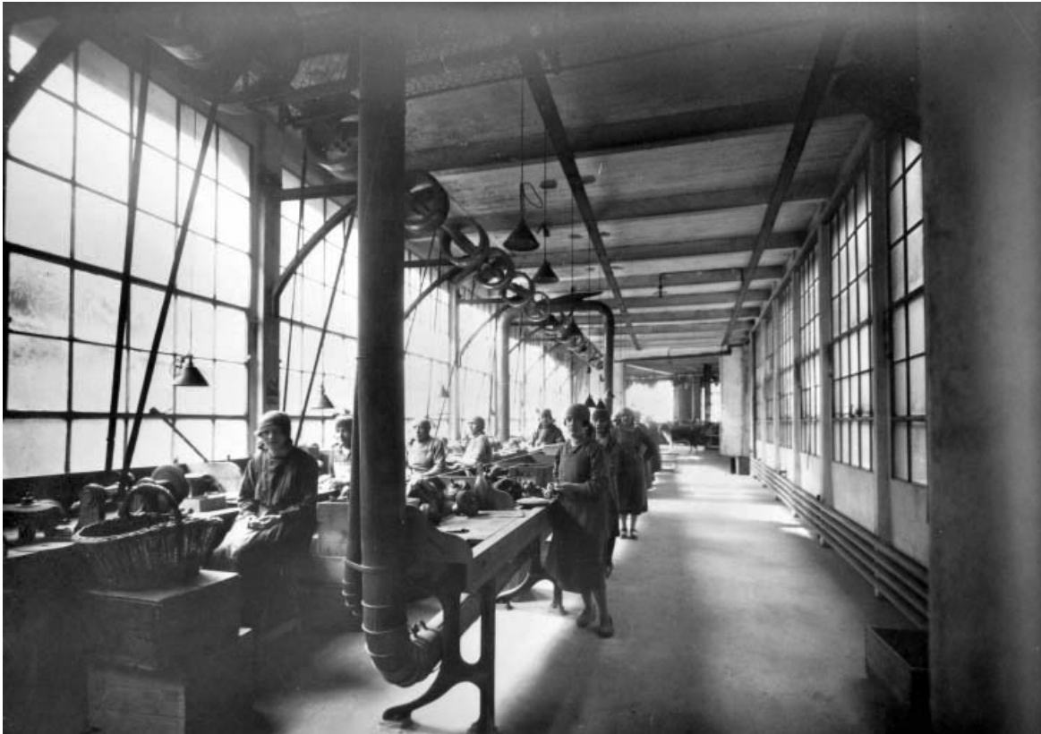
Polissage, en 1926.