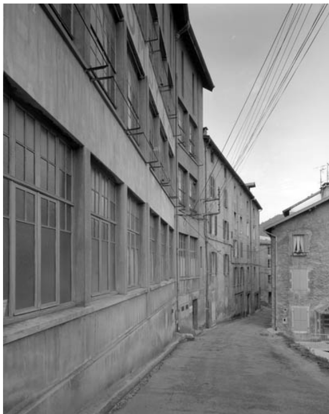
Façades sur la rue des Etapes, de trois quarts gauche.