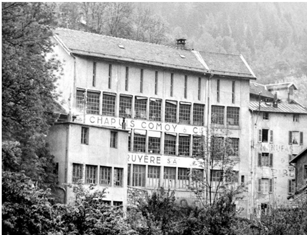
[Façades sur la rue des Etapes].