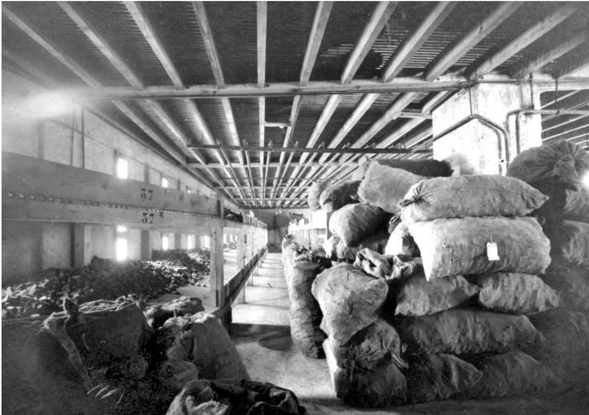
Intérieur du séchoir à ébauchons (3e étage), en 1926.