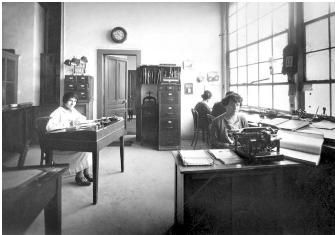
Un bureau, en 1926.