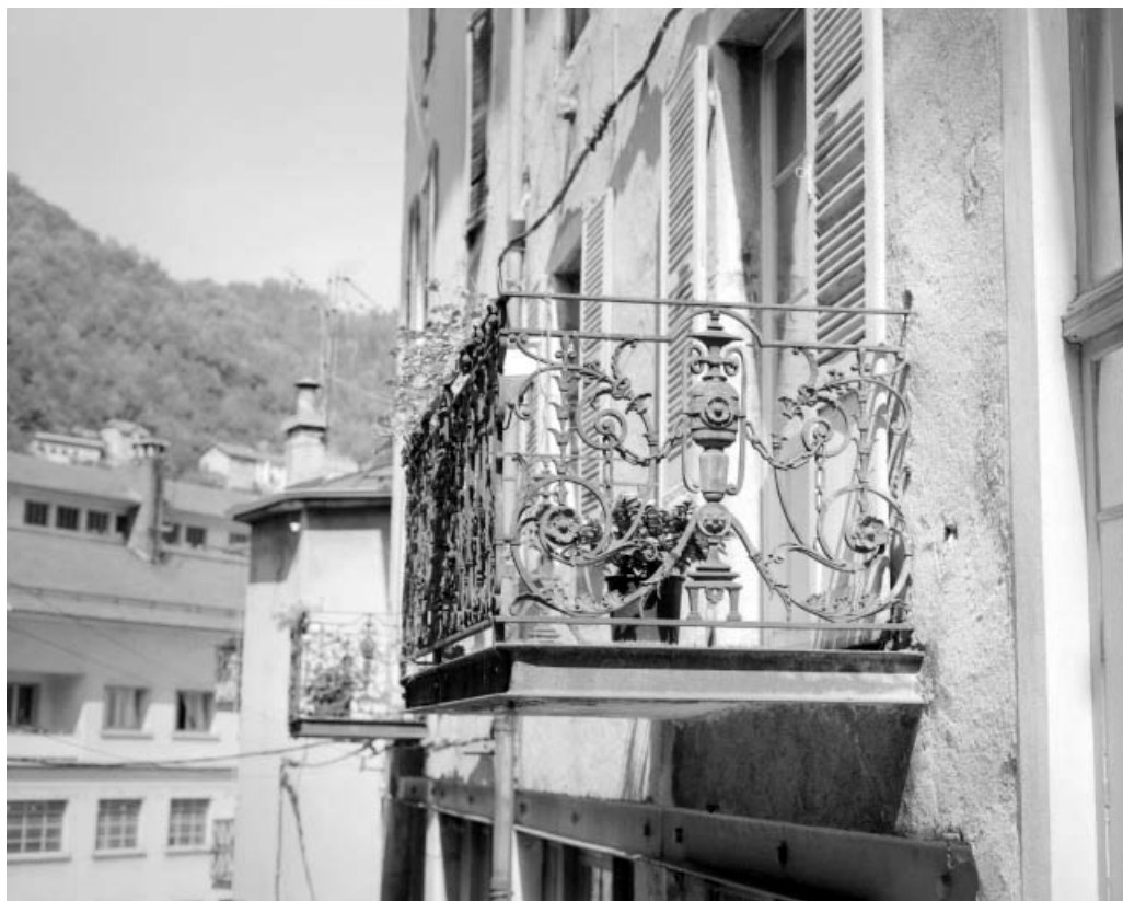
Balcon du magasin industriel et logement d'ouvriers, rue des Petites Etapes. 39, Saint-Claude, 2, 4 rue des Etapes