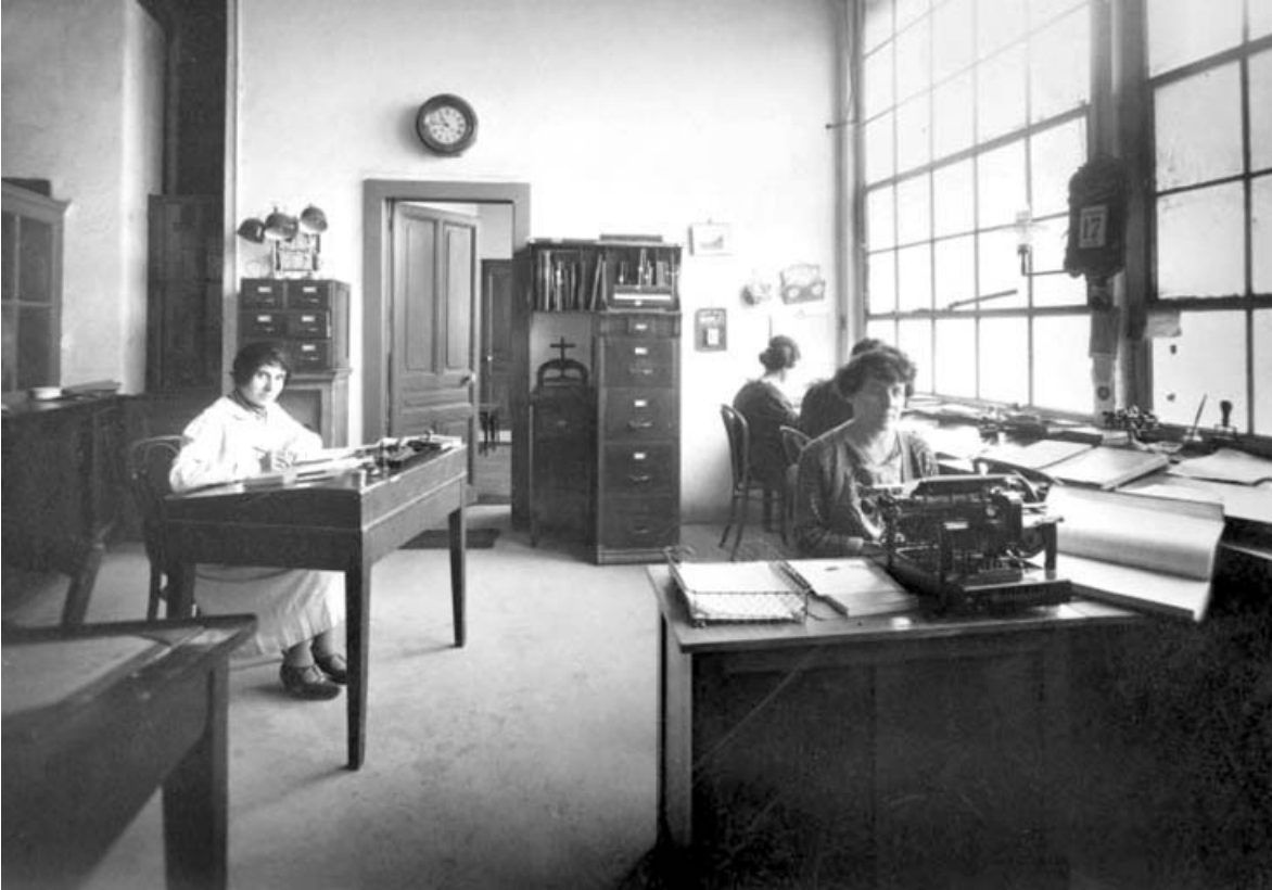
Un bureau, en 1926.