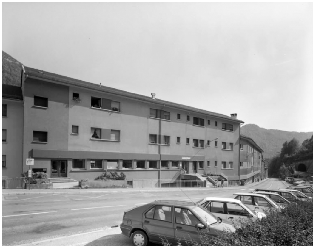
Vue d'ensemble depuis le nord.