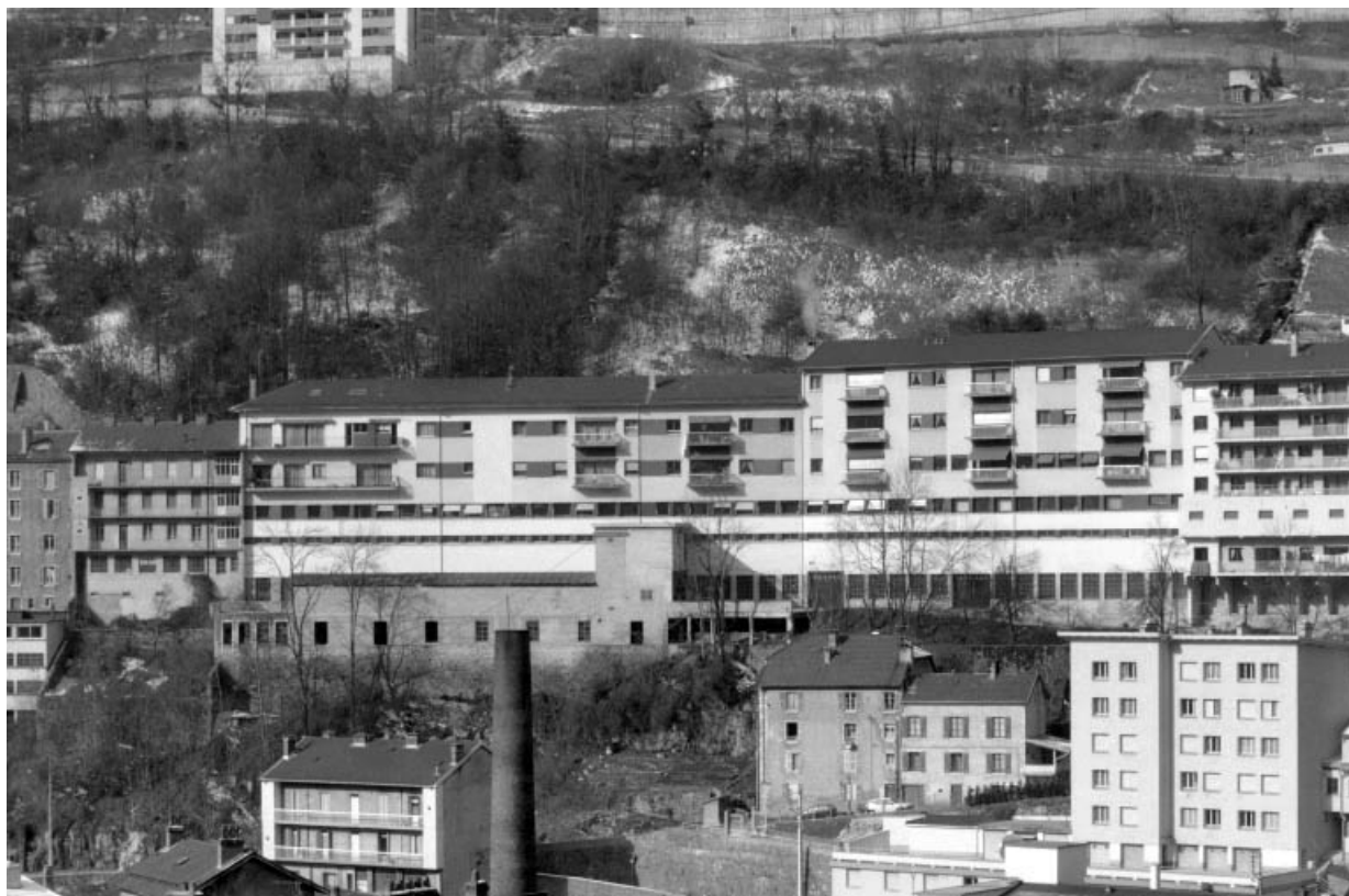
Vue d'ensemble depuis le sud-est.