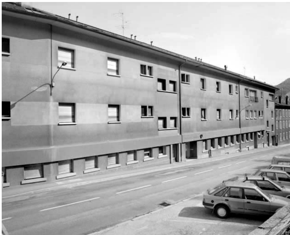
Façade antérieure des n° 12 à 14 bis. 39, Saint-Claude, 12 à 16 rue Pasteur