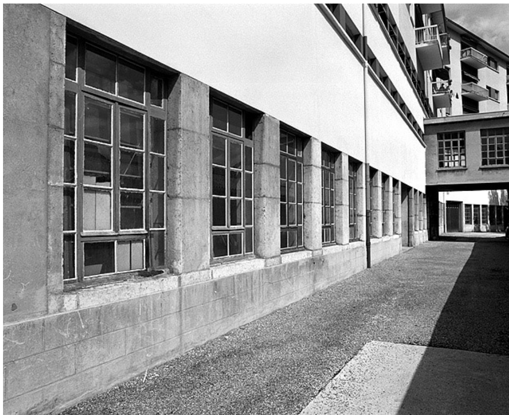
Façade postérieure : baies du 2e étage de soubassement.