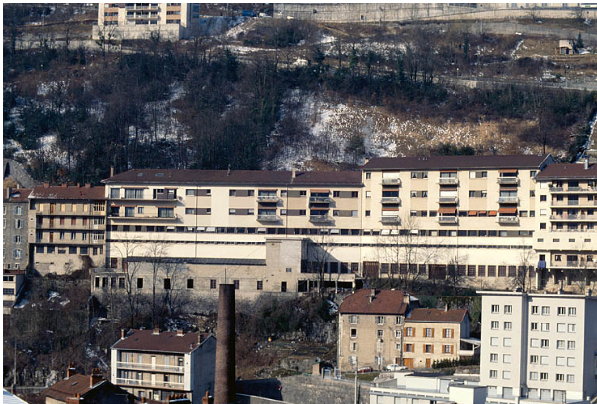
Vue d'ensemble depuis le sud-est.