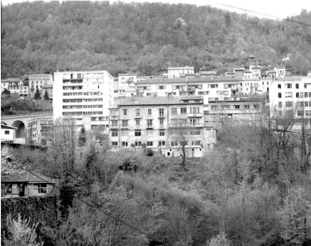
Vue d'ensemble depuis l'est.

39, Saint-Claude, 28, 28 bis, 30 rue du Pont central