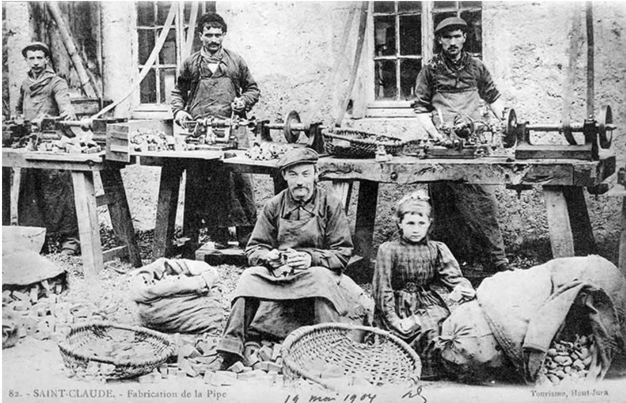
Saint-Claude. - Fabrication de la Pipe.