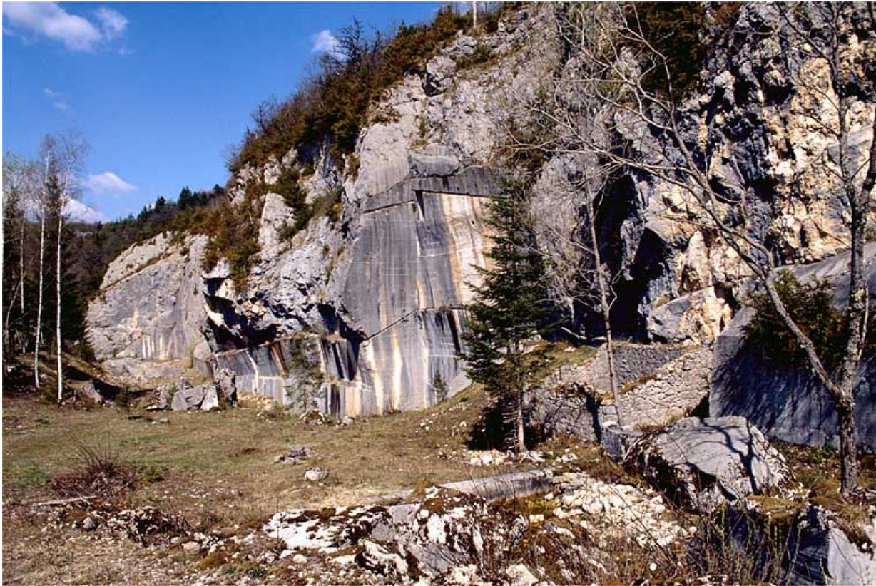
Vue d'ensemble de la carrière depuis le sud.