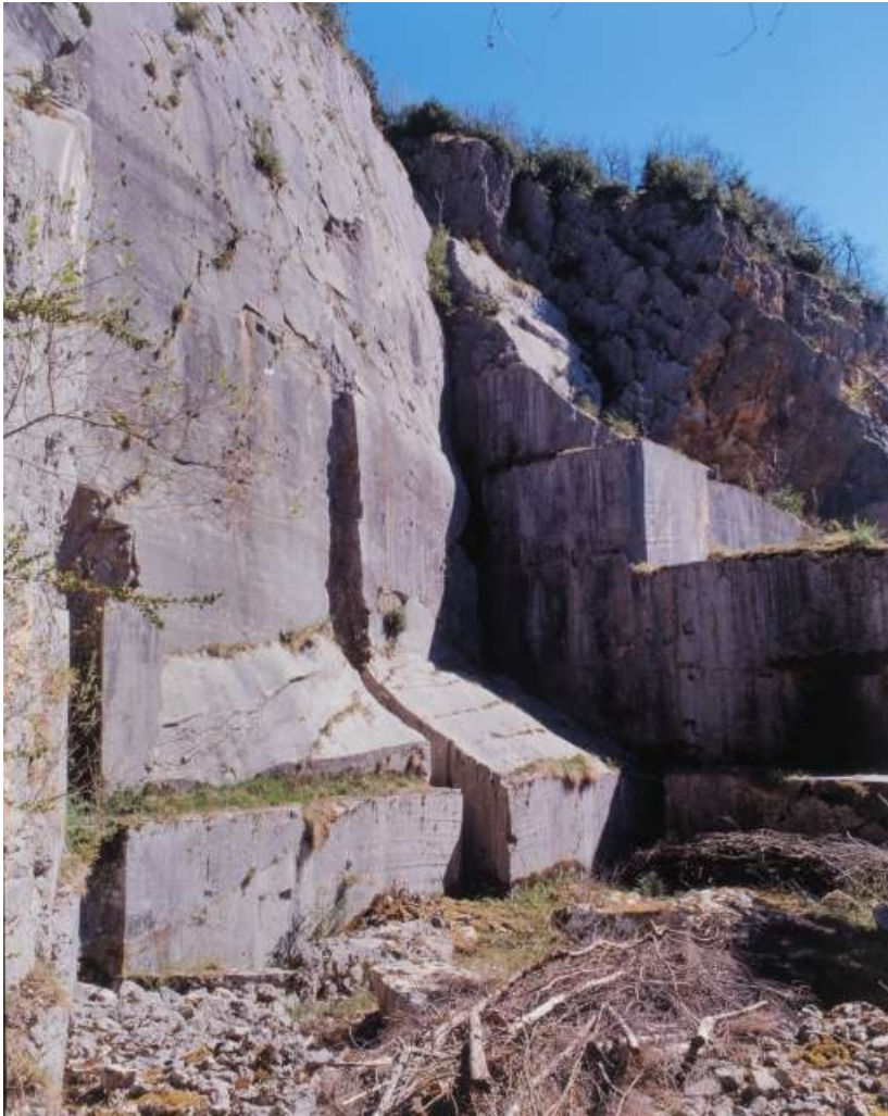
Carrière, partie nord : front de taille depuis l'intérieur de la fosse.