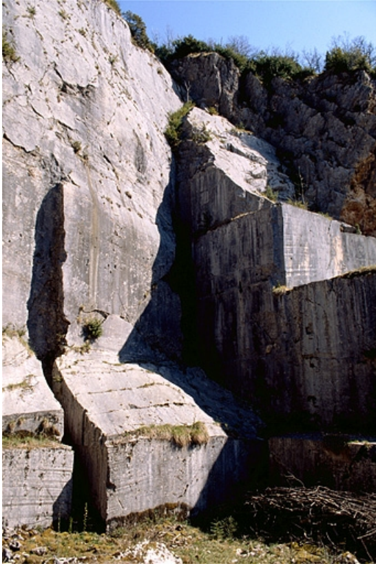
Carrière, partie nord : front de taille depuis l'intérieur de la fosse.