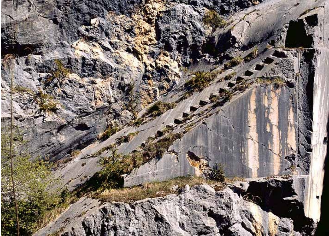
Carrière, partie nord : escalier taillé dans la paroi.