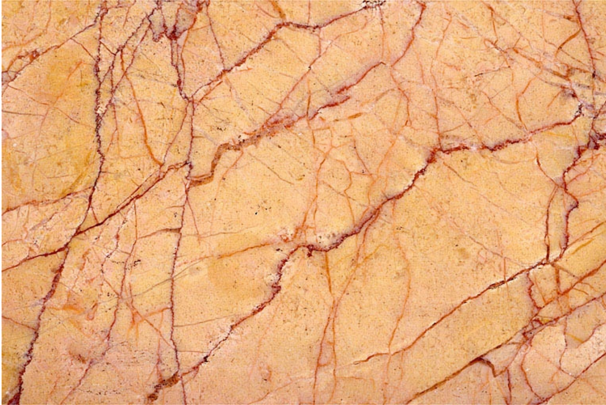
Echantillon de marbre de Pratz dit Jaune fleuri.