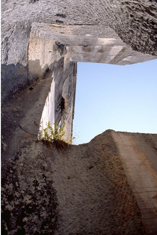
Carrière, partie nord : tranchée et puits pour le passage du fil hélicoïdal, vus du dessous. 39, Pratz, lieudit : Champied