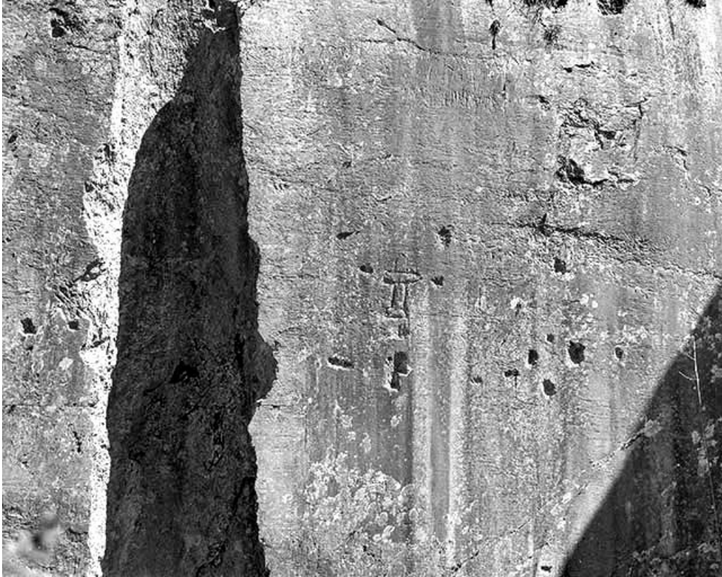
Carrière, partie nord : croix gravées dans la paroi.