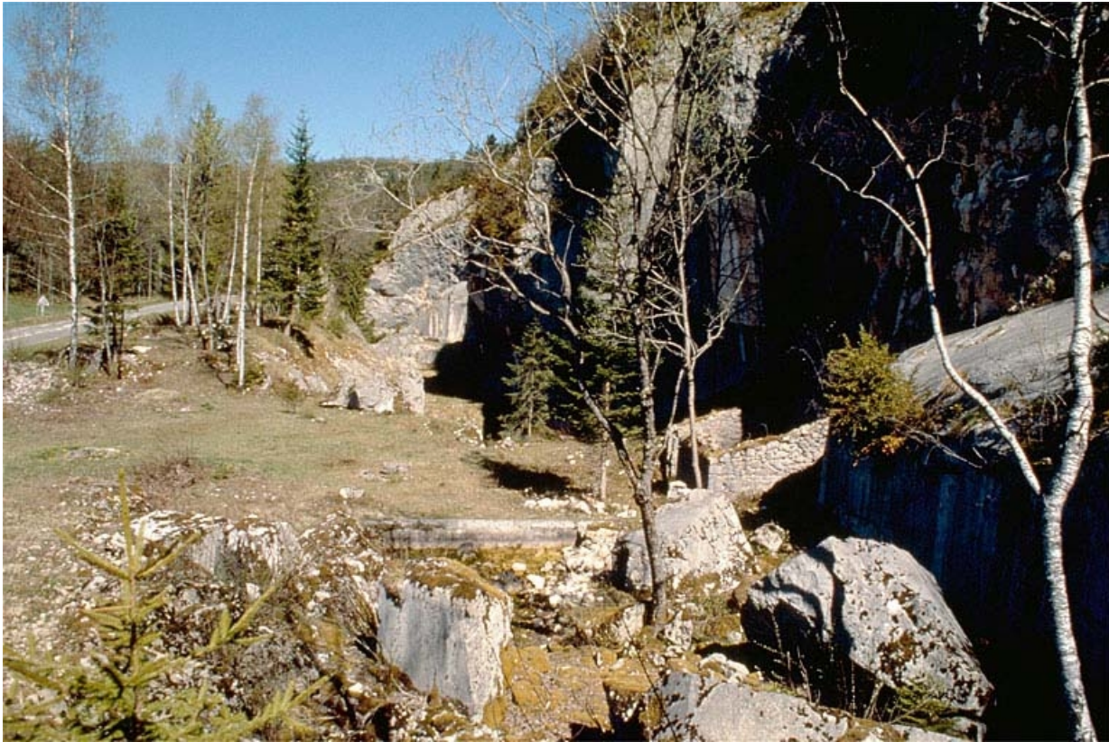
Vue d'ensemble de la carrière depuis le sud.