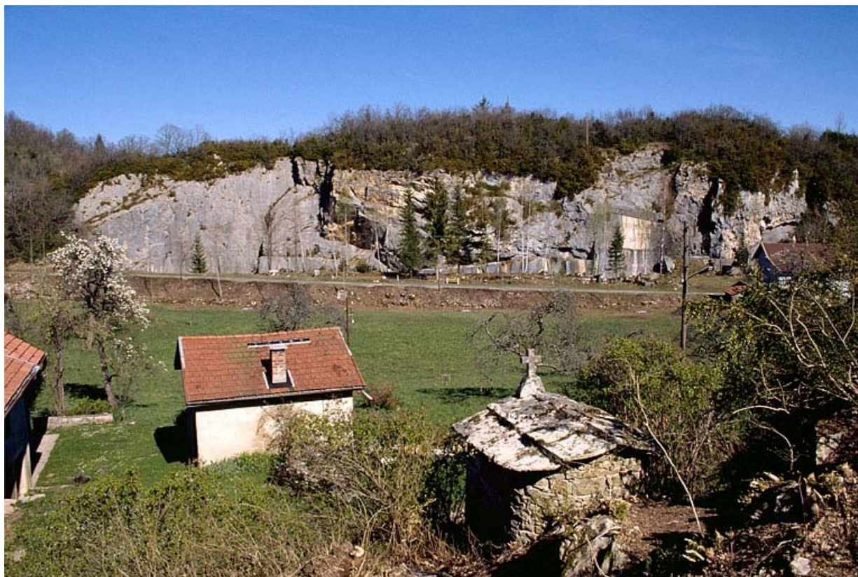
Vue d'ensemble du site depuis l'ouest.