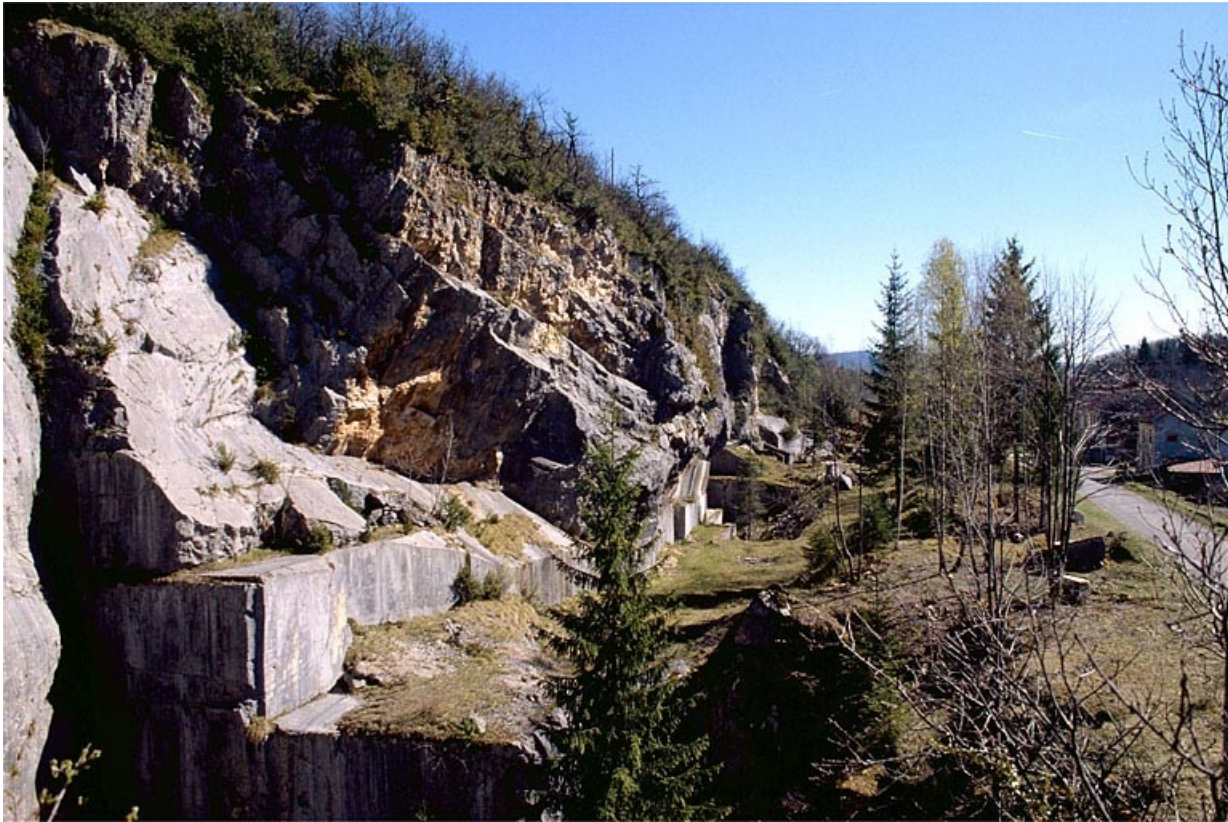
Vue d'ensemble de la carrière depuis le nord.