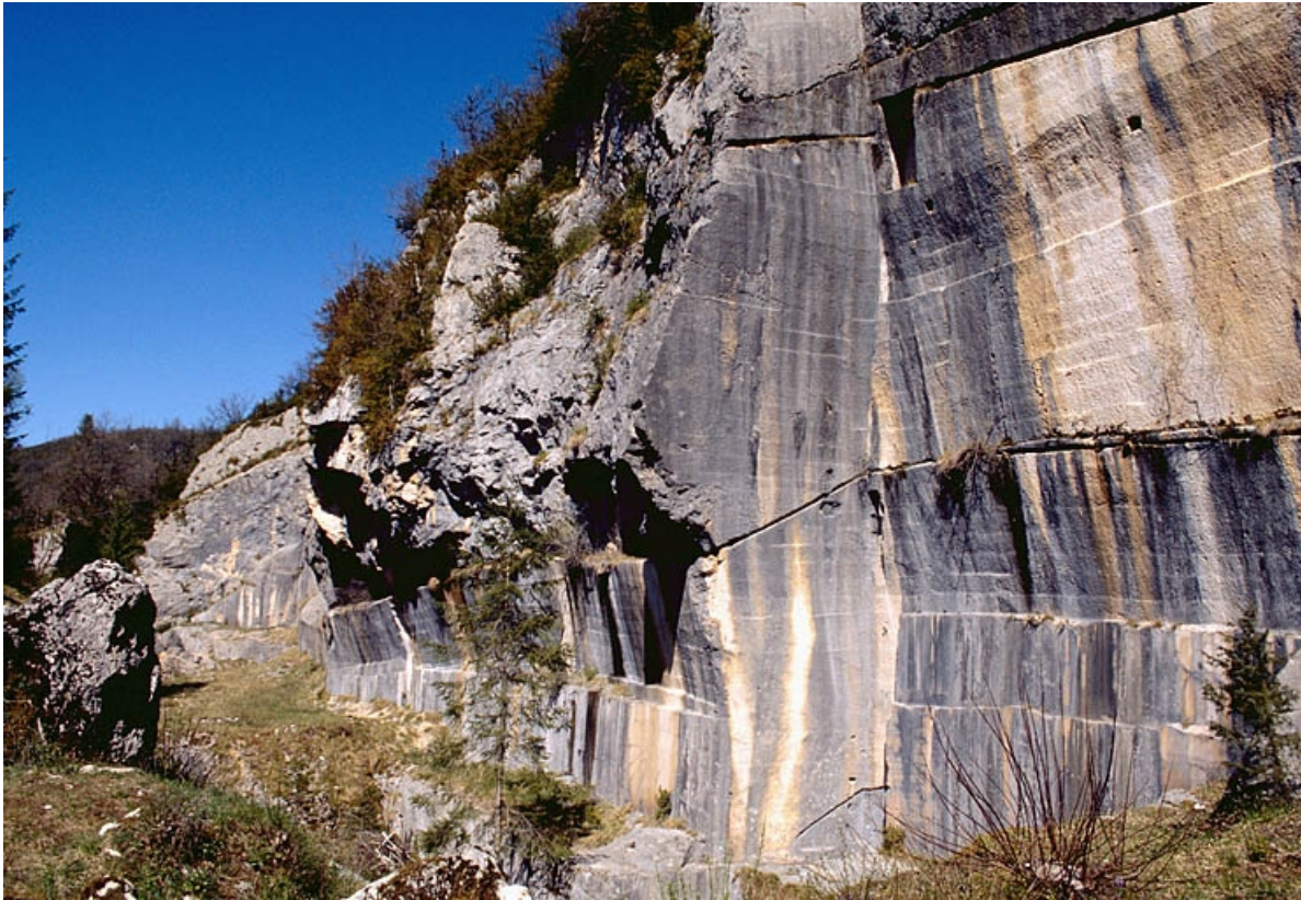
Carrière, partie sud : vue du front de taille en enfilade.