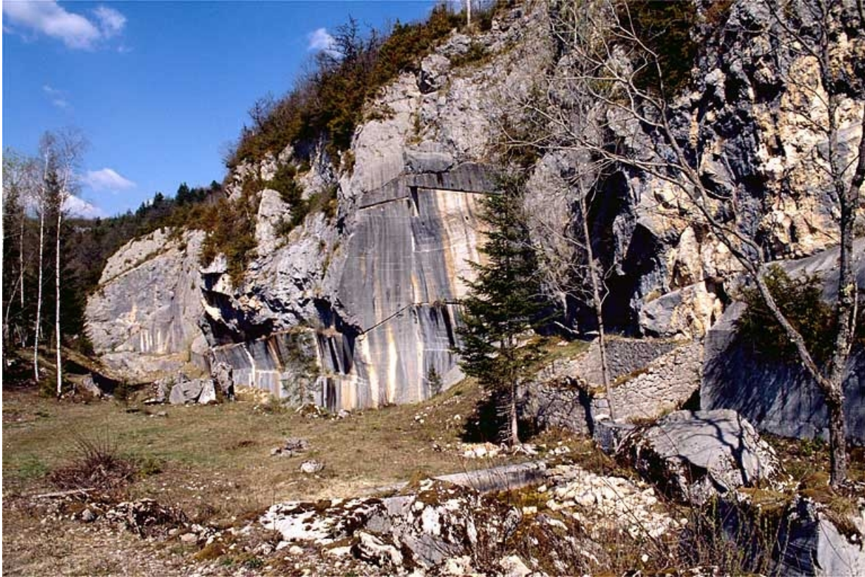
Vue d'ensemble de la carrière depuis le sud.