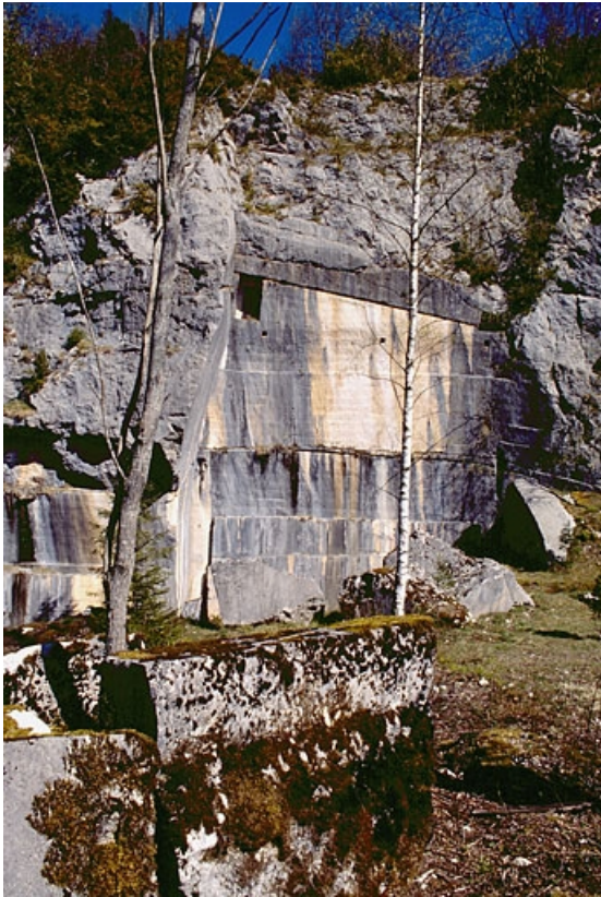
Carrière, partie sud : vue d'ensemble du front de taille. 39, Pratz, lieudit : Champied