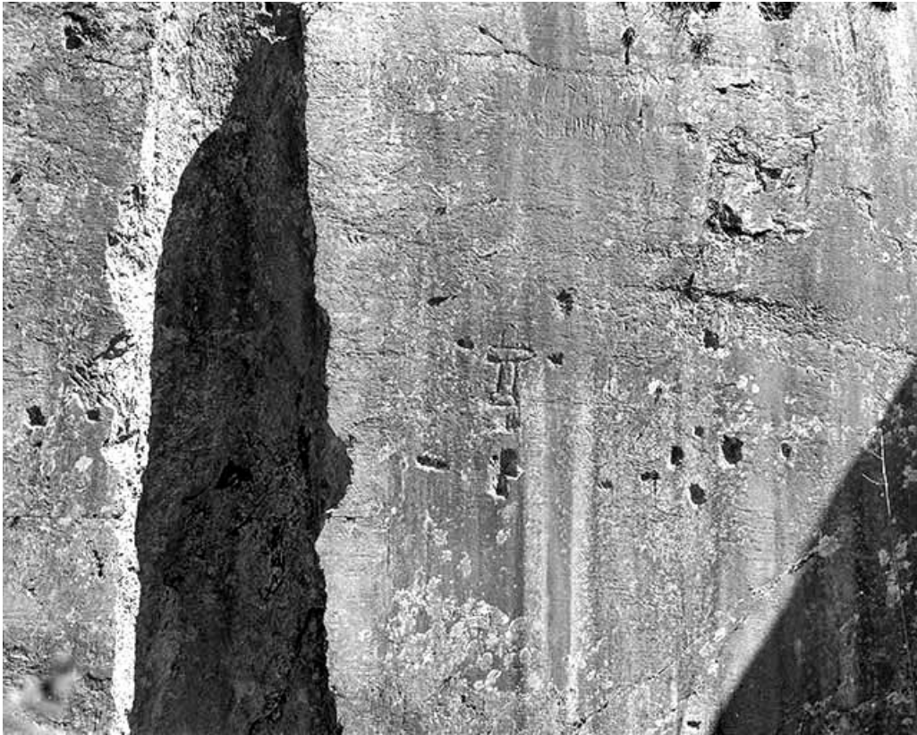
Carrière, partie nord : croix gravées dans la paroi.