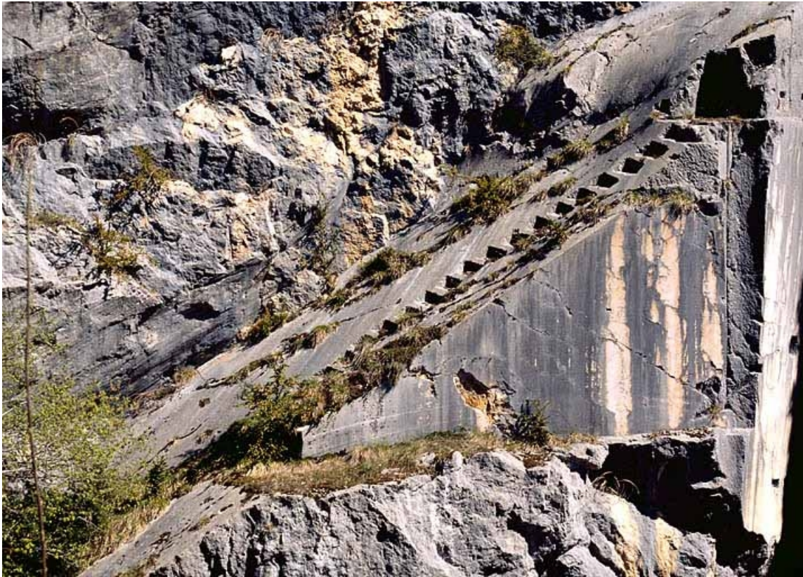
Carrière, partie nord : escalier taillé dans la paroi.