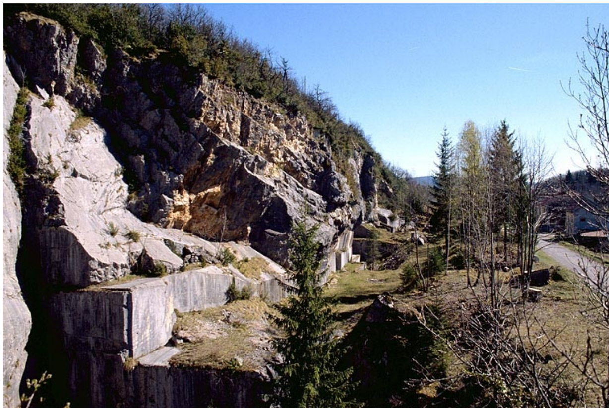
Vue d'ensemble de la carrière depuis le nord.