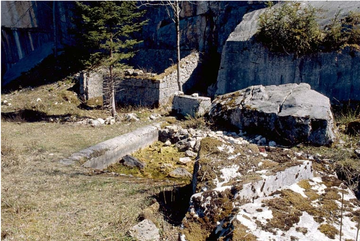
Carrière, partie sud : bâtiment en ruine et bassin.