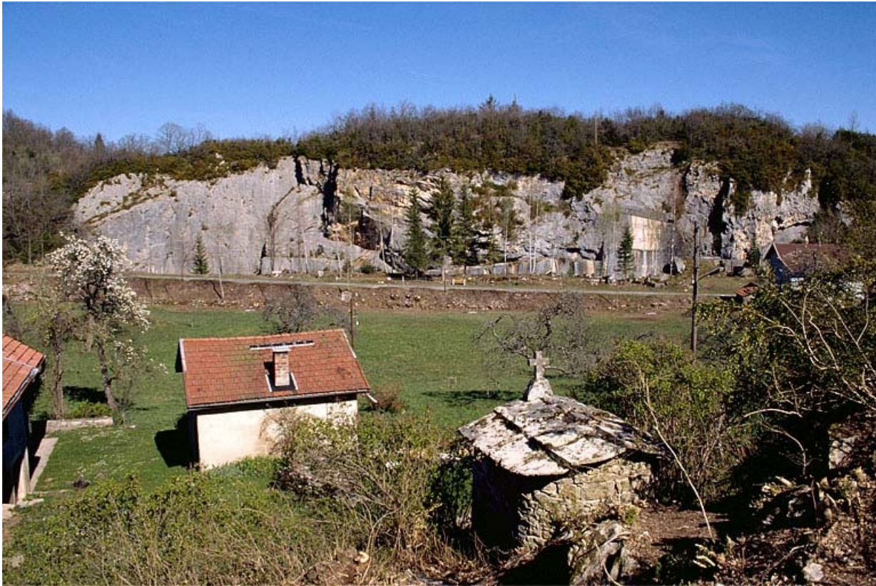
Vue d'ensemble du site depuis l'ouest.