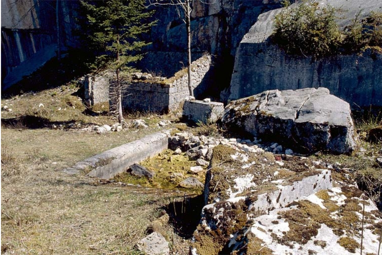
Carrière, partie sud : bâtiment en ruine et bassin.