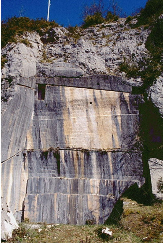
Carrière, partie sud : front de taille.