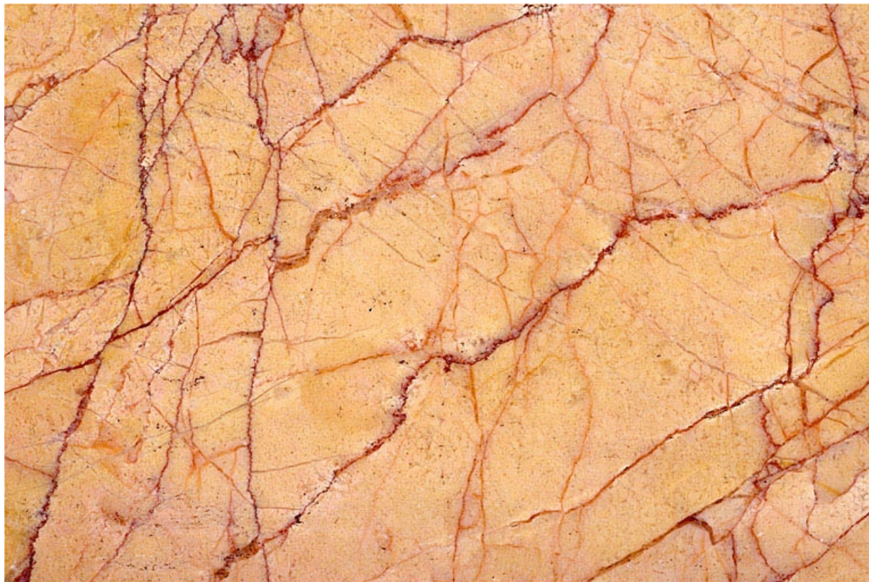
Echantillon de marbre de Pratz dit Jaune fleuri.