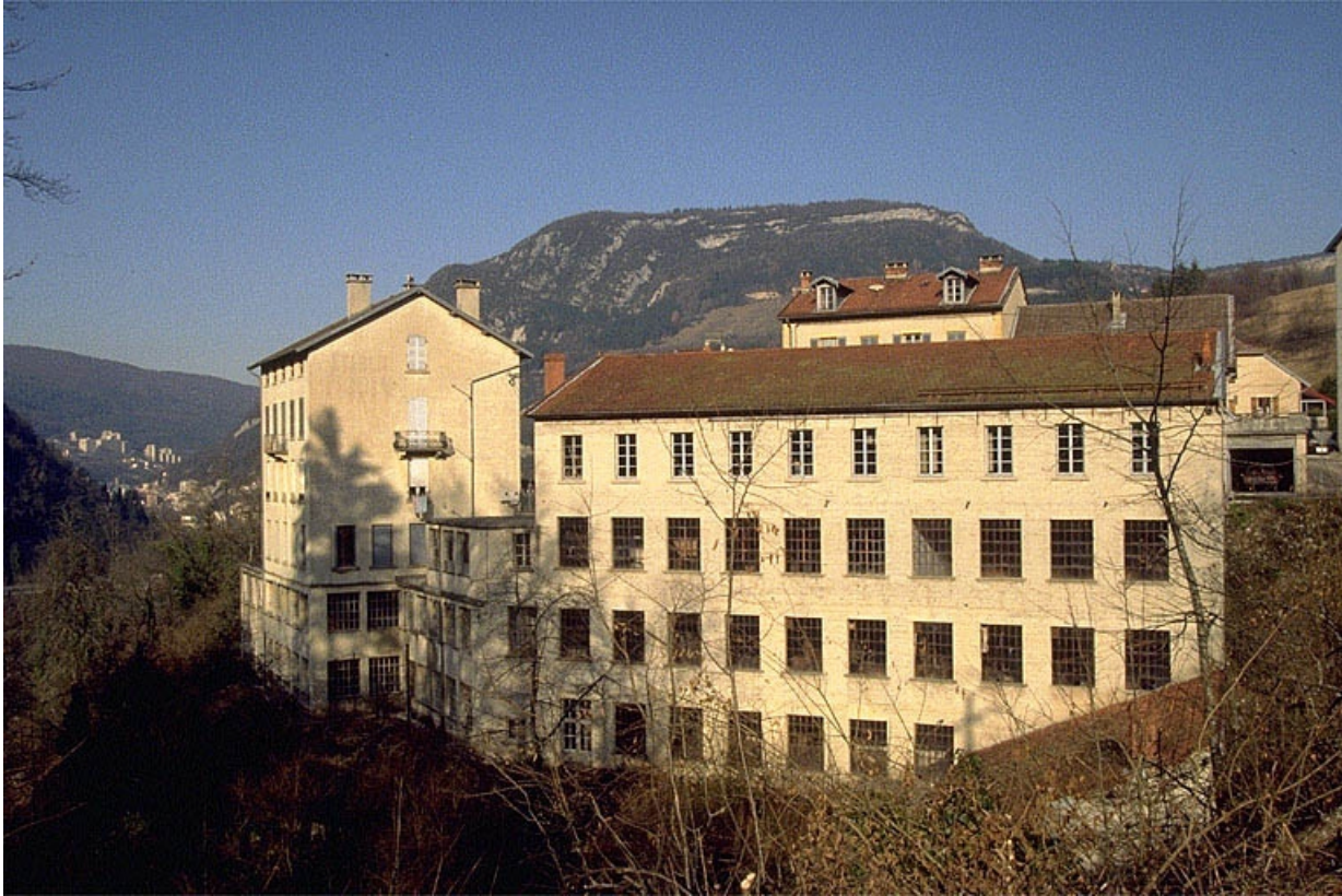
Usine vue du sud.

39, Villard-Saint-Sauveur, lieudit : l'Essard