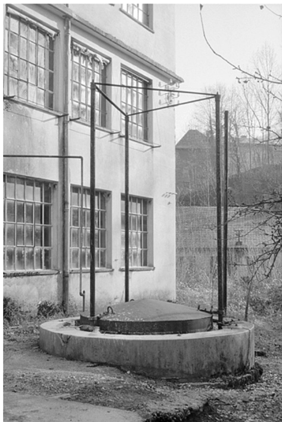
Gazomètre (stockage d'acétylène).

39, Villard-Saint-Sauveur, lieudit : l'Essard