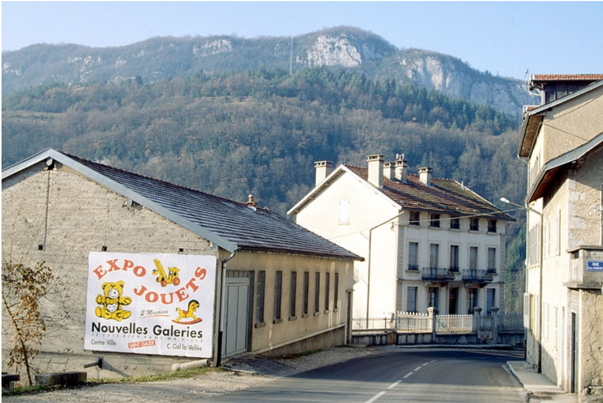
Façade antérieure de l'atelier de fabrication et du logement patronal.

39, Villard-Saint-Sauveur, lieudit : l'Essard