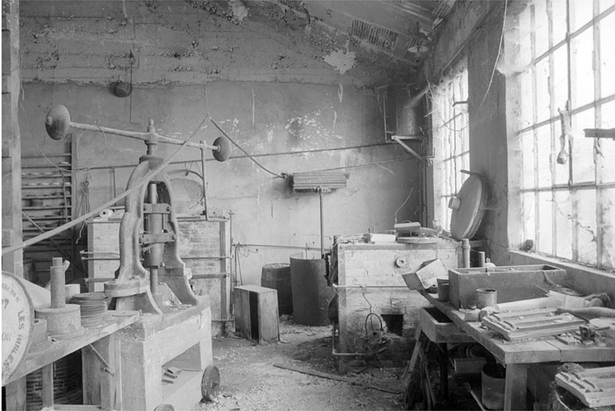
Intérieur de l'atelier de fabrication des cylindres (G).

39, Villard-Saint-Sauveur, lieudit : l'Essard