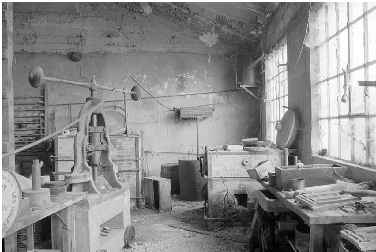
Intérieur de l'atelier de fabrication des cylindres (G).

39, Villard-Saint-Sauveur, lieudit : l'Essard