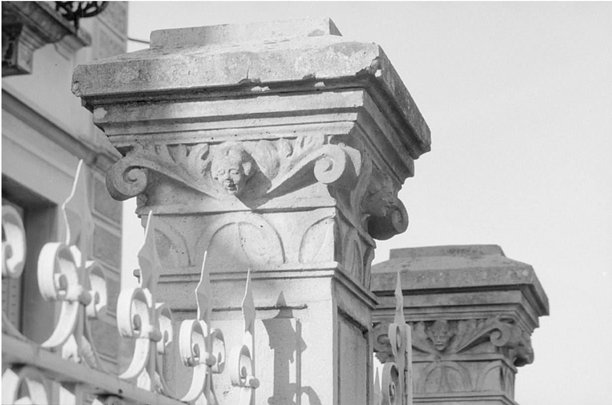
Chapiteau des piliers du portail d'entrée.

39, Villard-Saint-Sauveur, lieudit : l'Essard