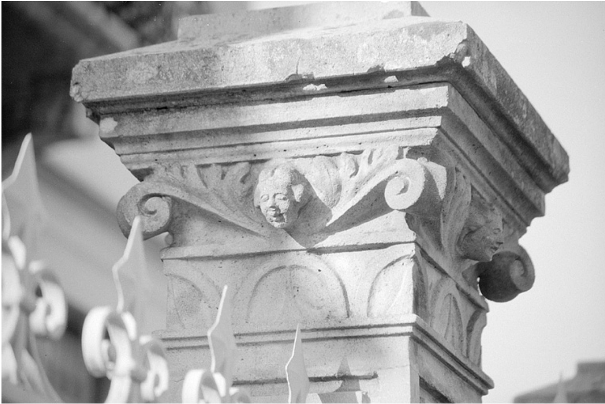
Détail d'un chapiteau.

39, Villard-Saint-Sauveur, lieudit : l'Essard