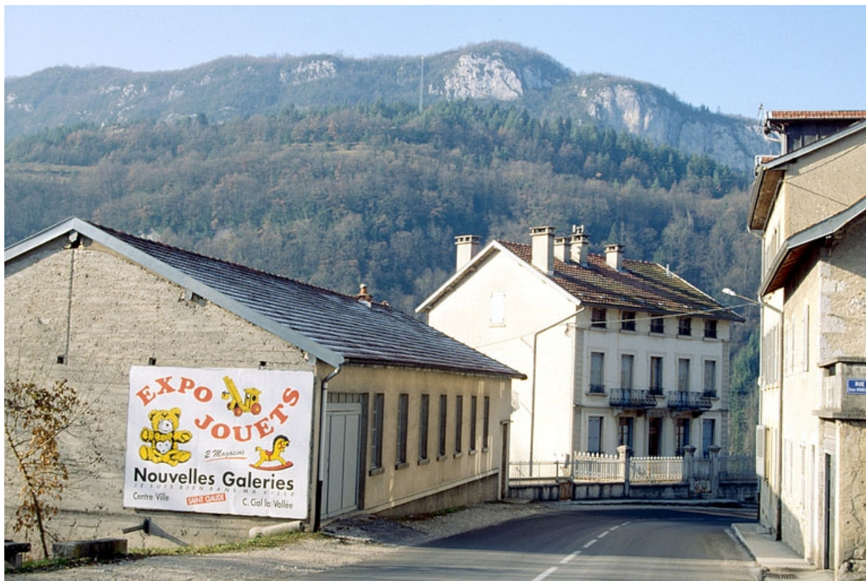
Façade antérieure de l'atelier de fabrication et du logement patronal.

39, Villard-Saint-Sauveur, lieudit : l'Essard