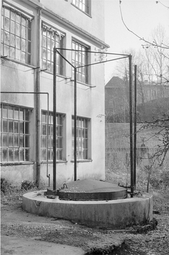
Gazomètre (stockage d'acétylène).

39, Villard-Saint-Sauveur, lieudit : l'Essard