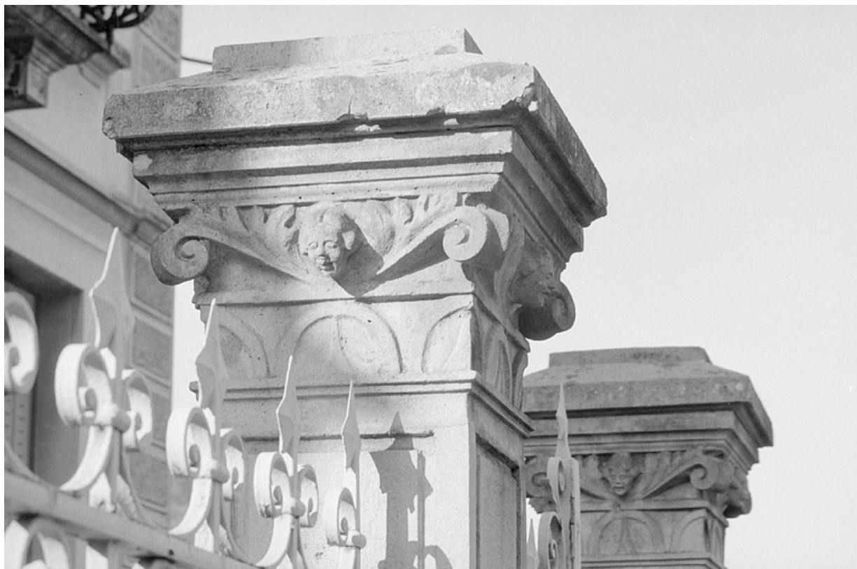
Chapiteau des piliers du portail d'entrée.

39, Villard-Saint-Sauveur, lieudit : l'Essard