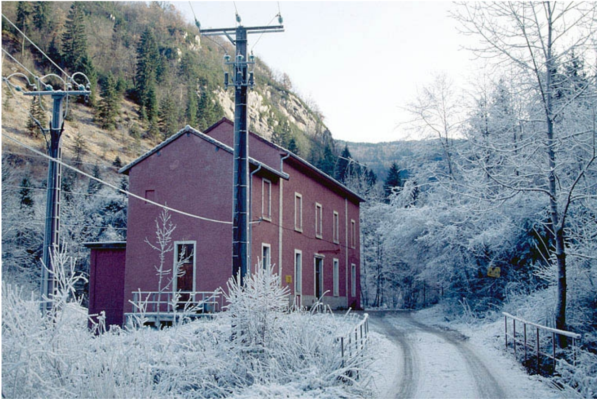
Façade antérieure et latérale gauche.