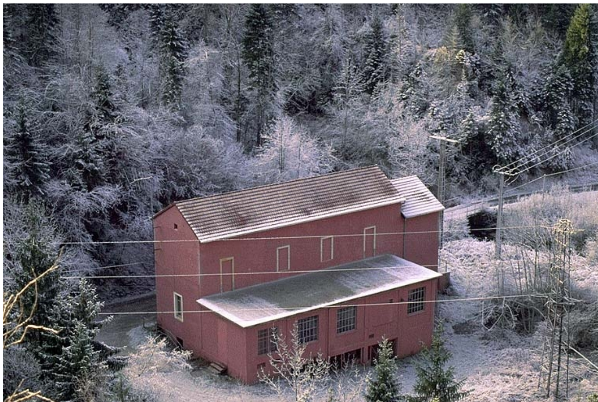
Façade postérieure et latérale droite.