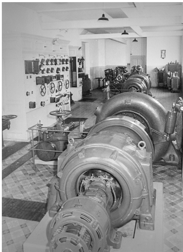
Usine du Flumen. 1940 : la salle des machines (3 groupes). 39, Septmoncel, lieudit : en Flumen