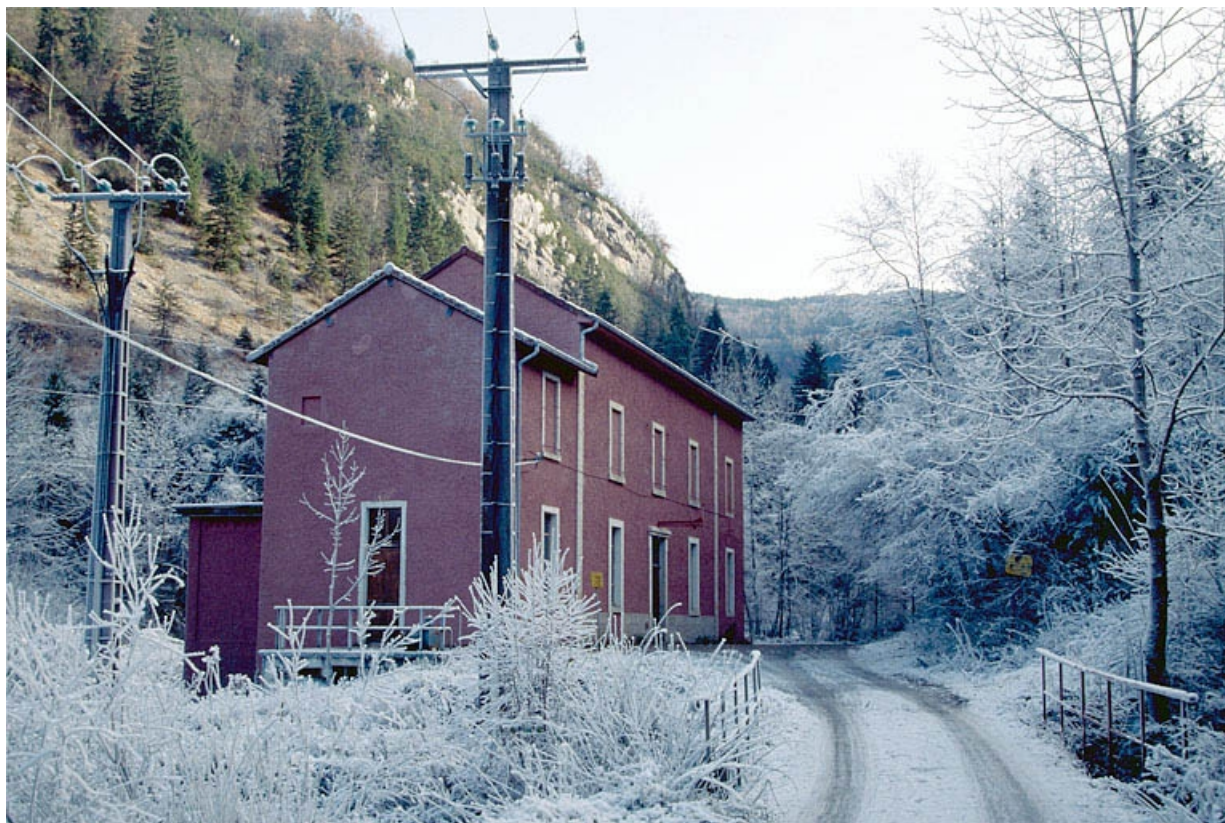
Façade antérieure et latérale gauche.