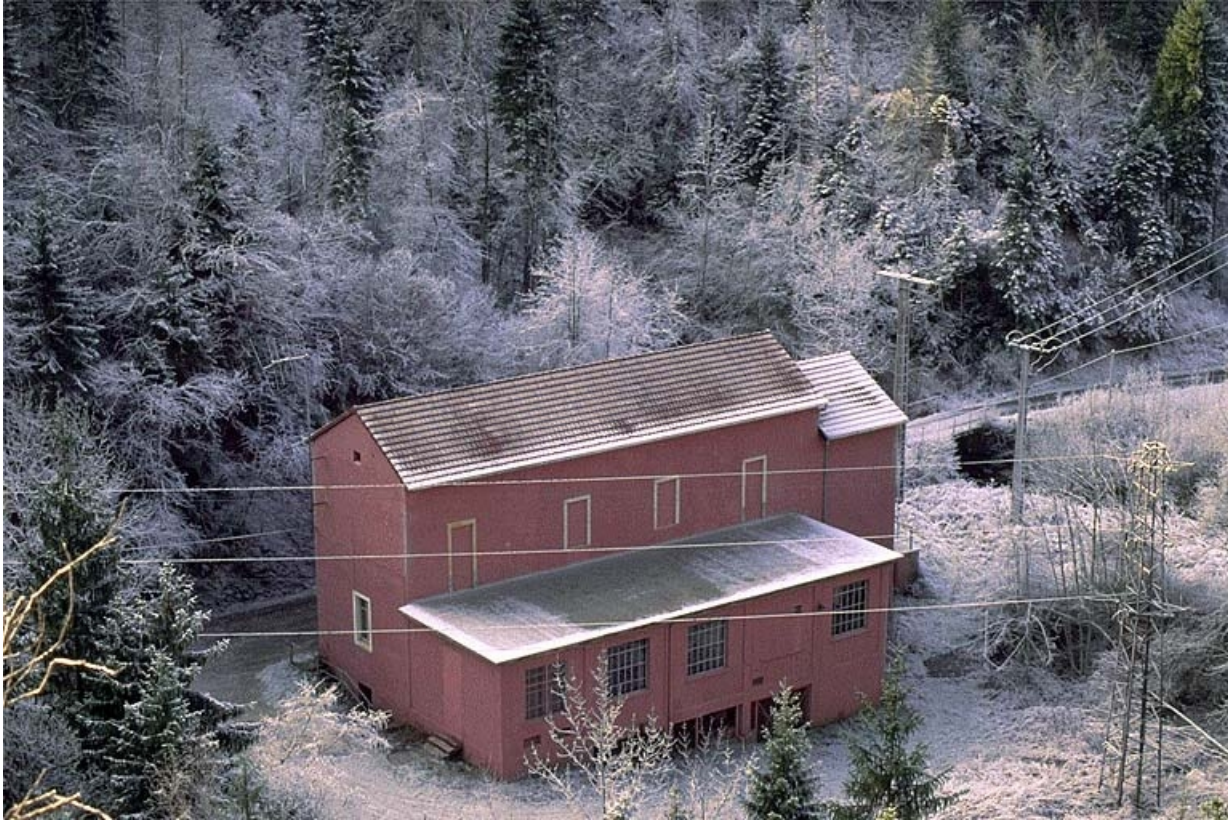
Façade postérieure et latérale droite.