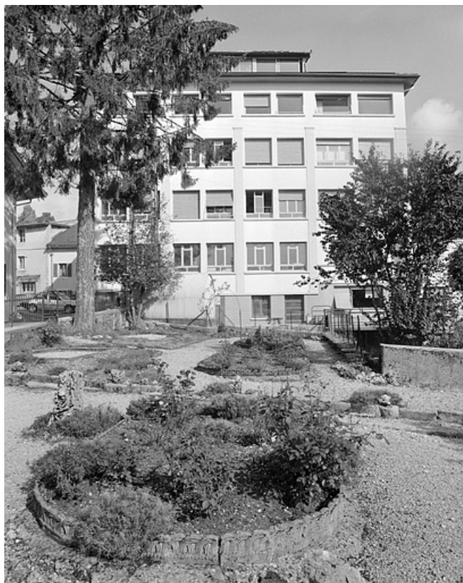
Parc et façade latérale de l'usine (E).