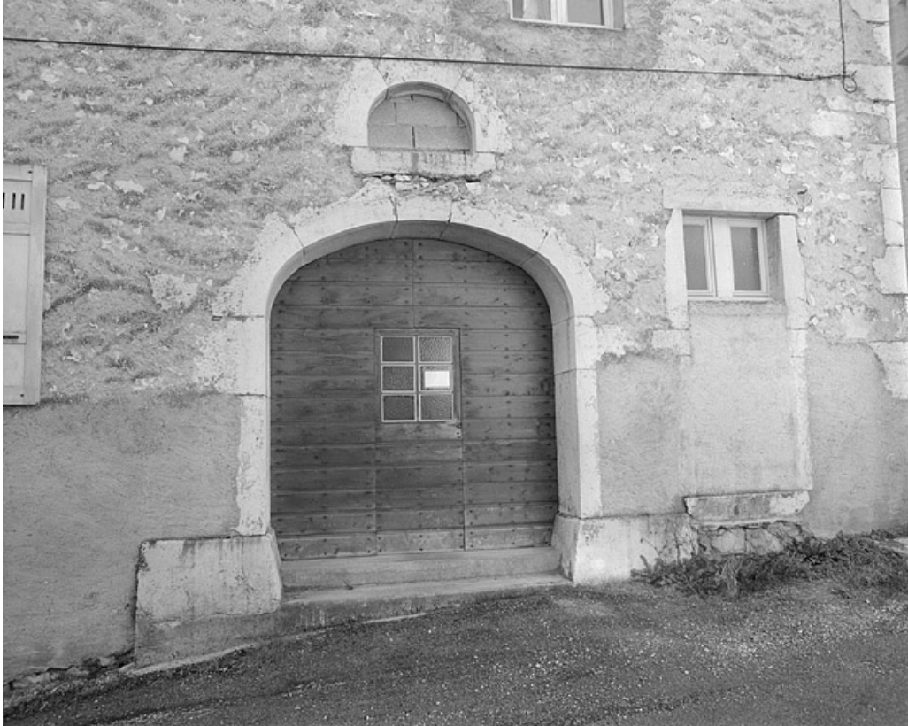
Bureau : porte dans le mur pignon nord-ouest.