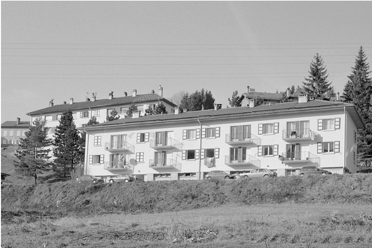
Logement d'ouvriers, depuis le sud-est.