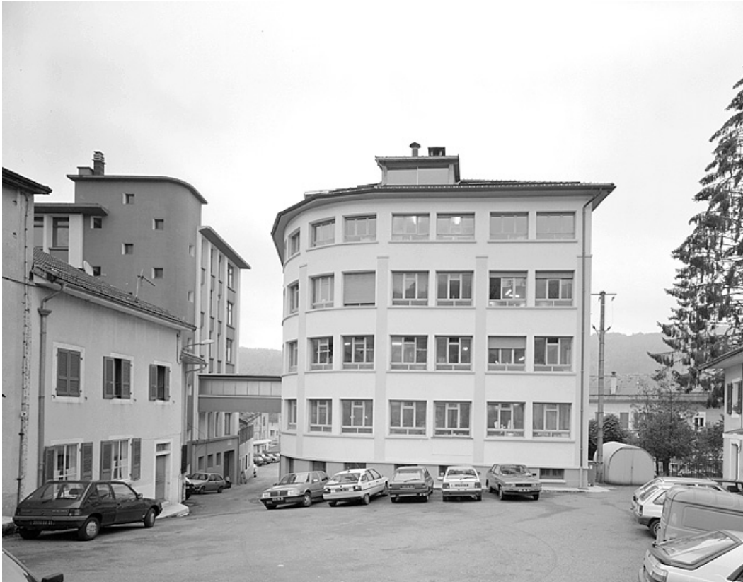
Usines depuis la Place centrale.