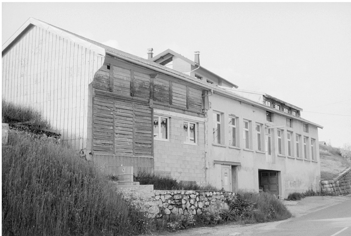
Atelier de mécanique (ancienne fabrique de meubles Julliard). 39, Septmoncel place Dalloz