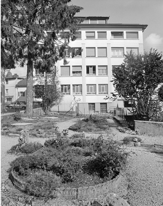
Parc et façade latérale de l'usine (E).