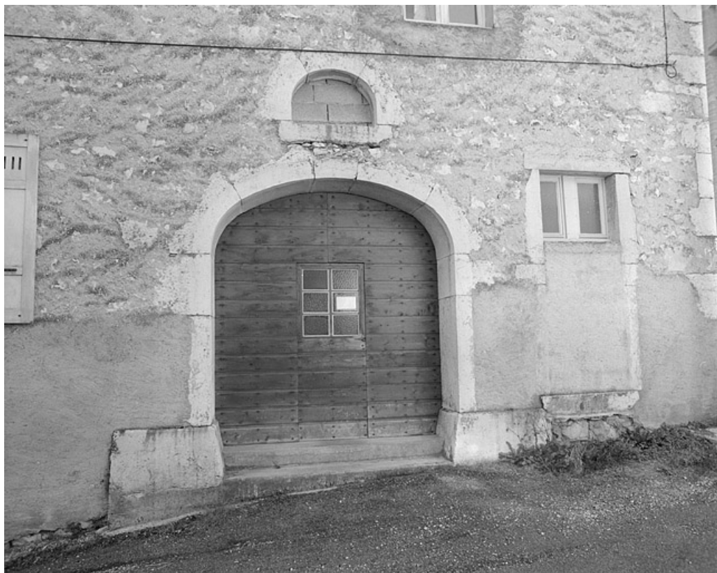
Bureau : porte dans le mur pignon nord-ouest.