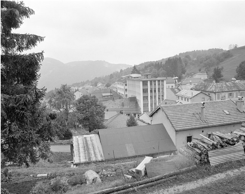
Vue d'ensemble du village et des usines, depuis le nord.