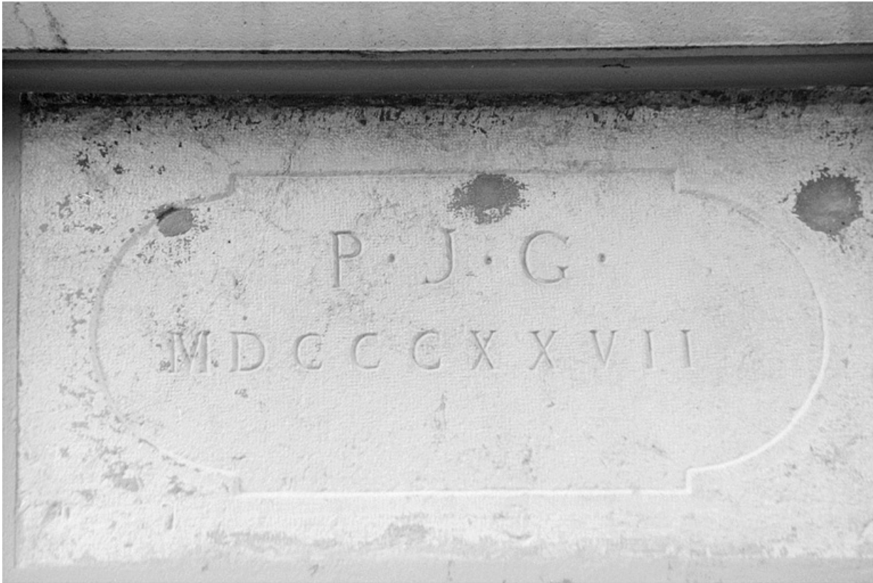
Usine (B) : pierre datée en remploi.