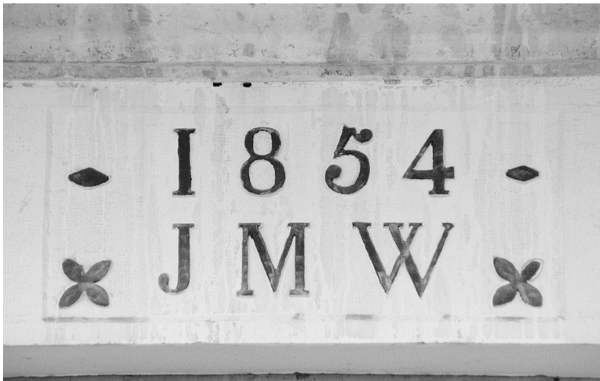
Bureau : linteau daté.