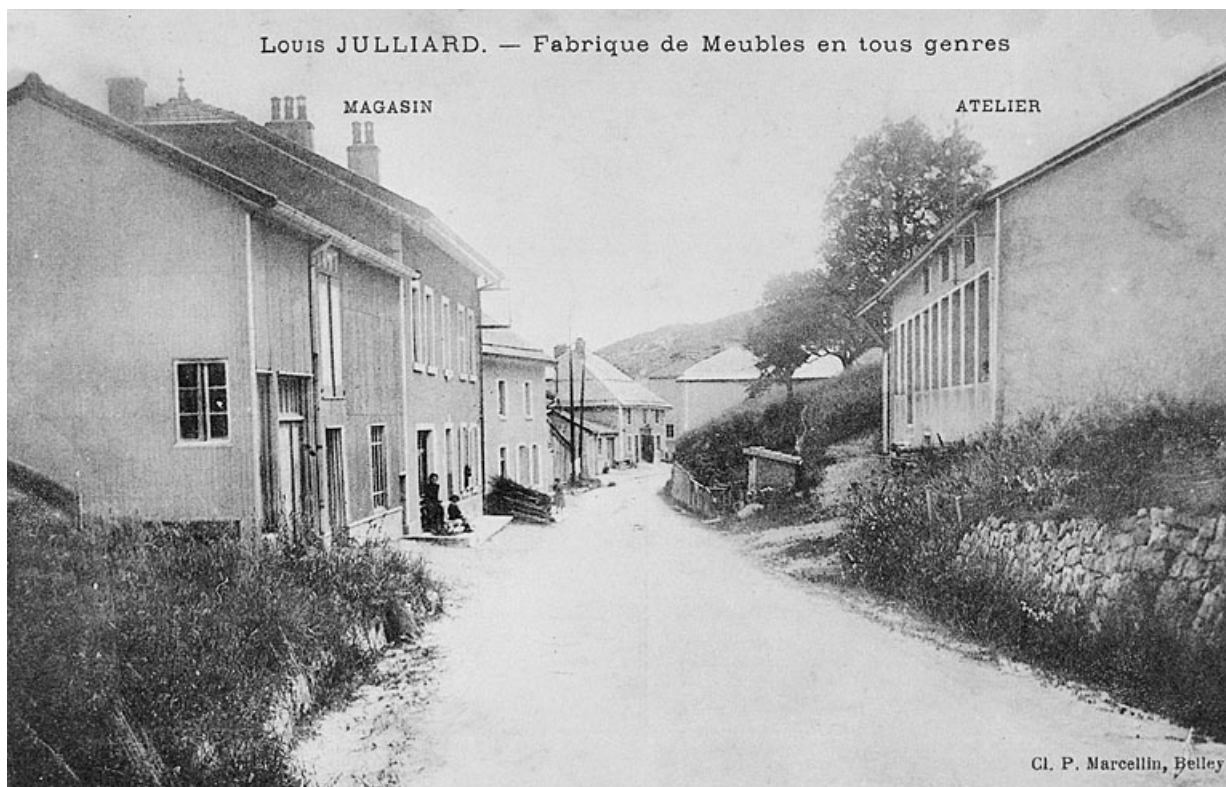
Louis Julliard. - Fabrique de meubles en tous genres. 39, Septmoncel place Dalloz