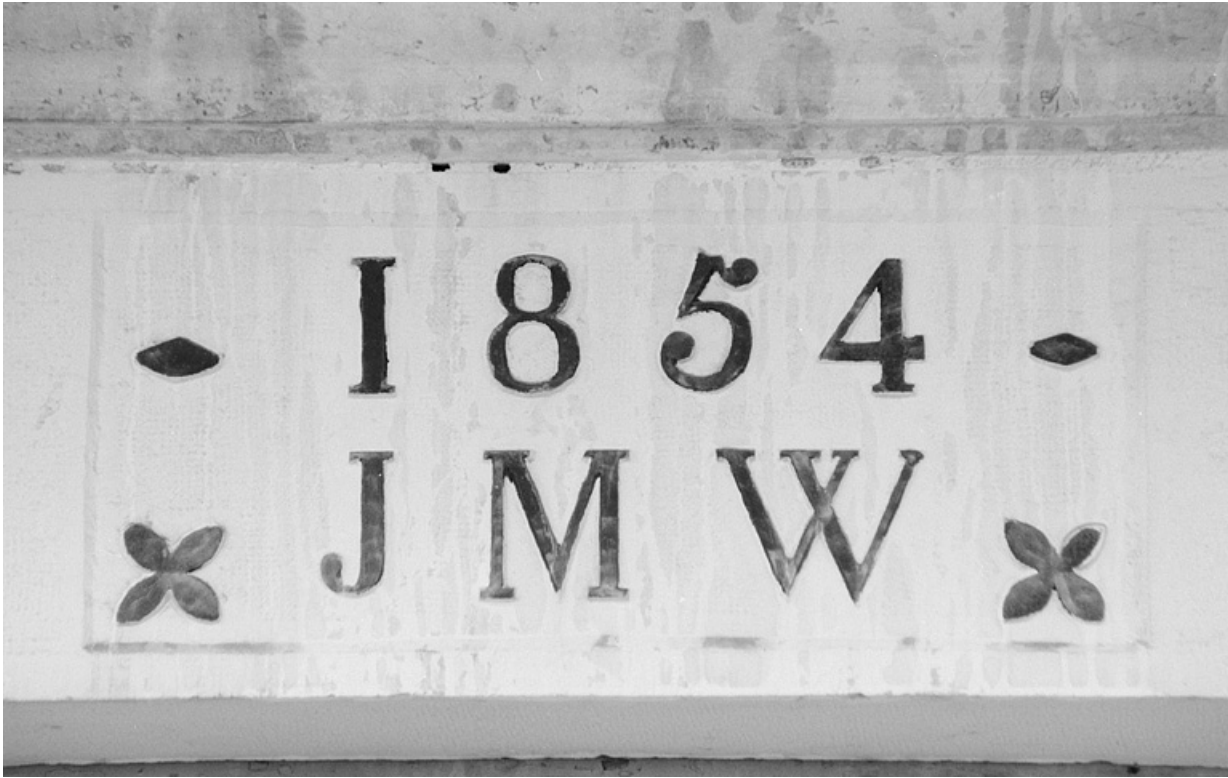
Bureau : linteau daté.