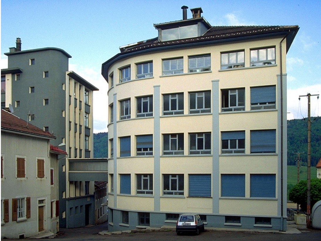
Usines depuis la Place centrale.