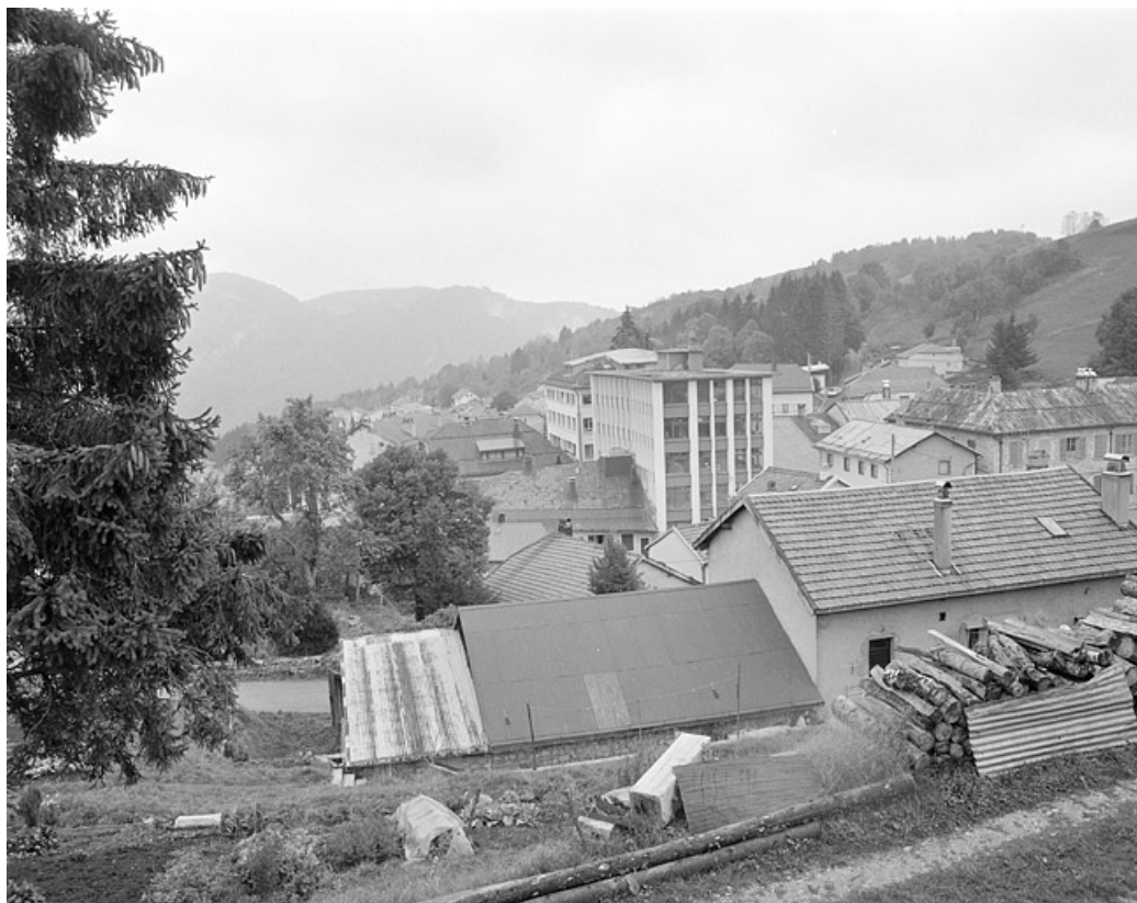
Vue d'ensemble du village et des usines, depuis le nord.