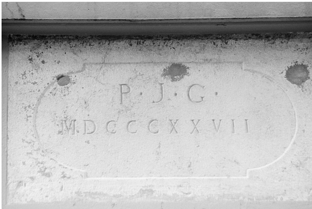
Usine (B) : pierre datée en remploi.