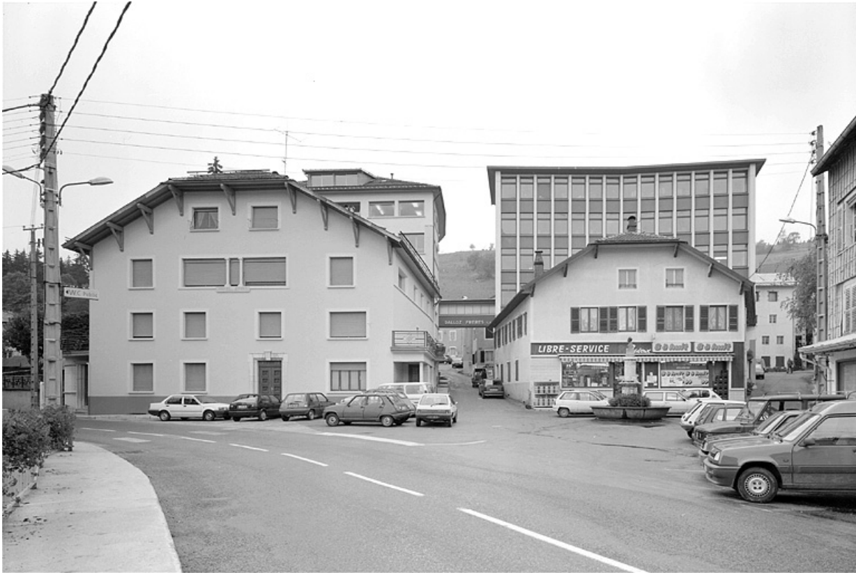
Place Dalloz, logement patronal.