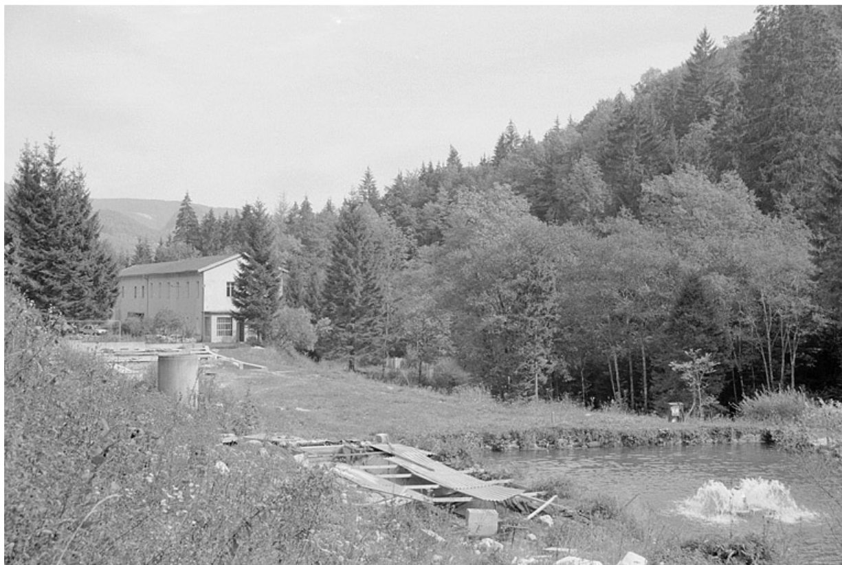
Vue d'ensemble depuis le sud-ouest.