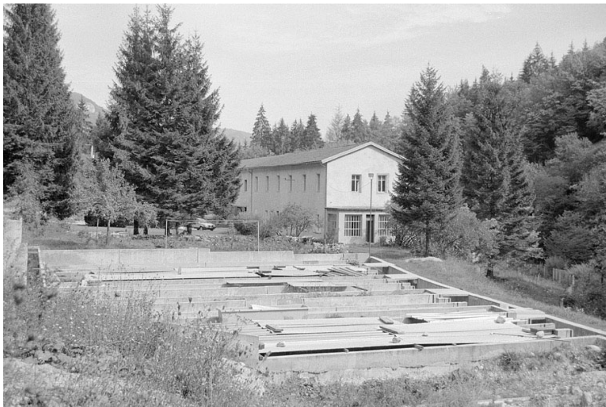
Bassins et bâtiment, depuis le sud-ouest.