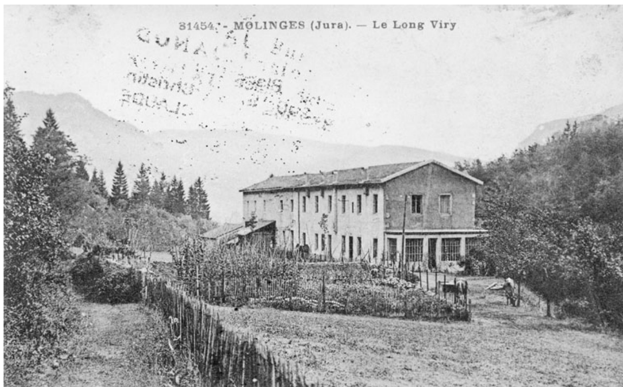
Molinges (Jura). - Le Long Viry.