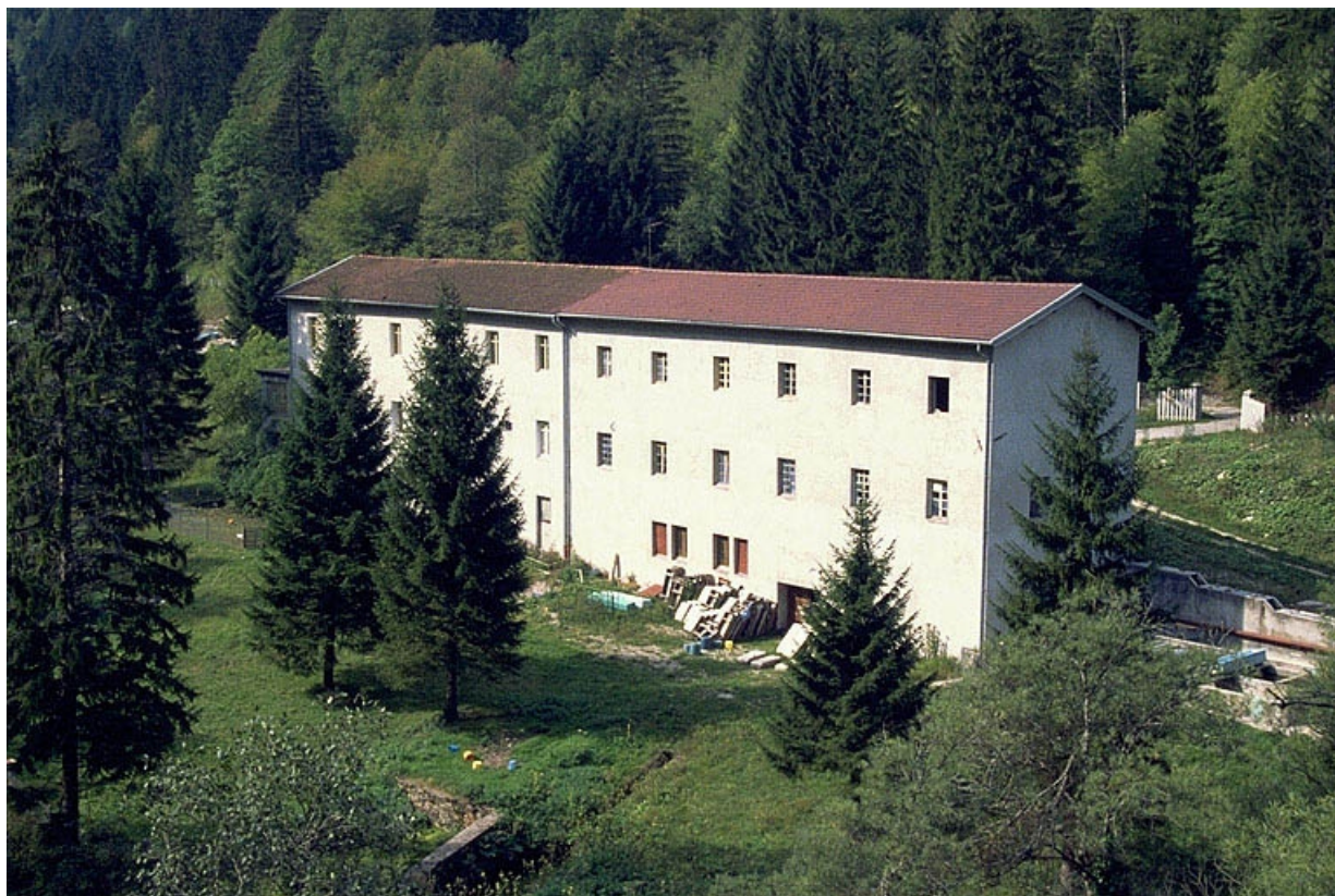
Vue d'ensemble depuis l'est (façade postérieure).