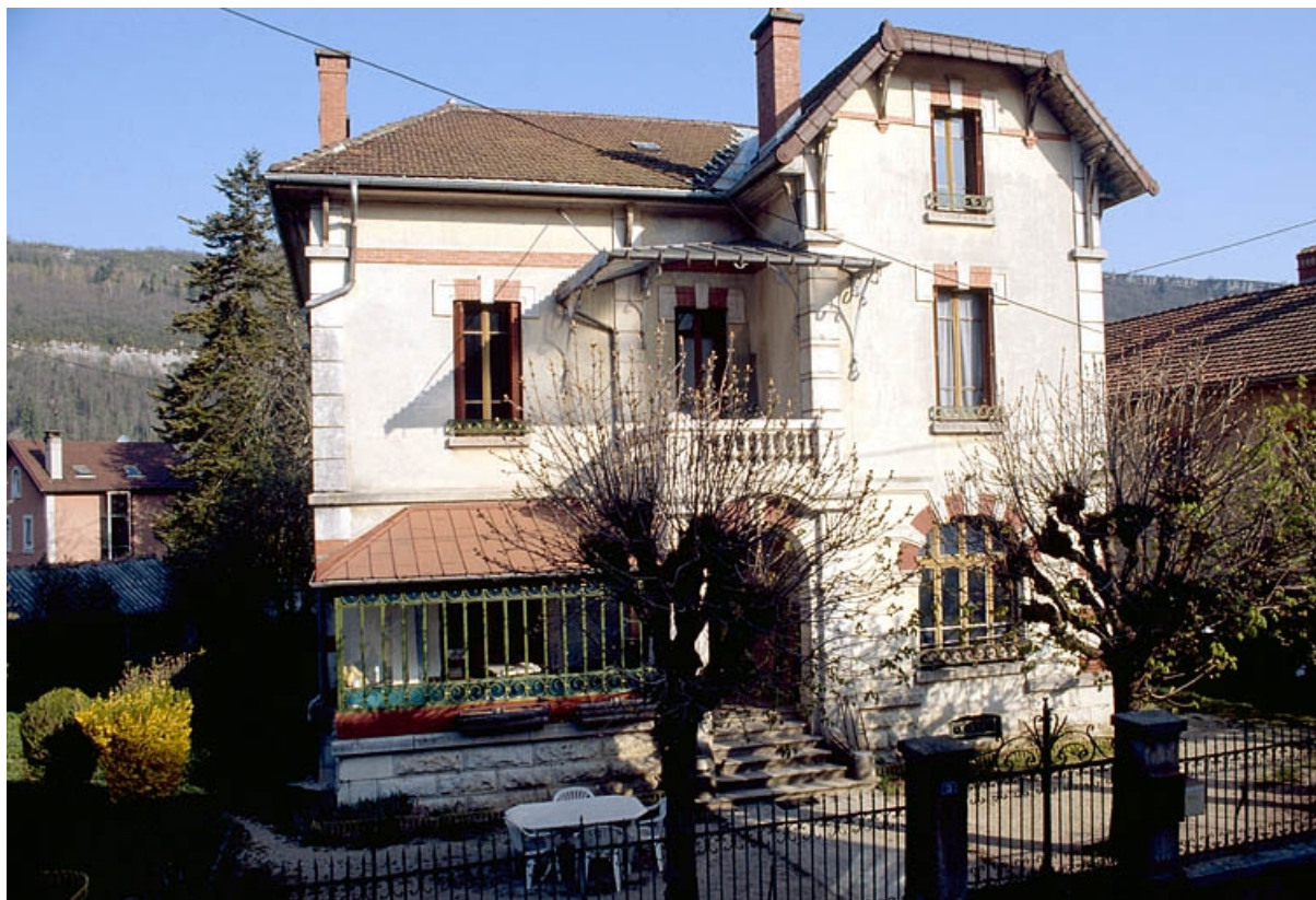
Maison d'industriel à Molinges : façade antérieure.