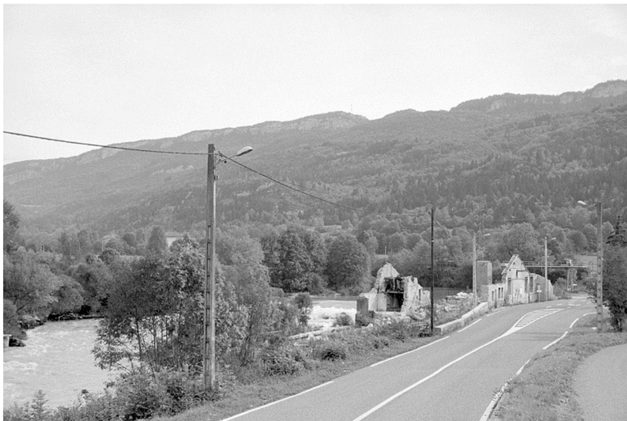
Usine de Molinges : vestiges. 39, Molinges