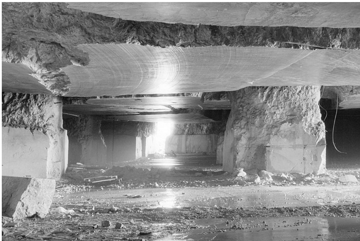
Carrière souterraine de Chassal : galerie latérale. 39, Molinges