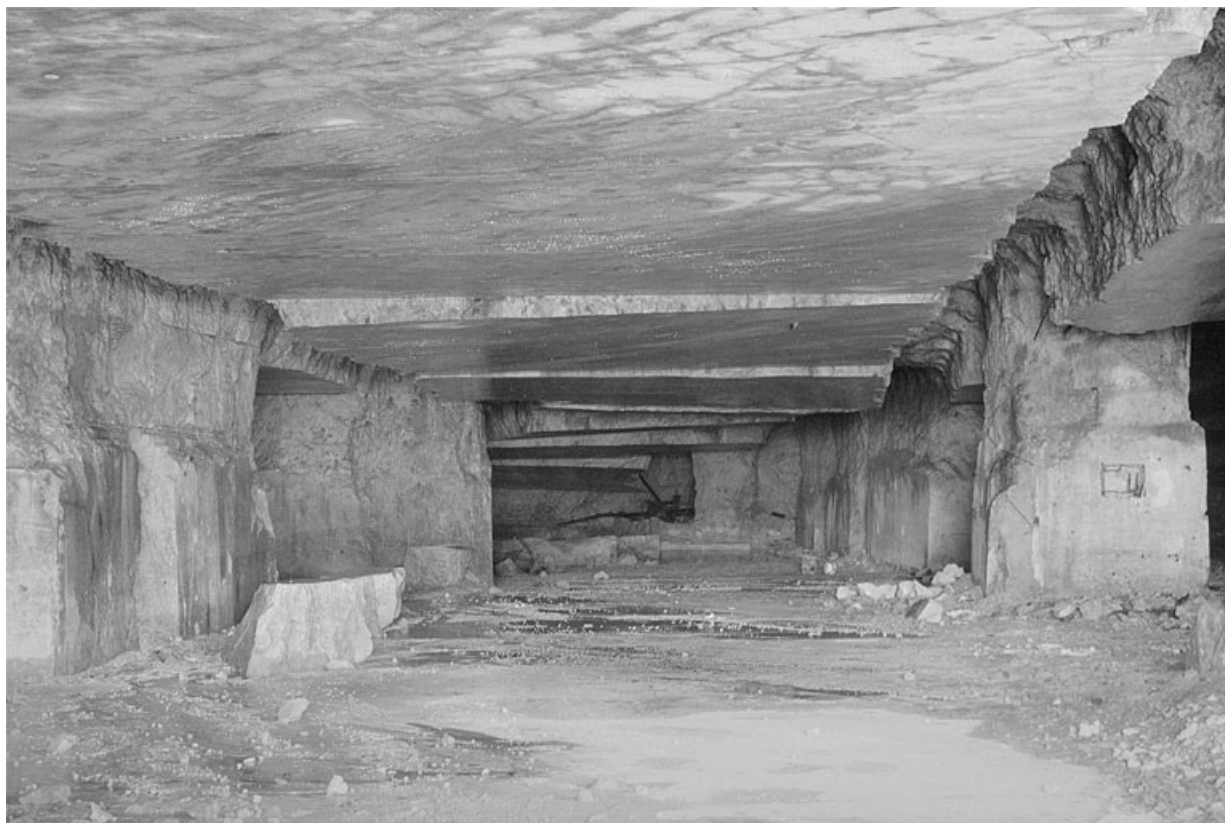
Carrière souterraine de Chassal : intérieur depuis une entrée. 39, Molinges