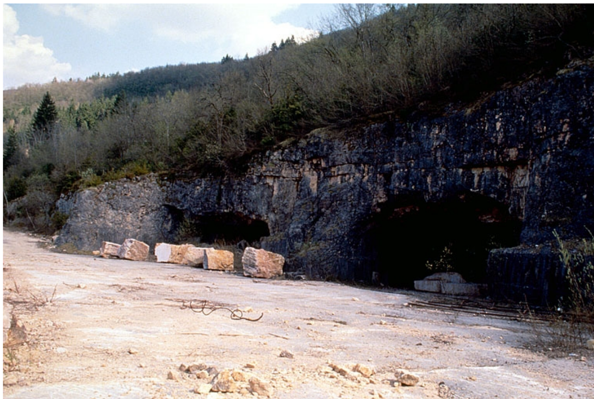
Carrière souterraine de Chassal : entrées. 39, Molinges