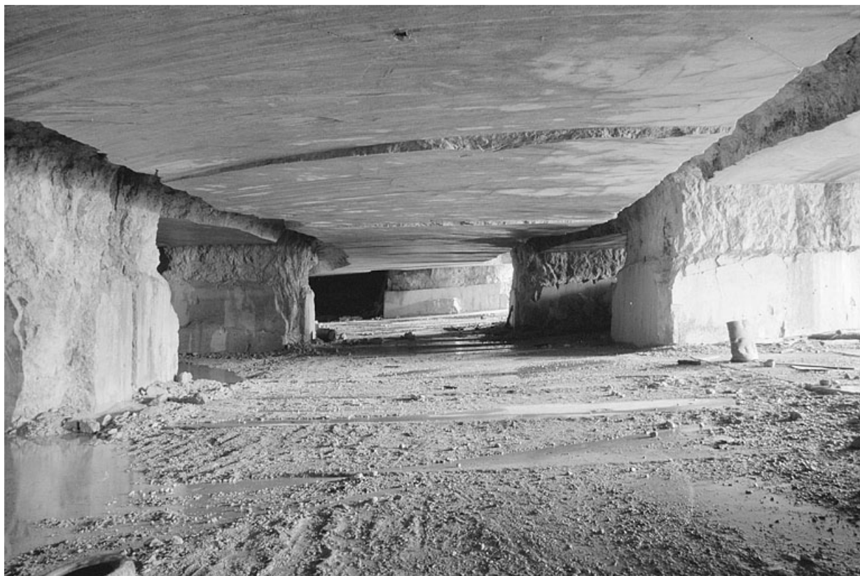
Carrière souterraine de Chassal : galerie latérale. 39, Molinges