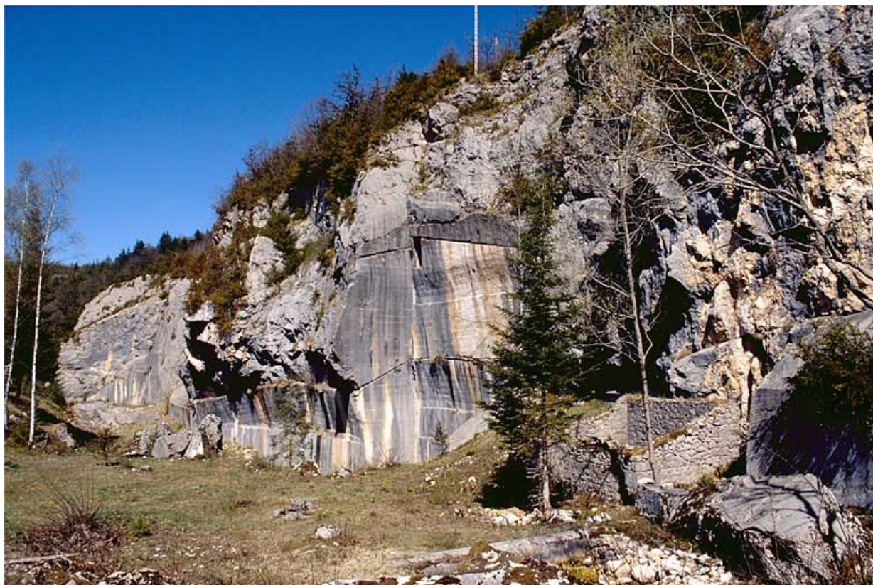
Carrière de Pratz : front de taille. 39, Molinges