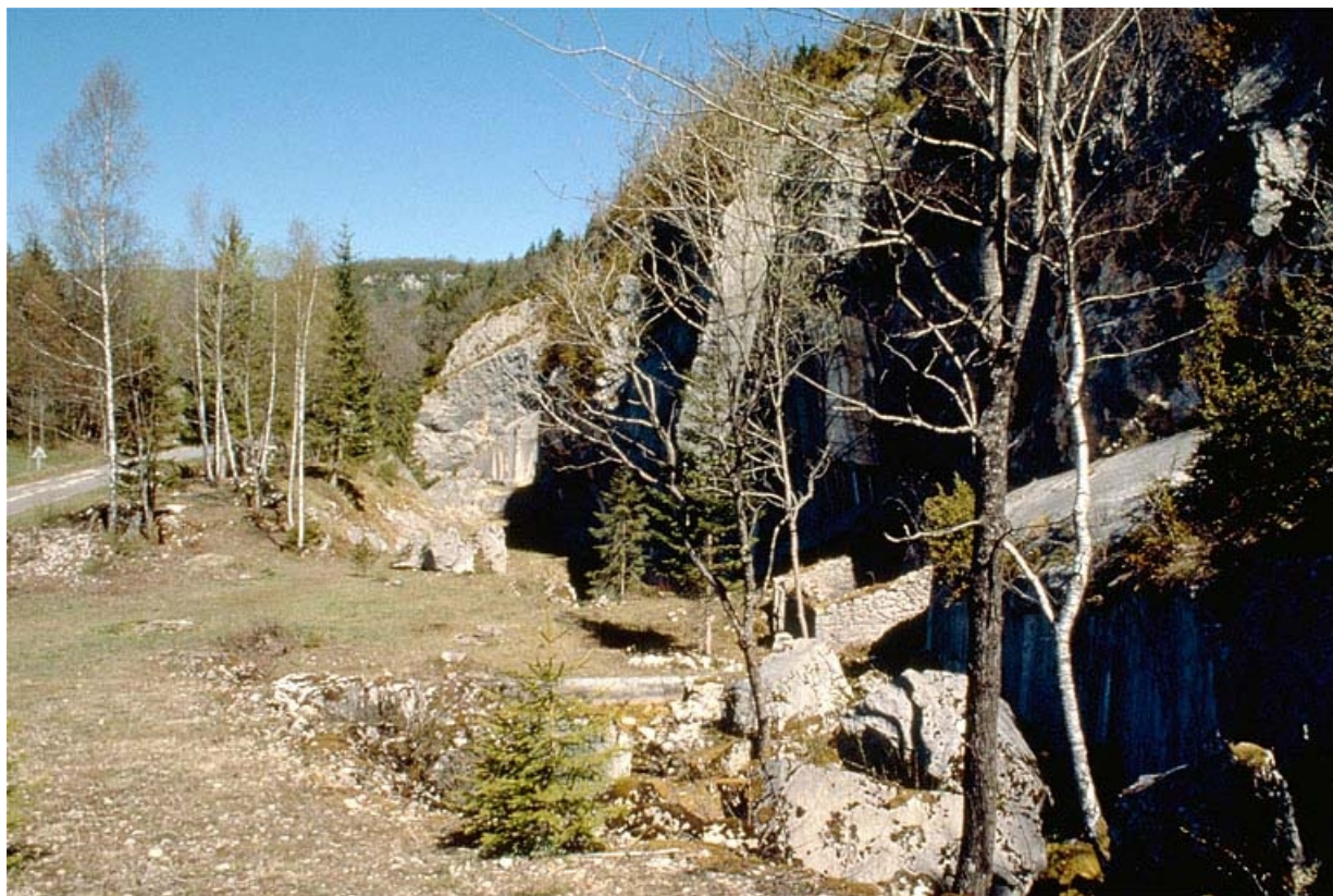
Carrière de Pratz : vue d'ensemble depuis le sud. 39, Molinges