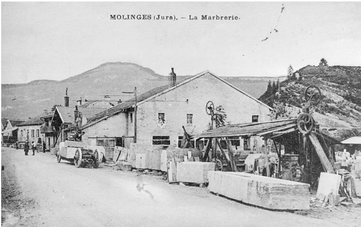
Molinges (Jura). - La Marbrerie [vue de la route]. 39, Molinges