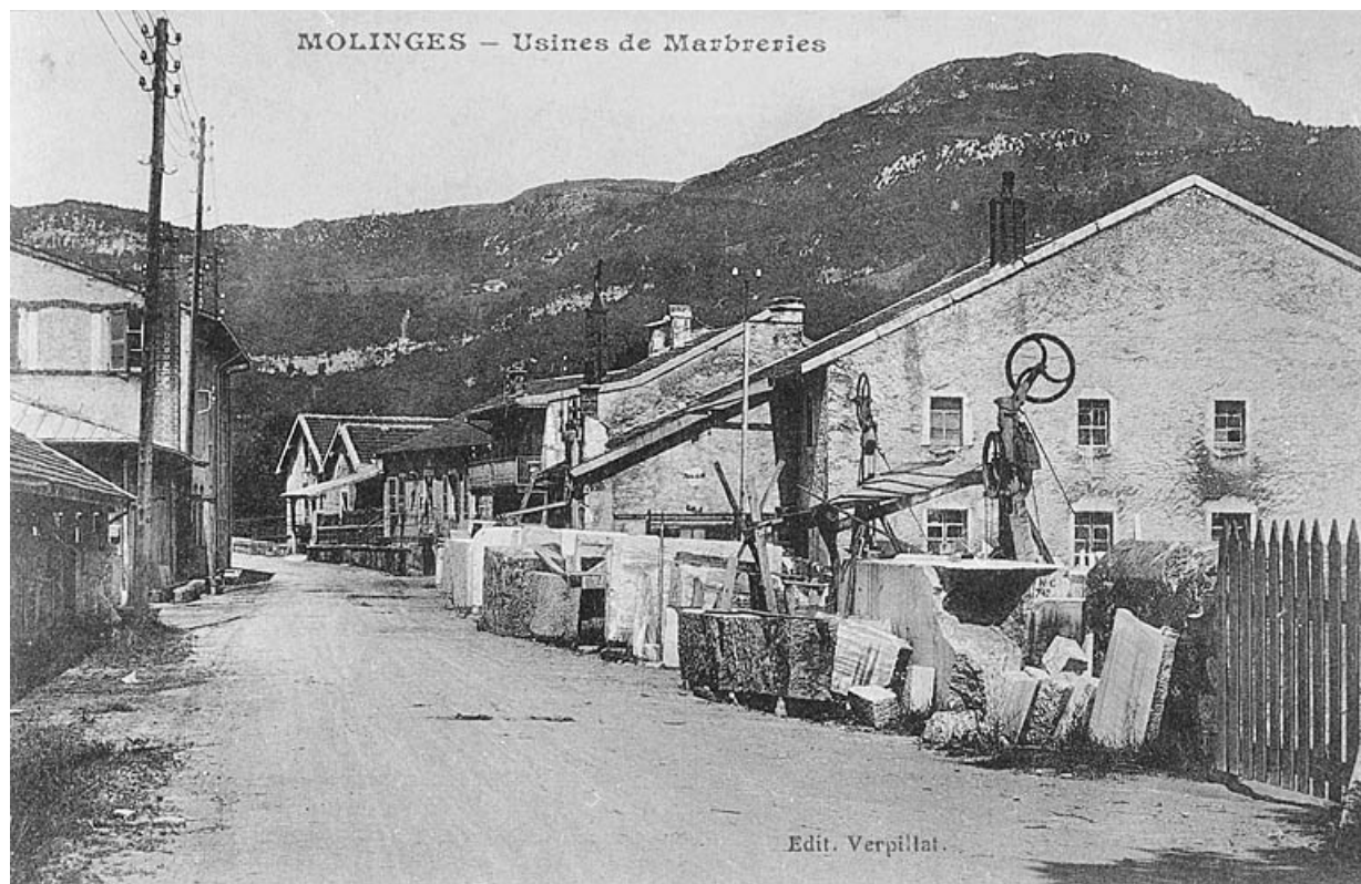
Molinges - Usines de Marbreries.