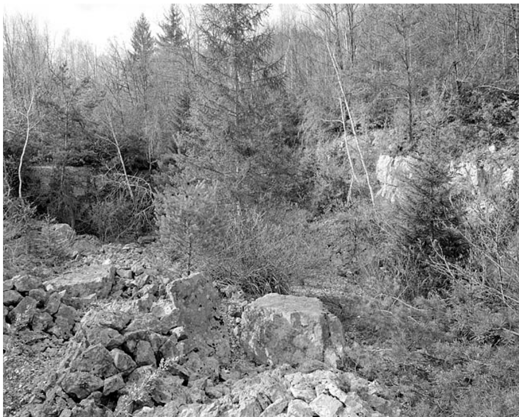
Carrière de Marignat, commune de Chassal : front de taille. 39, Molinges