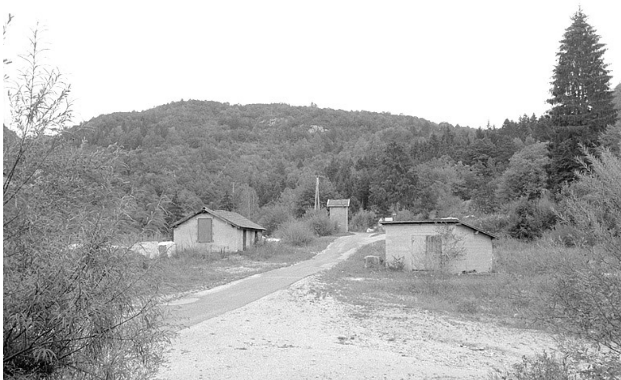
Carrière souterraine de Chassal : bâtiments. La carrière souterraine est à droite. 39, Molinges