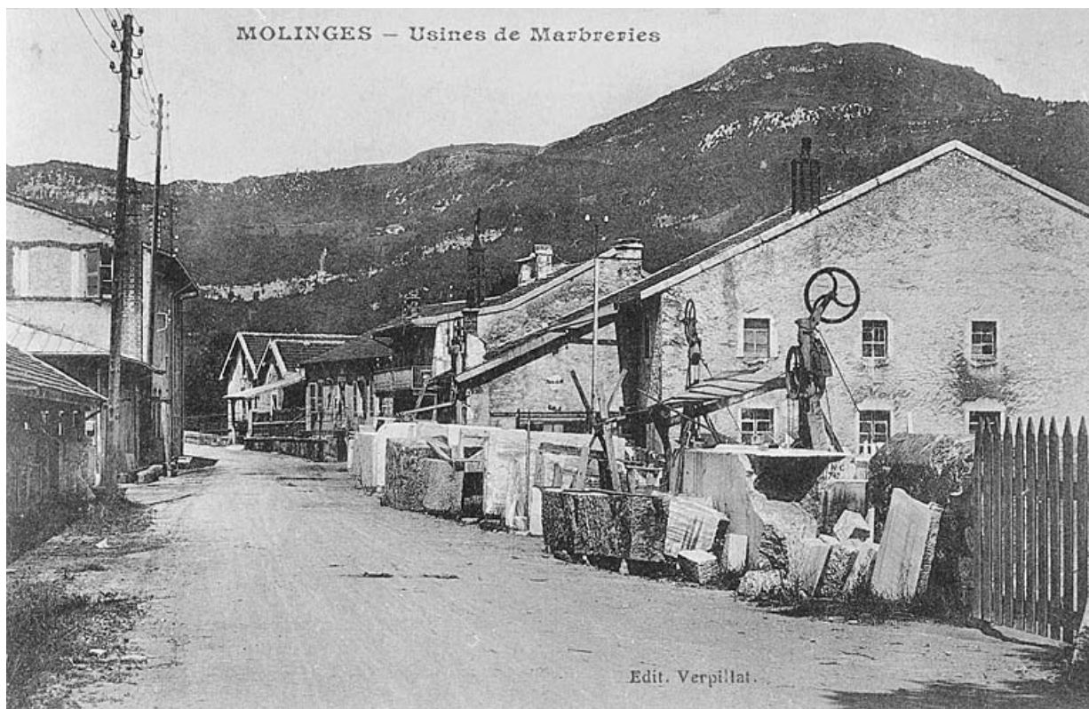
Molinges - Usines de Marbreries.