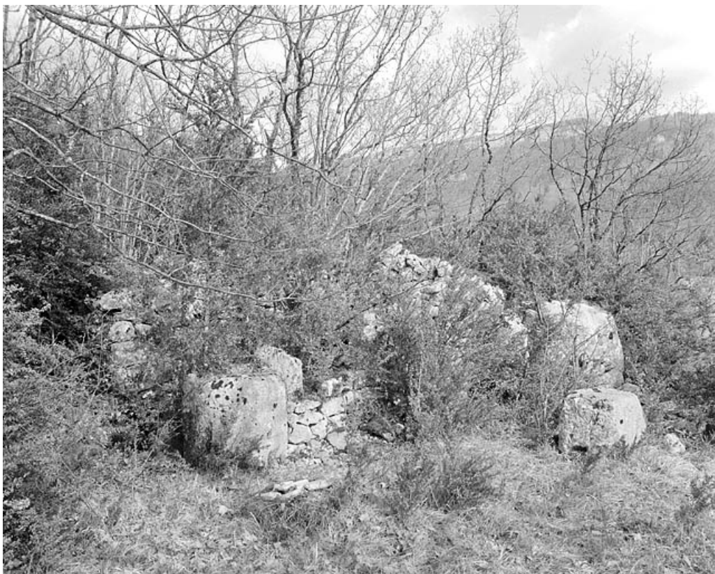
Carrière de Marignat, commune de Chassal : ruines de la forge (et entrepôt d'outils). 39, Molinges