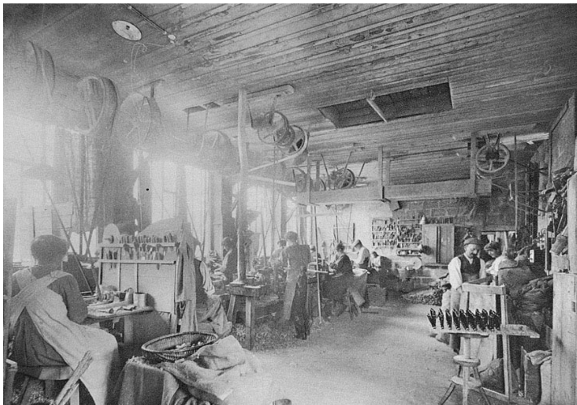
La Tournerie ouvrière, Société coopérative à Lavans-les-St-Claude Tournage des objets, début des années 1920. 39, Lavans-lès-Saint-Claude, 8 rue de la Cueille