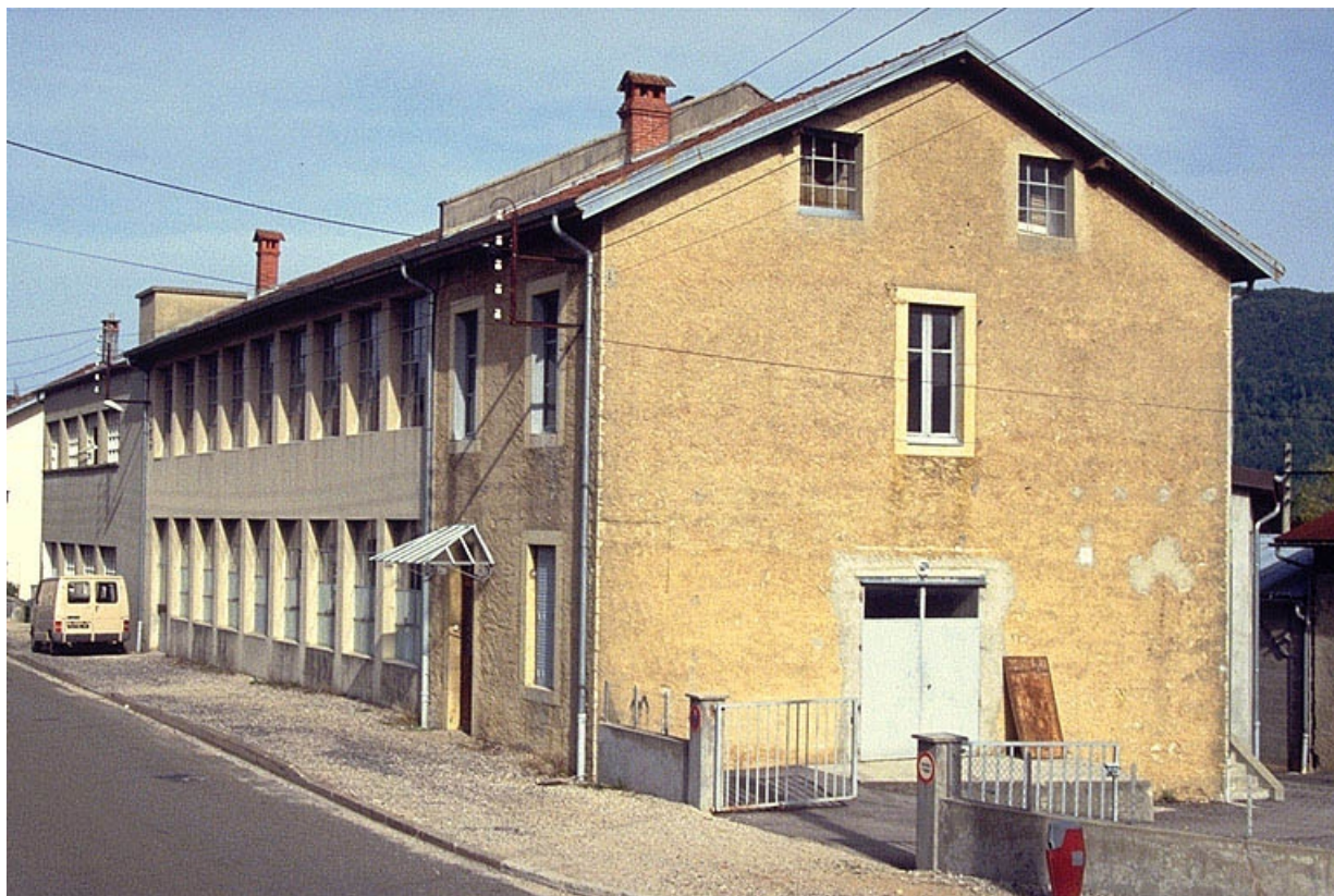
Façade antérieure, vue de trois quarts droit.