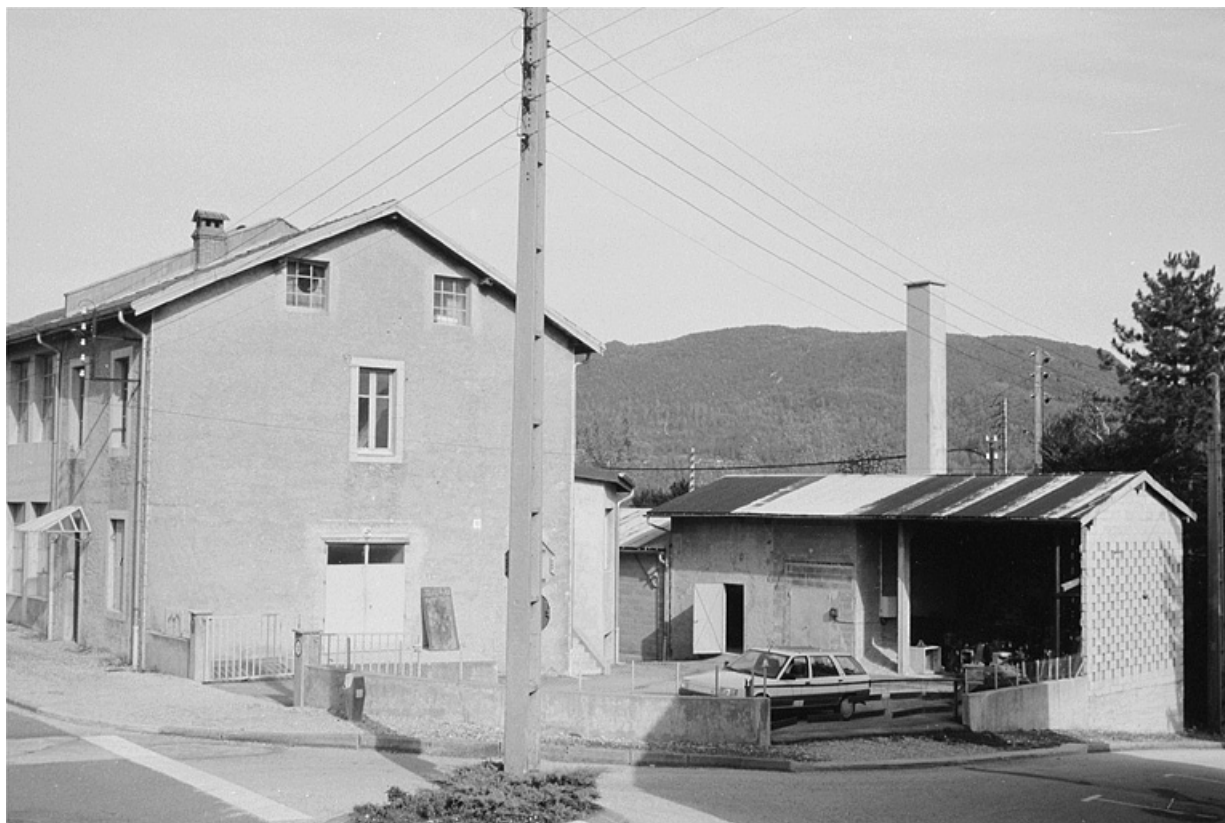
Façade latérale droite et chaufferie.

39, Lavans-lès-Saint-Claude, 8 rue de la Cueilie