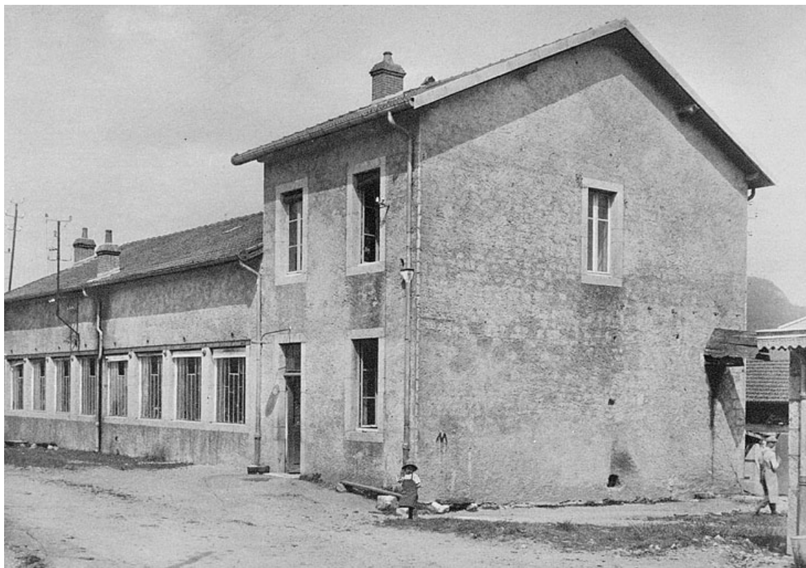
La Tournerie ouvrière, Société coopérative de production à Lavans-les-St-Claude, début des années 1920. 39, Lavans-lès-Saint-Claude, 8 rue de la Cueille