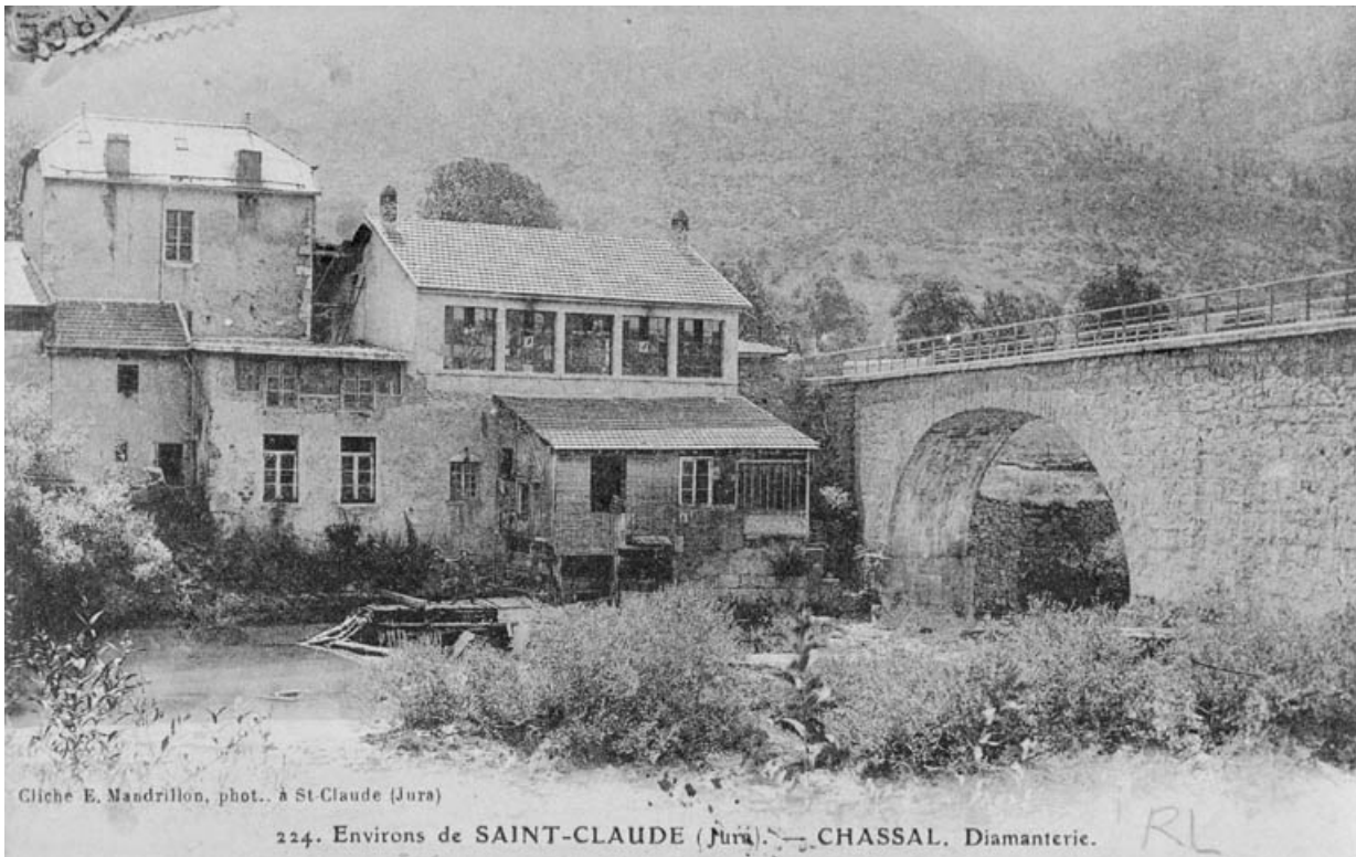
Environs de Saint-Claude (Jura). - Chassal. Diamanterie. 39, Chassal

Carte postale, s.d. [limite 19e siècle 20e siècle, avant 1910], par Mandrillon, E. (photographe). Lieu de conservation : collection particulière : Guérin, Molinges