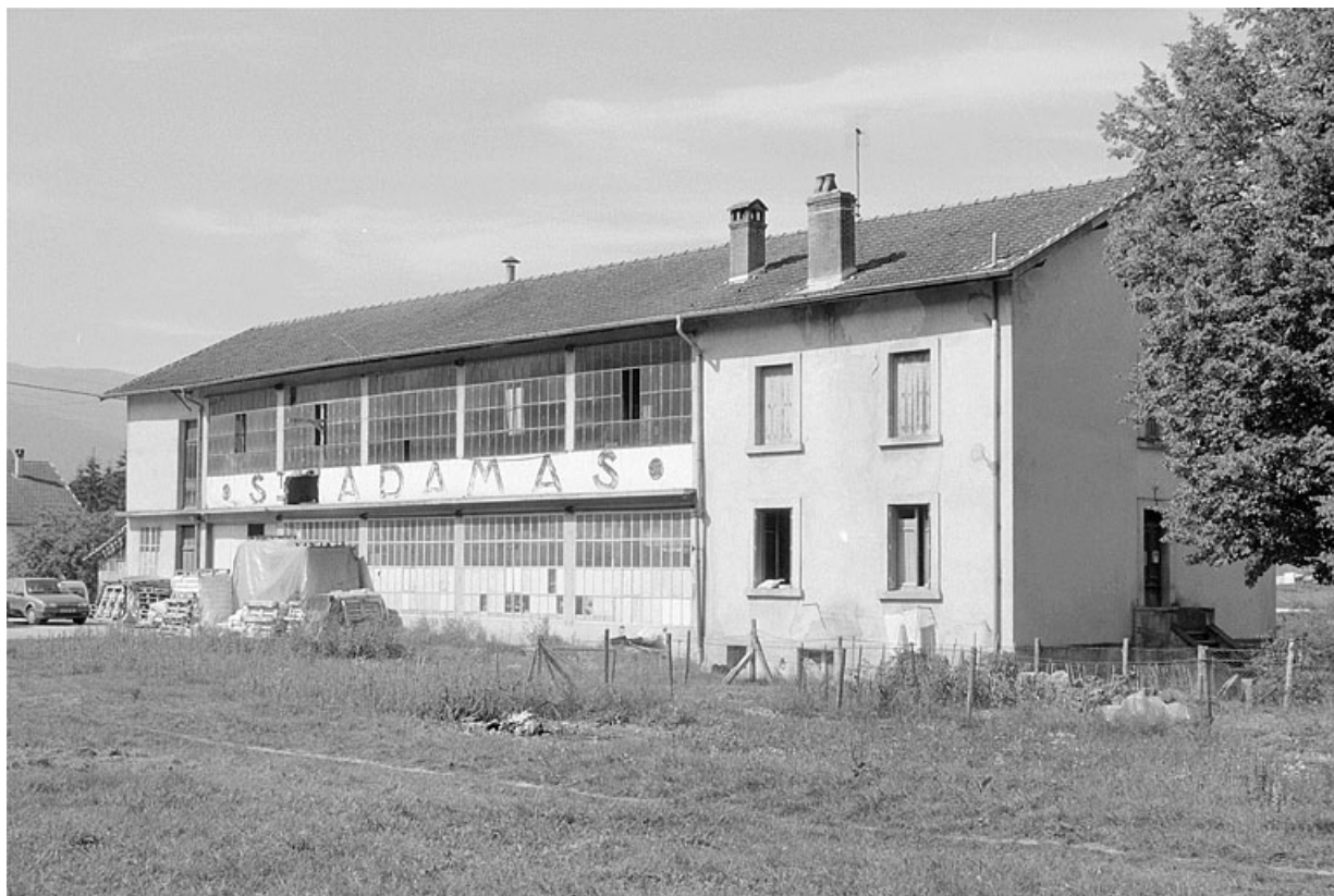
Façade postérieure, de trois quarts droit. 39, Chassal