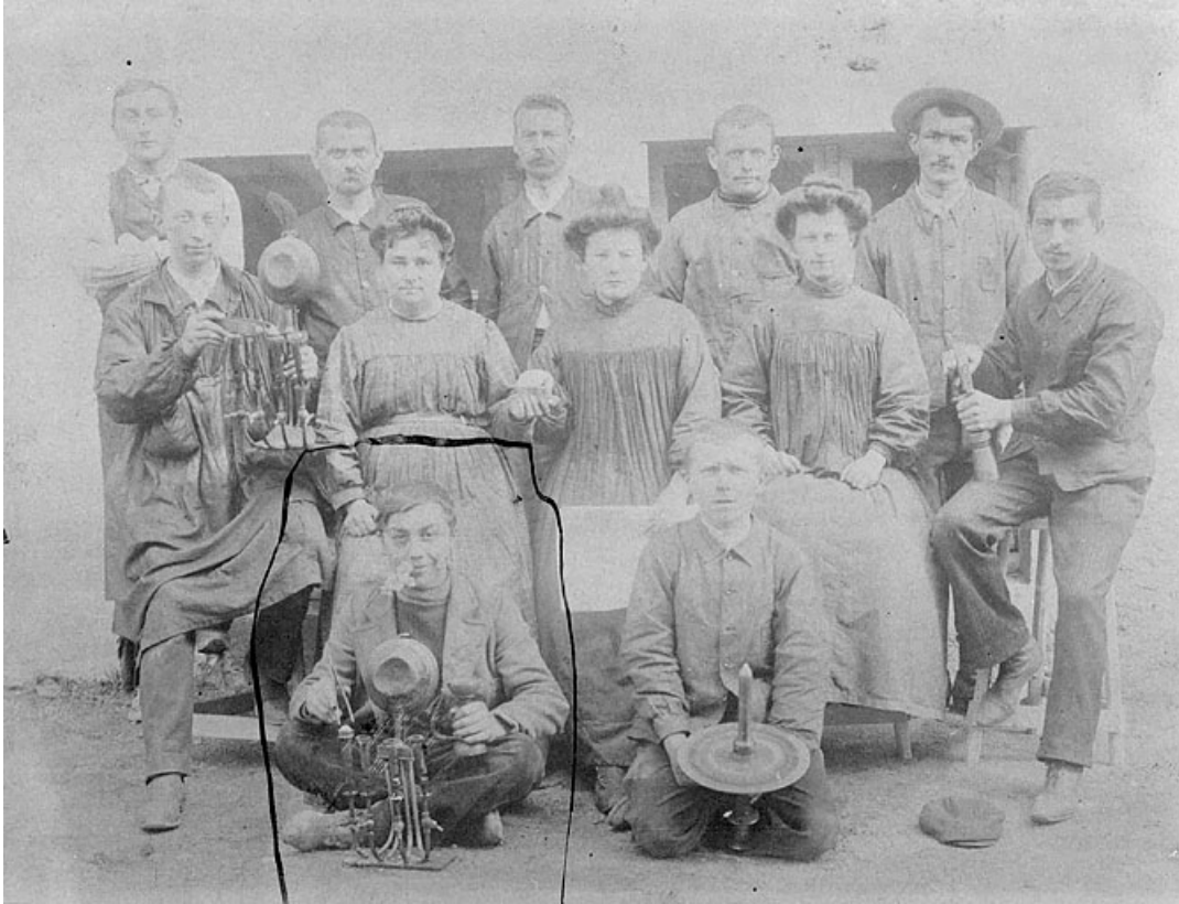
Diamantaires devant l'usine.