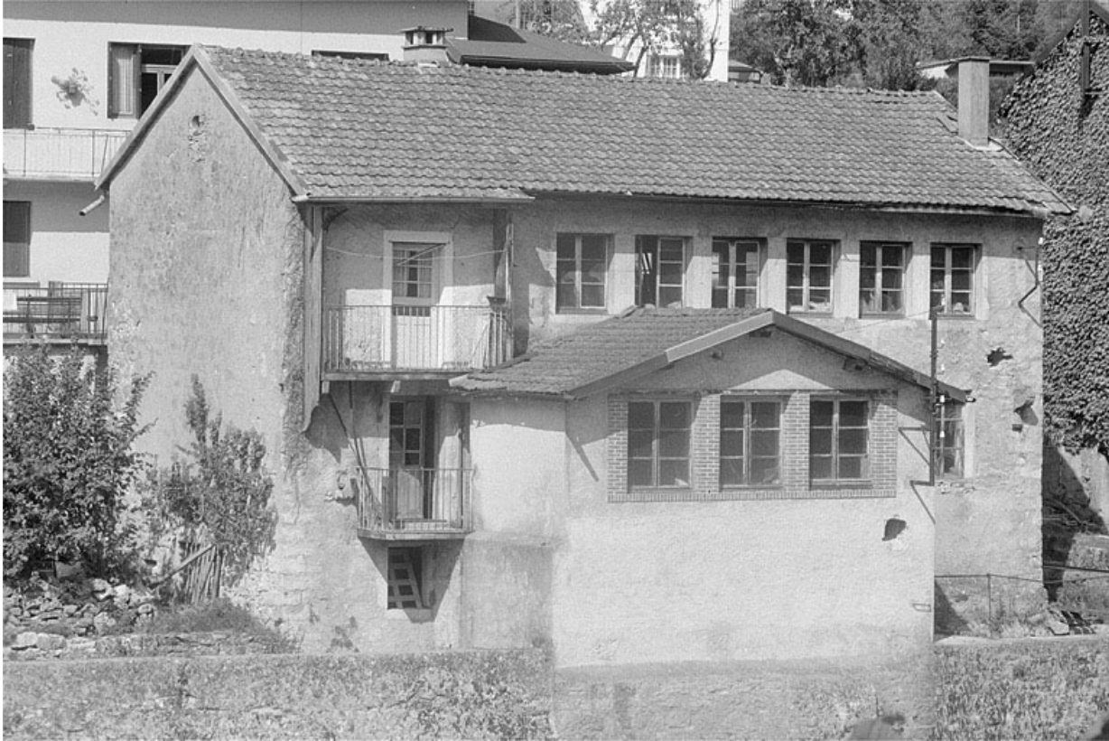
Atelier de fabrication et salle des machines.