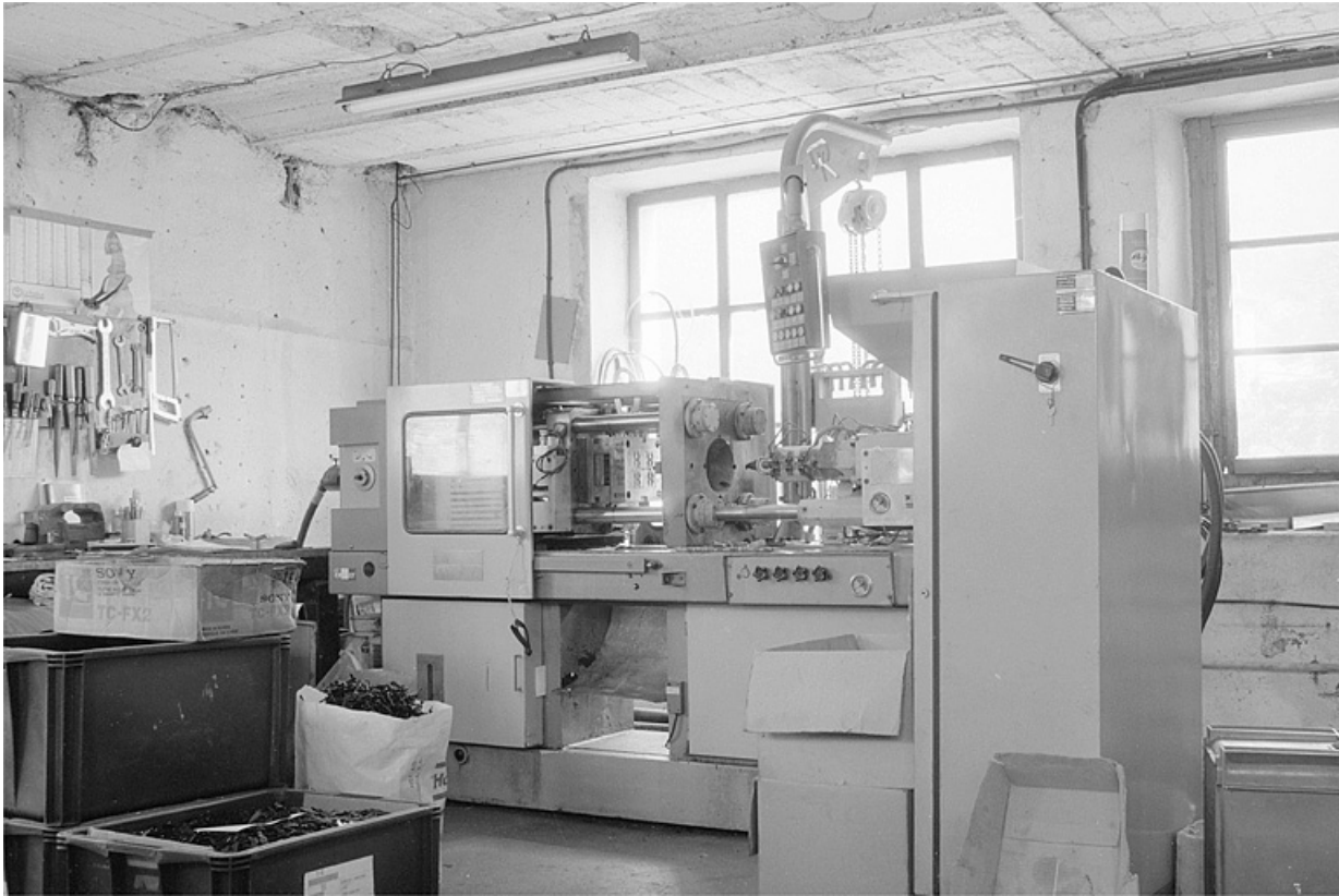
Presse à injecter DK.