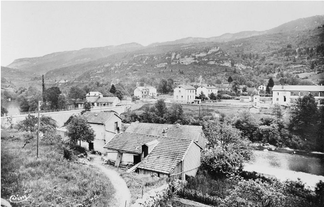
Chassal (Jura). Vue générale.