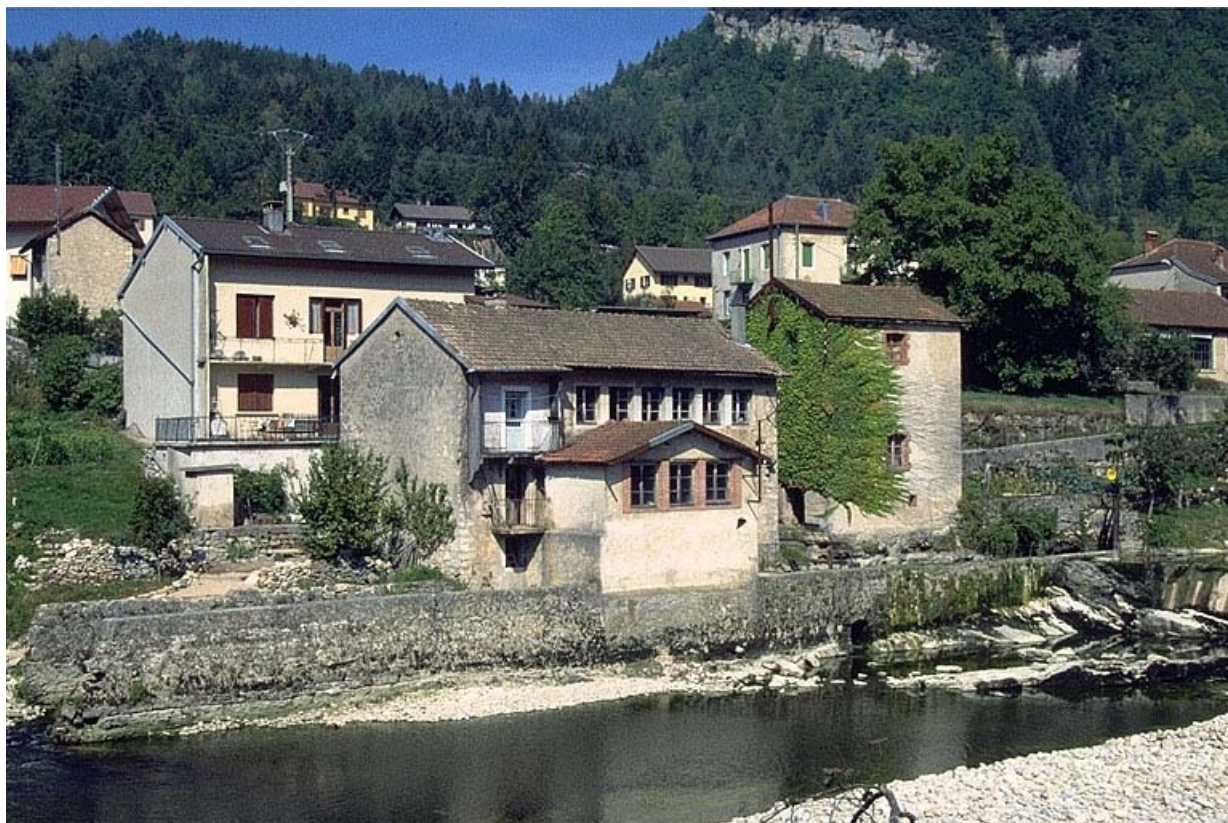
Vue d'ensemble depuis le sud.