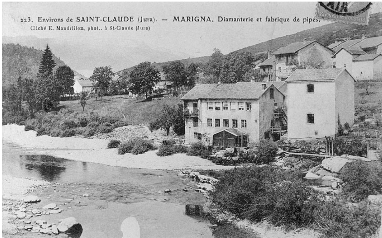
Environs de Saint-Claude (Jura). - Marigna. Diamanterie et fabrique de pipes. 39, Chassal, lieudit : Marnat

Carte postale, s.d. [4e quart 19e siècle], par Mandrillon, E. (photographe). Lieu de conservation : collection particulière : Guérin, Molinges