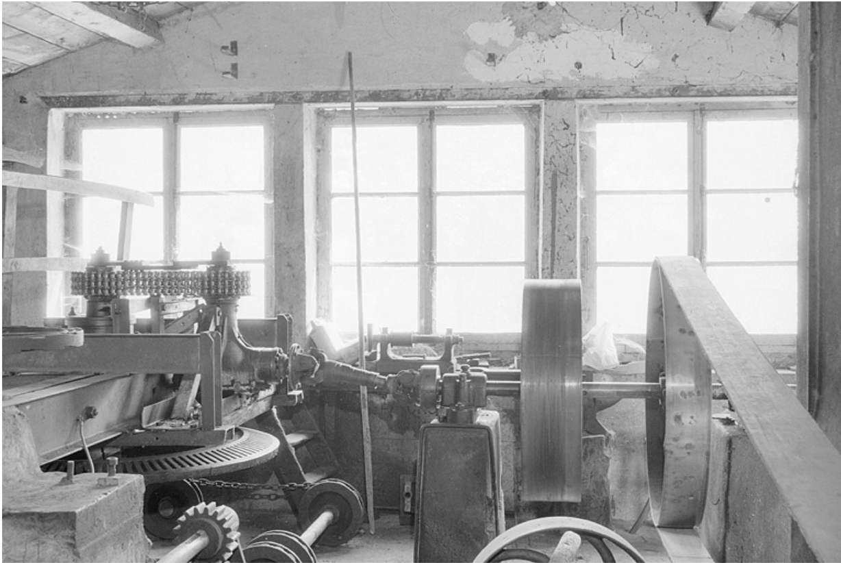
Transmission entre la turbine et la dynamo.