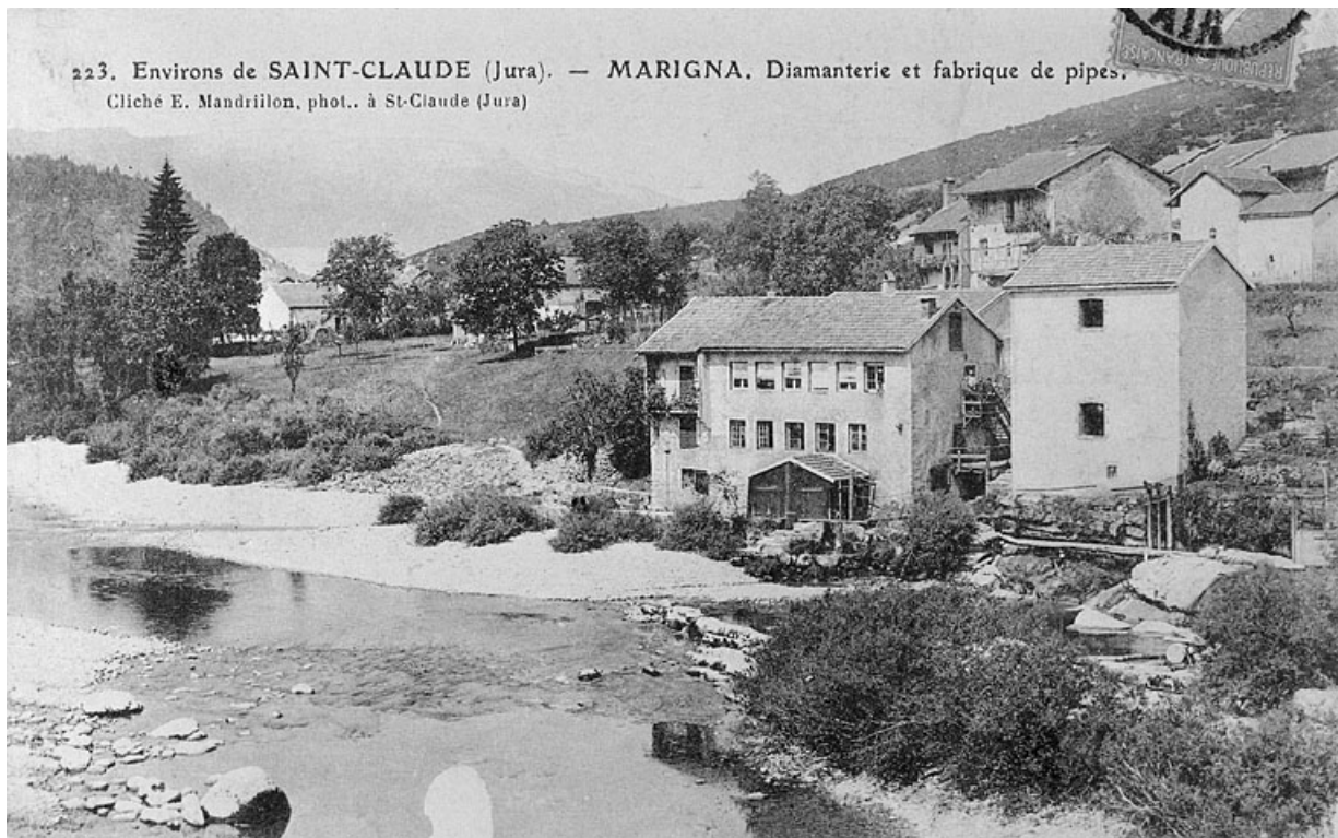
Environs de Saint-Claude (Jura). - Marigna. Diamanterie et fabrique de pipes. 39, Chassal, lieudit : Marignat