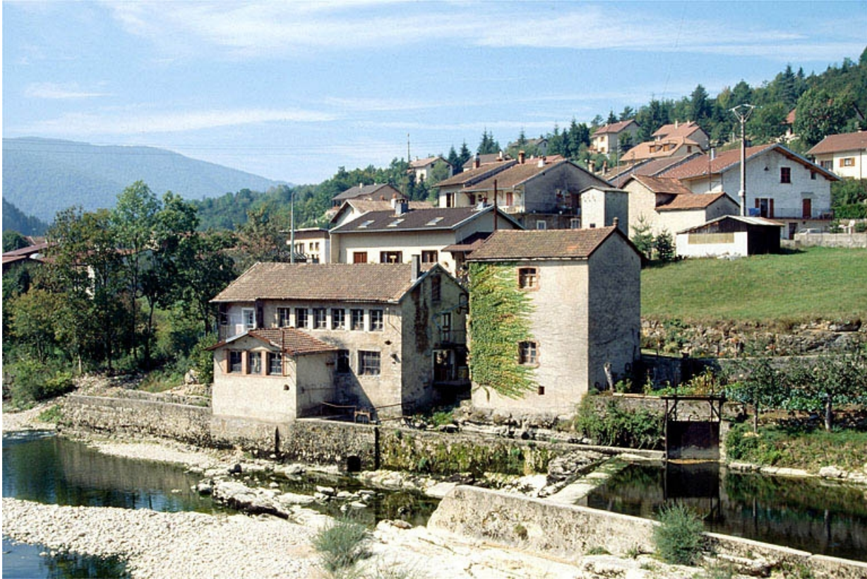
Vue d'ensemble depuis l'est.