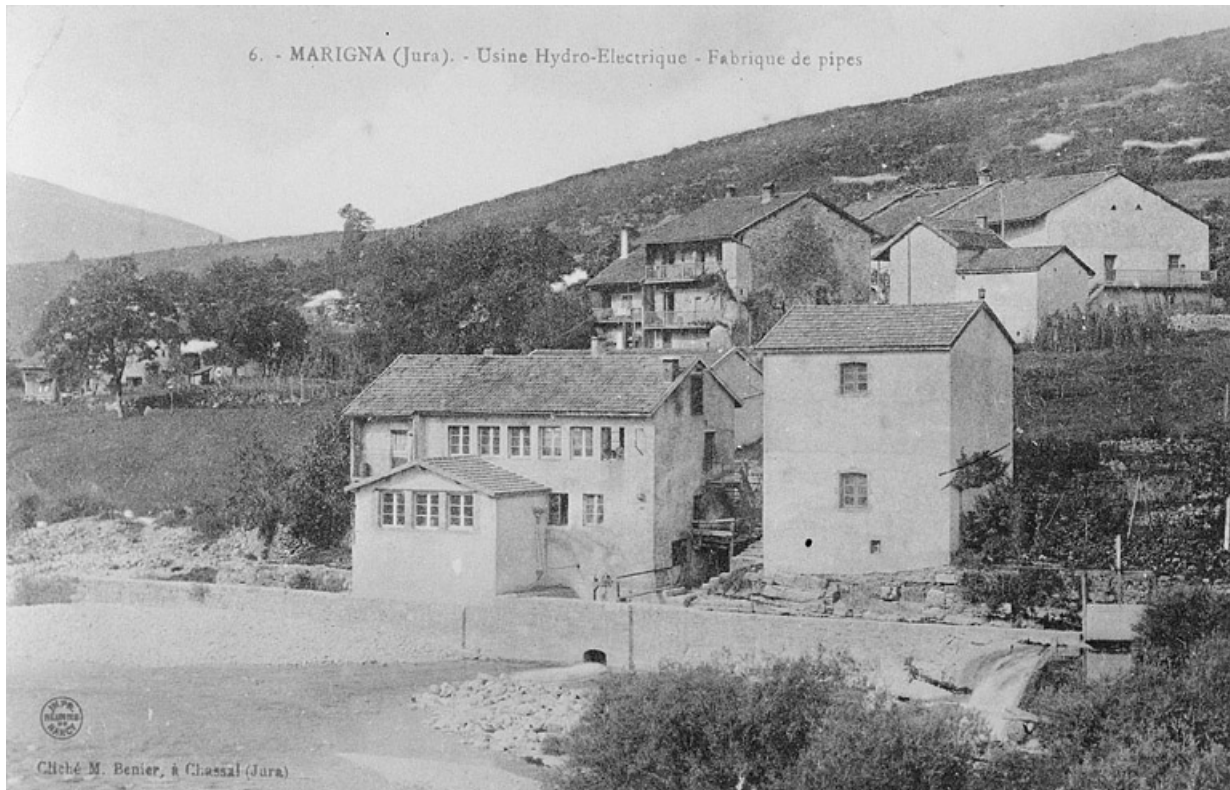
Marigna (Jura). - Usine Hydro-Electrique - Fabrique de pipes.