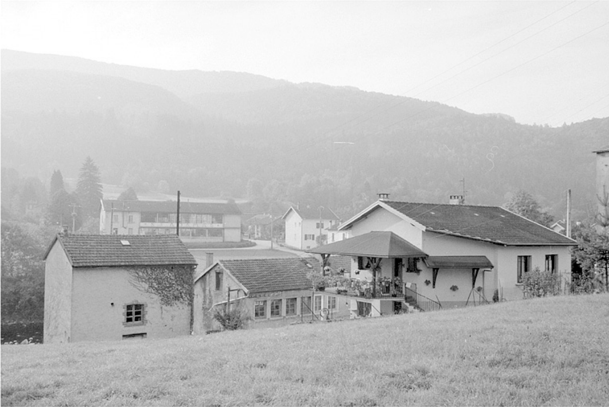
Vue d'ensemble depuis le nord.