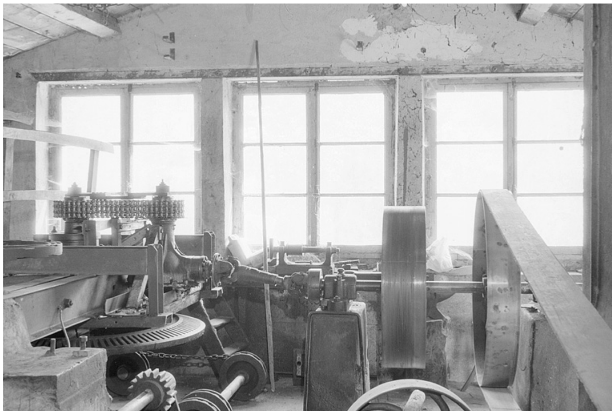
Transmission entre la turbine et la dynamo.