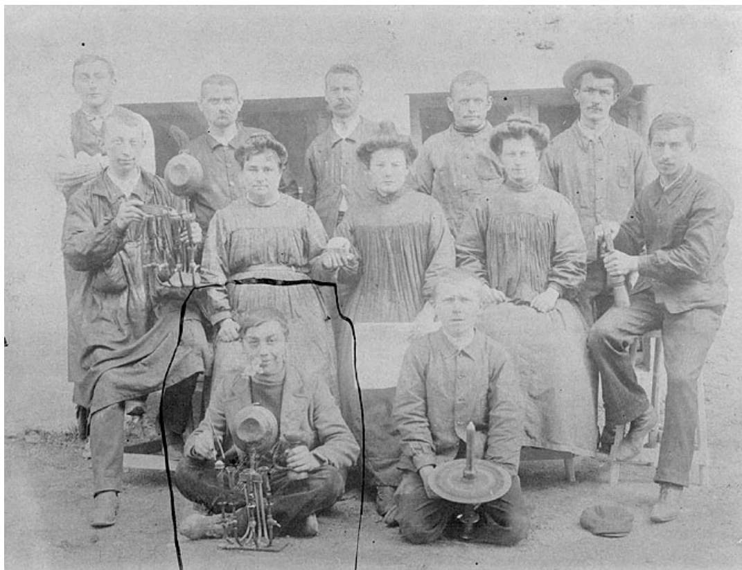
Diamantaires devant l'usine.