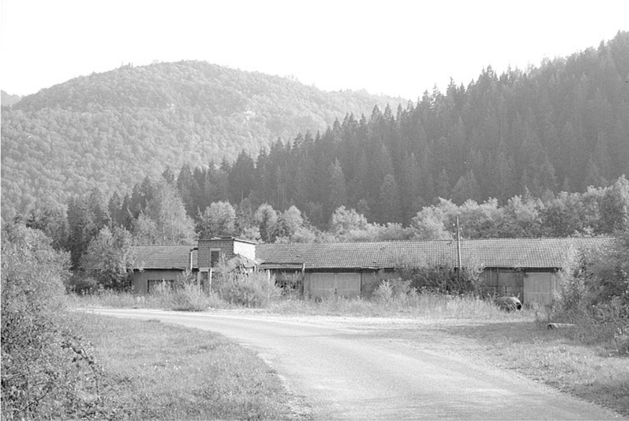
Façade côté route.