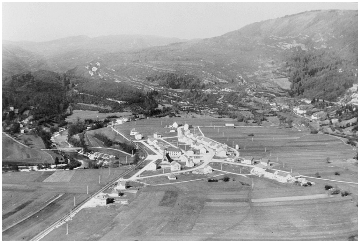
Vue aérienne de Lavancia-Epercy lors de la construction du nouveau village.