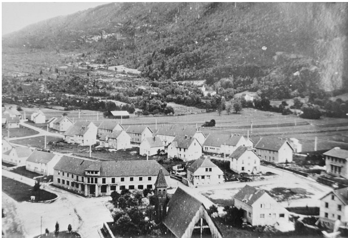
Vue aérienne du nouveau village de Lavancia-Epercy lors de sa reconstruction.