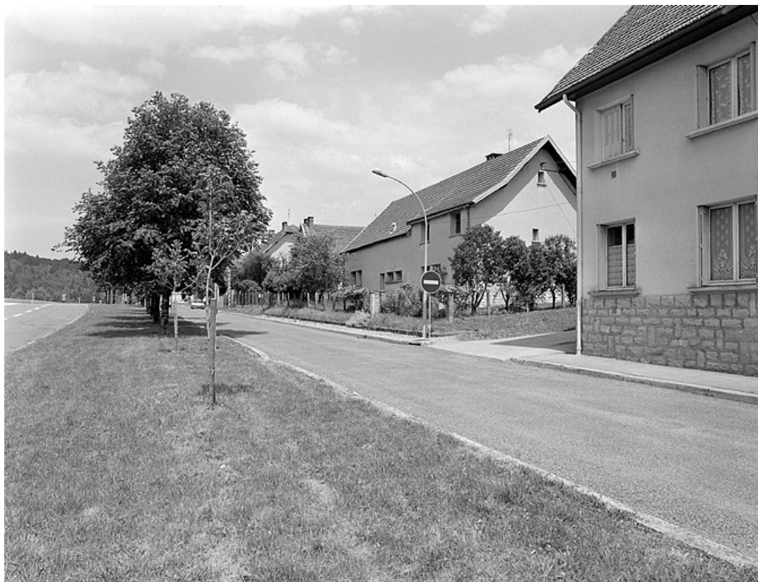
Vue de la rue d'Epercy.