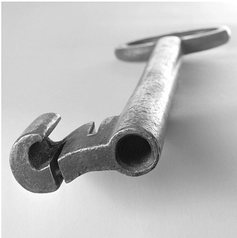
Détail d'une clé de grenier fort à Lajoux.