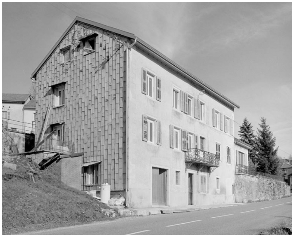
Façade antérieure et face sud-ouest. 39, Septmoncel Genève