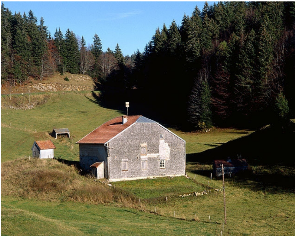
Vue générale depuis le sud-ouest.