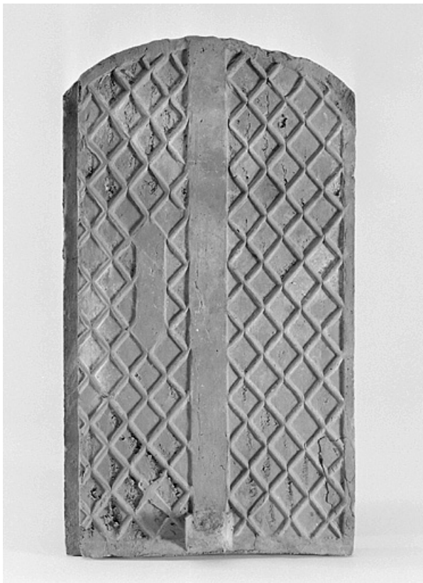
Face intérieure d'une tuile-écaille.