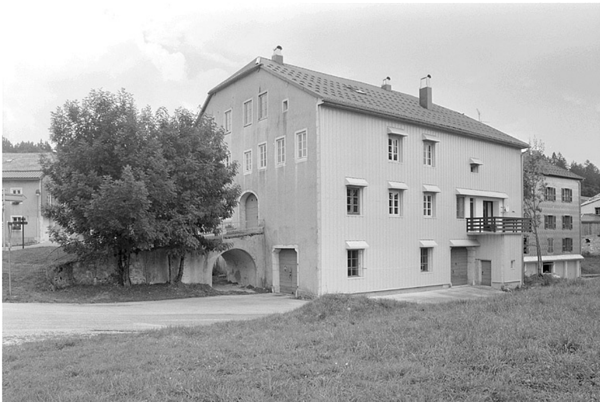
Façade postérieure et face nord-ouest.