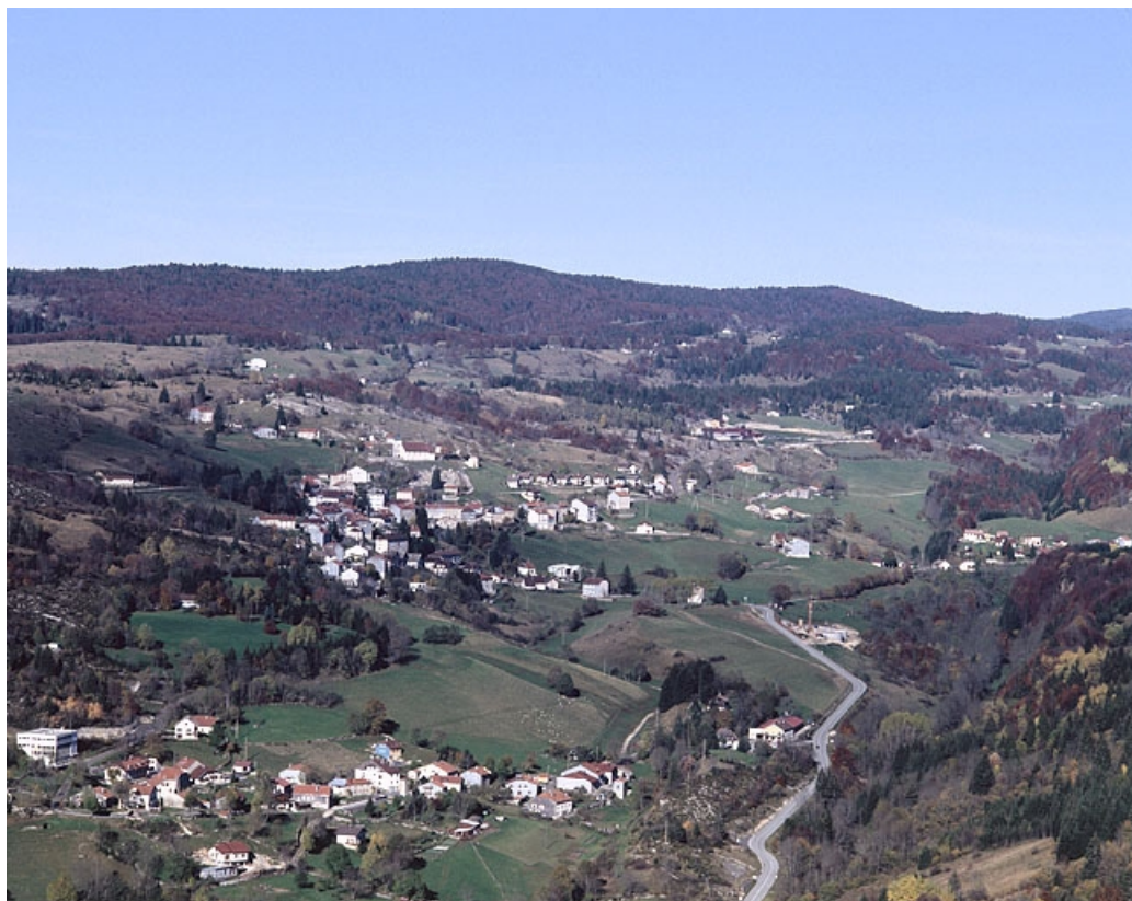
Le village de Septmoncel et ses hameaux sur l'Etain.