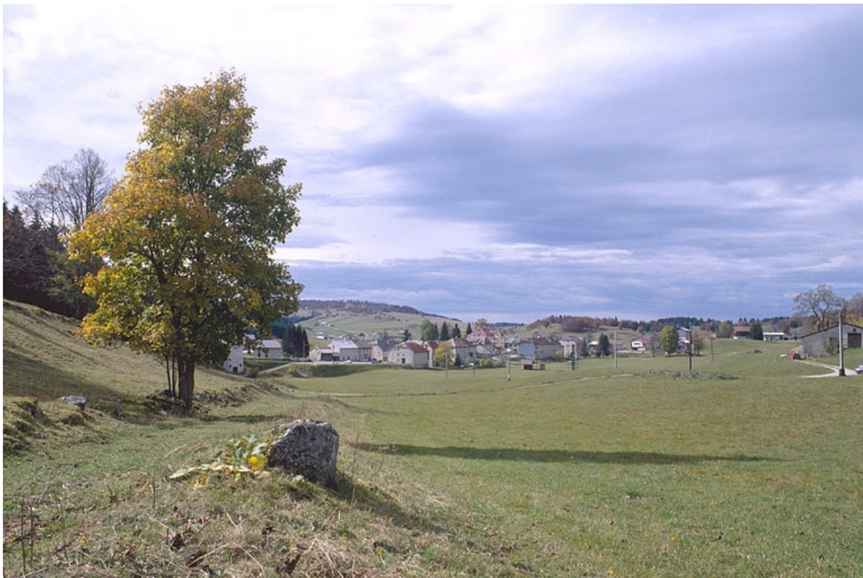
Vue générale du village.