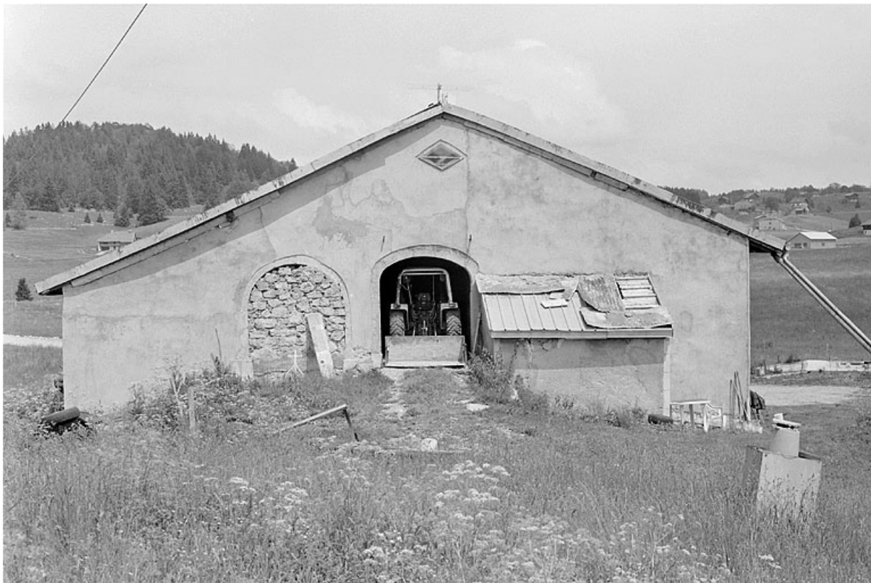
Ferme rehaussée et agrandie au hameau de Petite Joux.