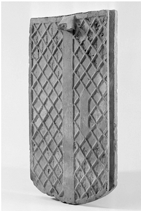
Face intérieure et feuillure d'une tuile-écaille.