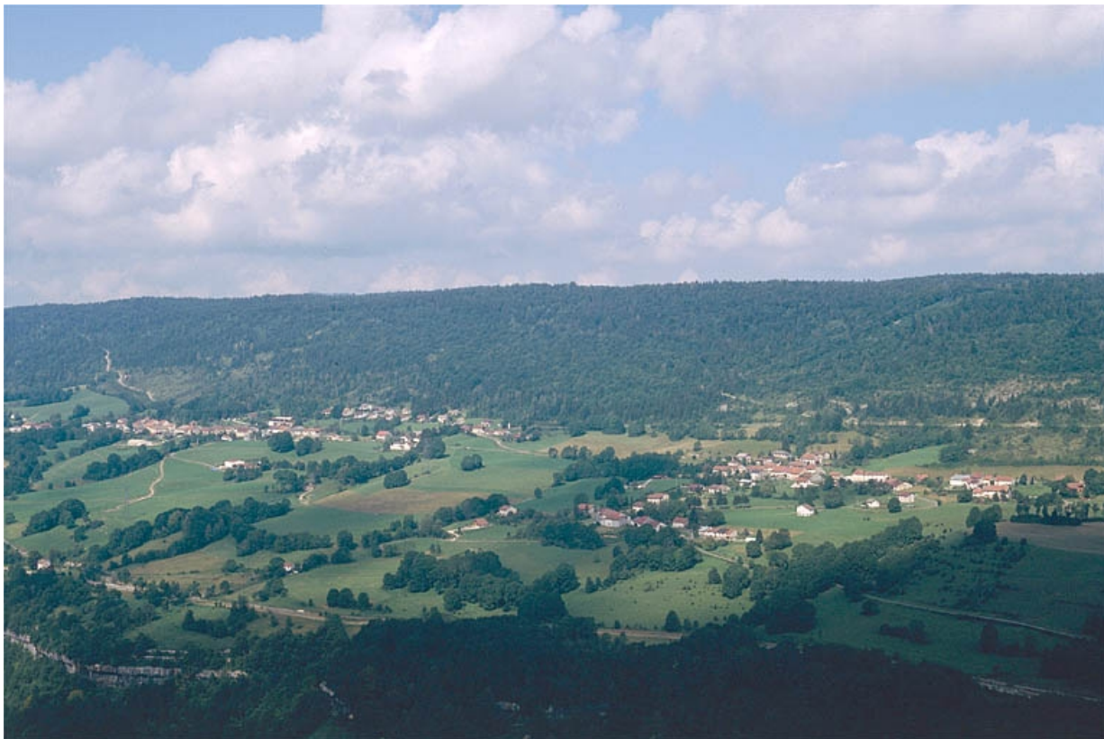
Vue éloignée des villages de la Rixouse et Villard-sur-Bienne.