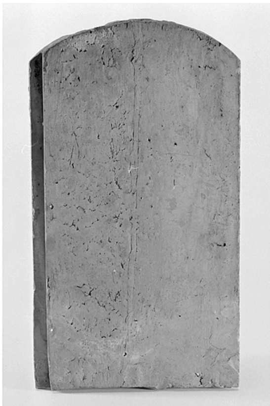
Vue de la face extérieure d'une tuile-écaille.