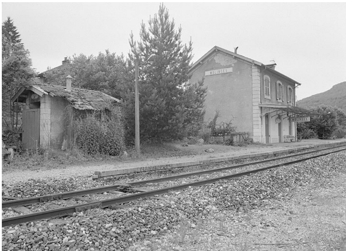
Vue d'ensemble depuis la voie, côté Andelot-en-Montagne (est).