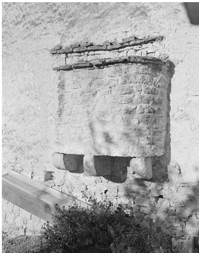
Four accolé en pignon, porté par des consoles en pierres. 39, La Rixouse