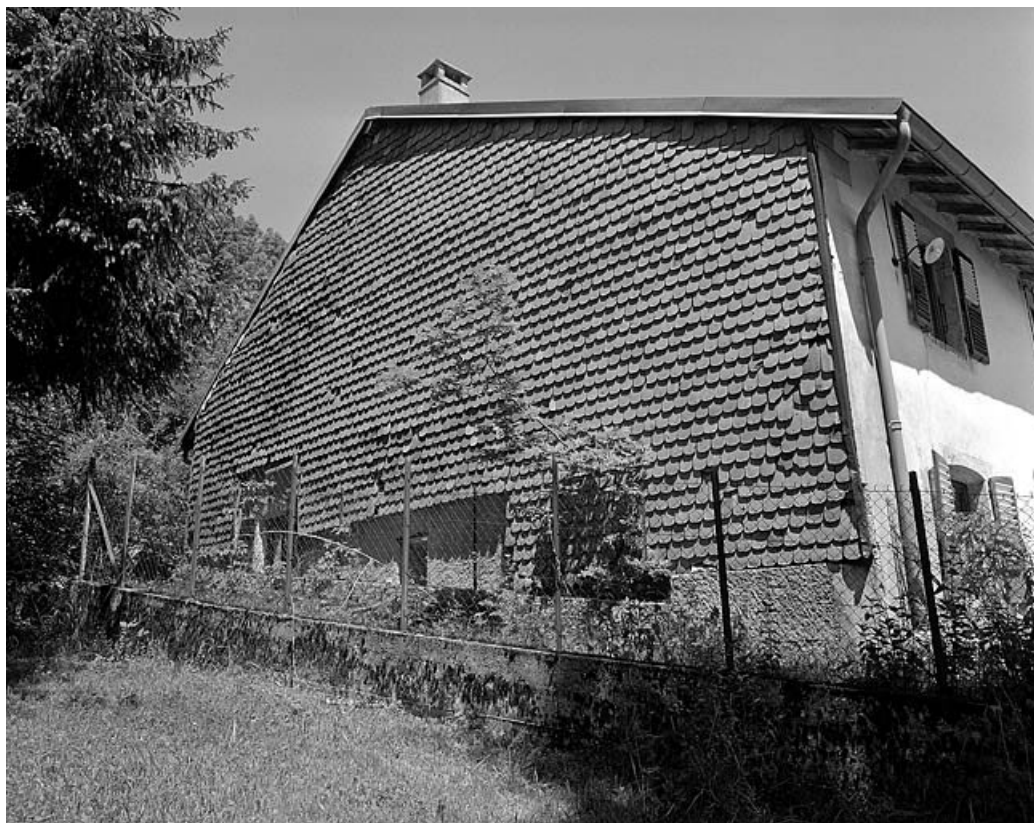
Essentage de tuiles sur un pignon sud-ouest.