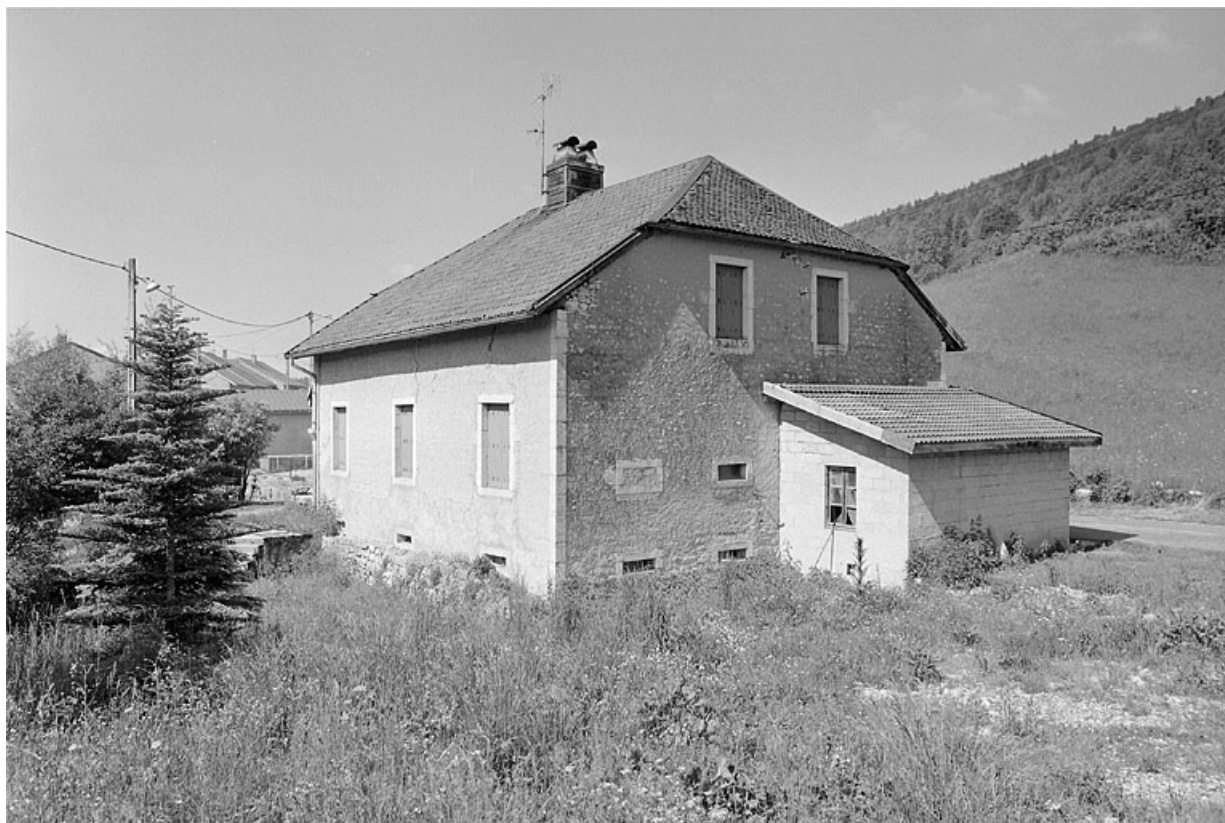
Vue de trois quarts de la façade postérieure et de la face droite.