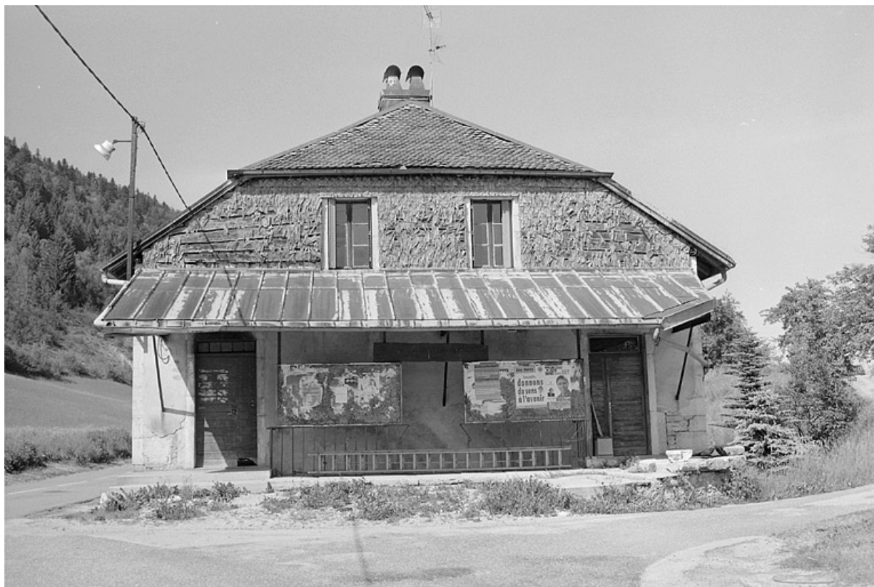
Vue de la façade antérieure. 39, Villard-sur-Bienne Vallée