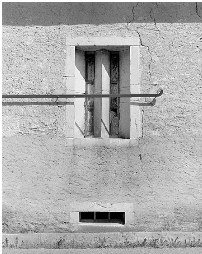
Détail des ouvertures d'une des laiteries.