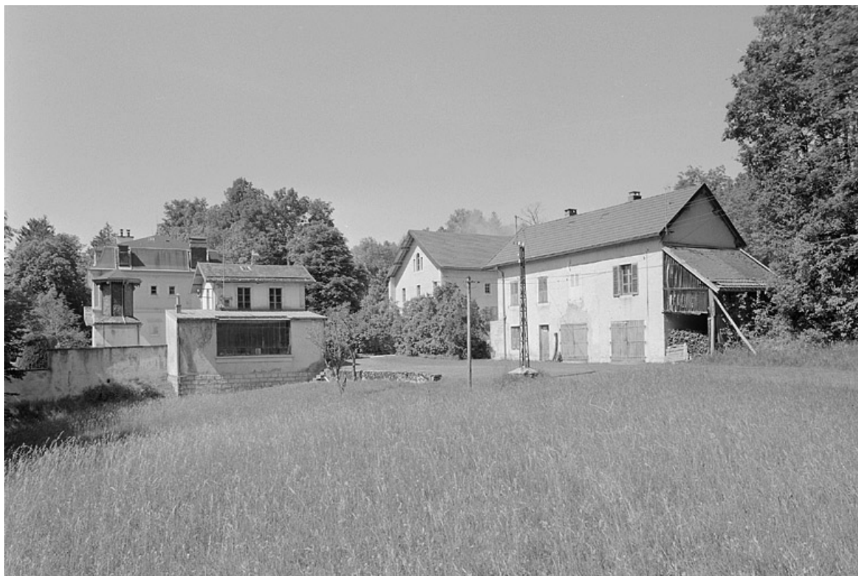
Vue éloignée de la demeure, de la façade postérieure de l'atelier et du logement des jardiniers.

39, Avignon-lès-Saint-Claude, lieudit : sous la Goutte