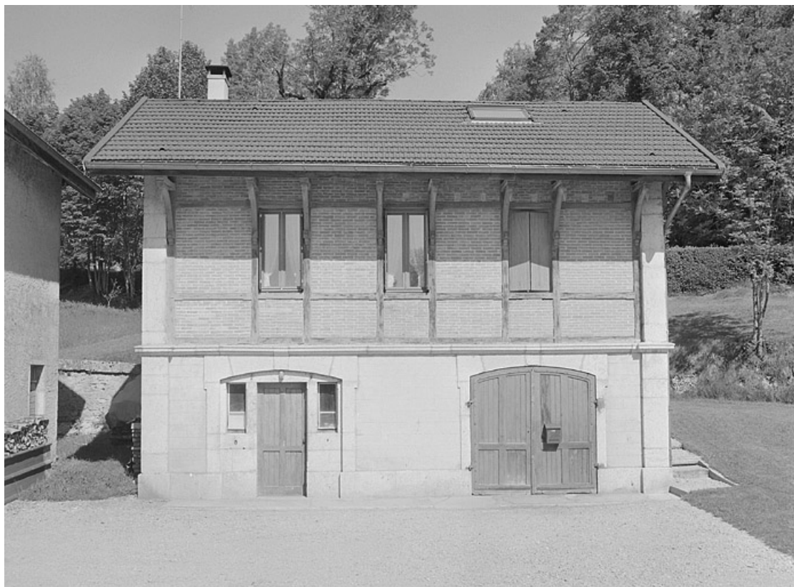
Façade antérieure de la remise à automobile et de son logement.

39, Avignon-lès-Saint-Claude, lieudit : sous la Goutte