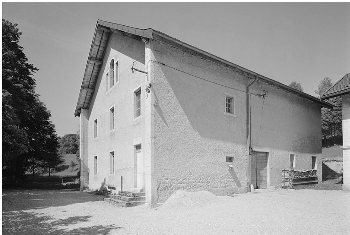
Façade antérieure et face droite de la ferme.

39, Avignon-lès-Saint-Claude, lieudit : sous la Goutte