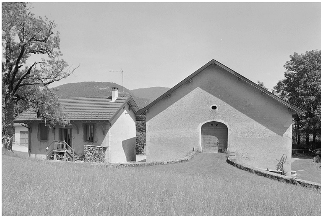
Façade postérieure de la ferme et de la remise à automobile.

39, Avignon-lès-Saint-Claude, lieudit : sous la Goutte