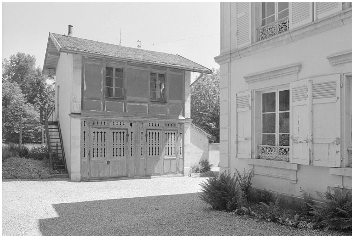
Façade antérieure de l'atelier à proximité de la demeure.

39, Avignon-lès-Saint-Claude, lieudit : sous la Goutte