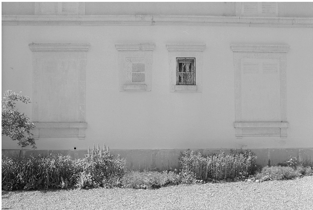
Fenêtres peintes en trompe-l'oeil sur la face gauche de la demeure.

39, Avignon-lès-Saint-Claude, lieudit : sous la Goutte