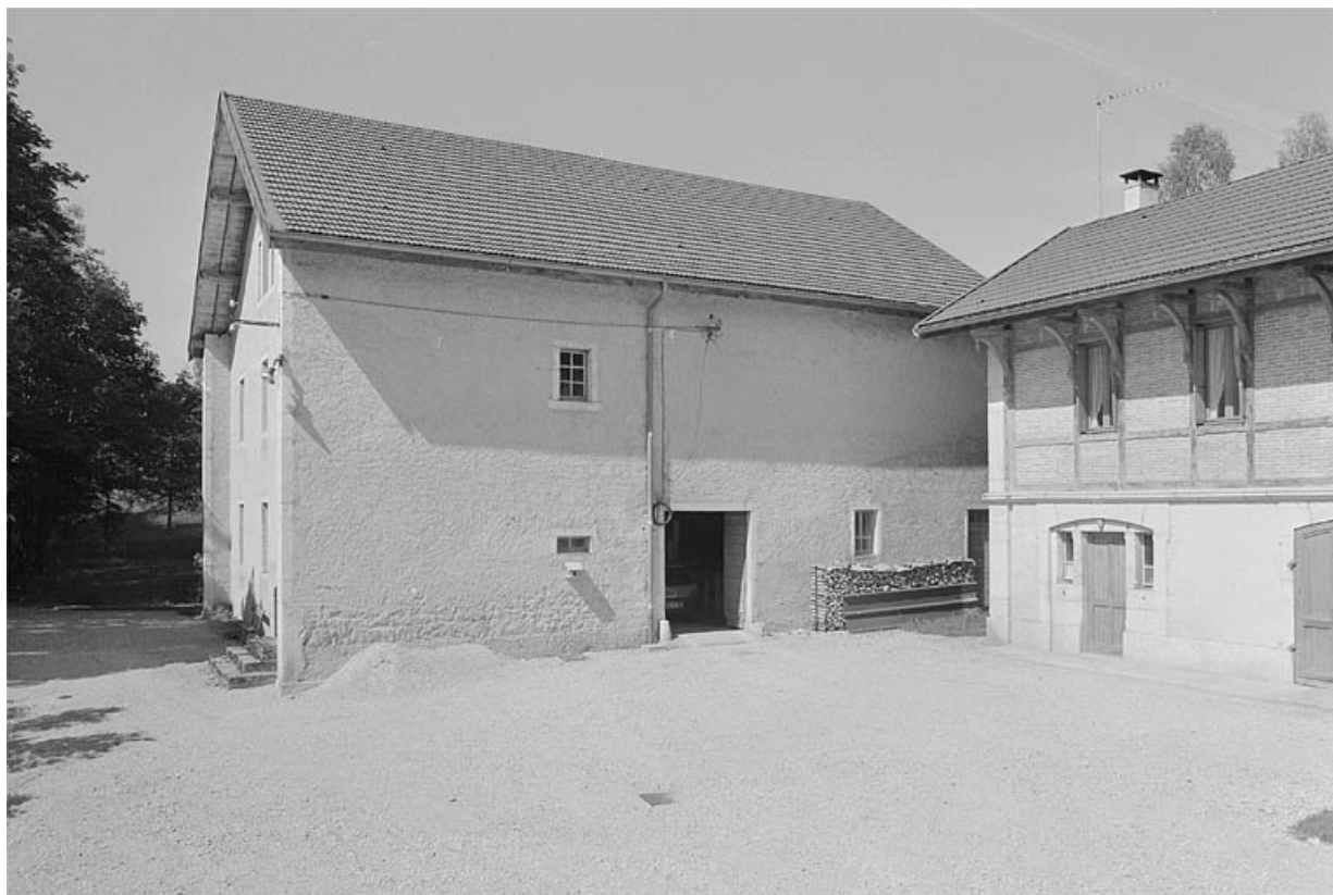
Face droite de la ferme et façade antérieure de la remise à automobile.

39, Avignon-lès-Saint-Claude, lieudit : sous la Goutte