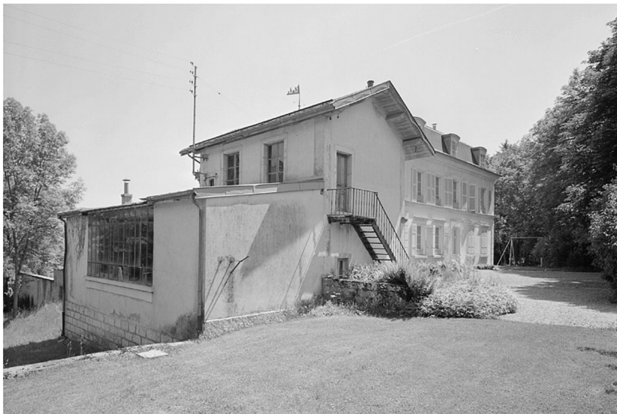
Vue de trois quarts de la face postérieure de l'atelier.

39, Avignon-lès-Saint-Claude, lieudit : sous la Goutte