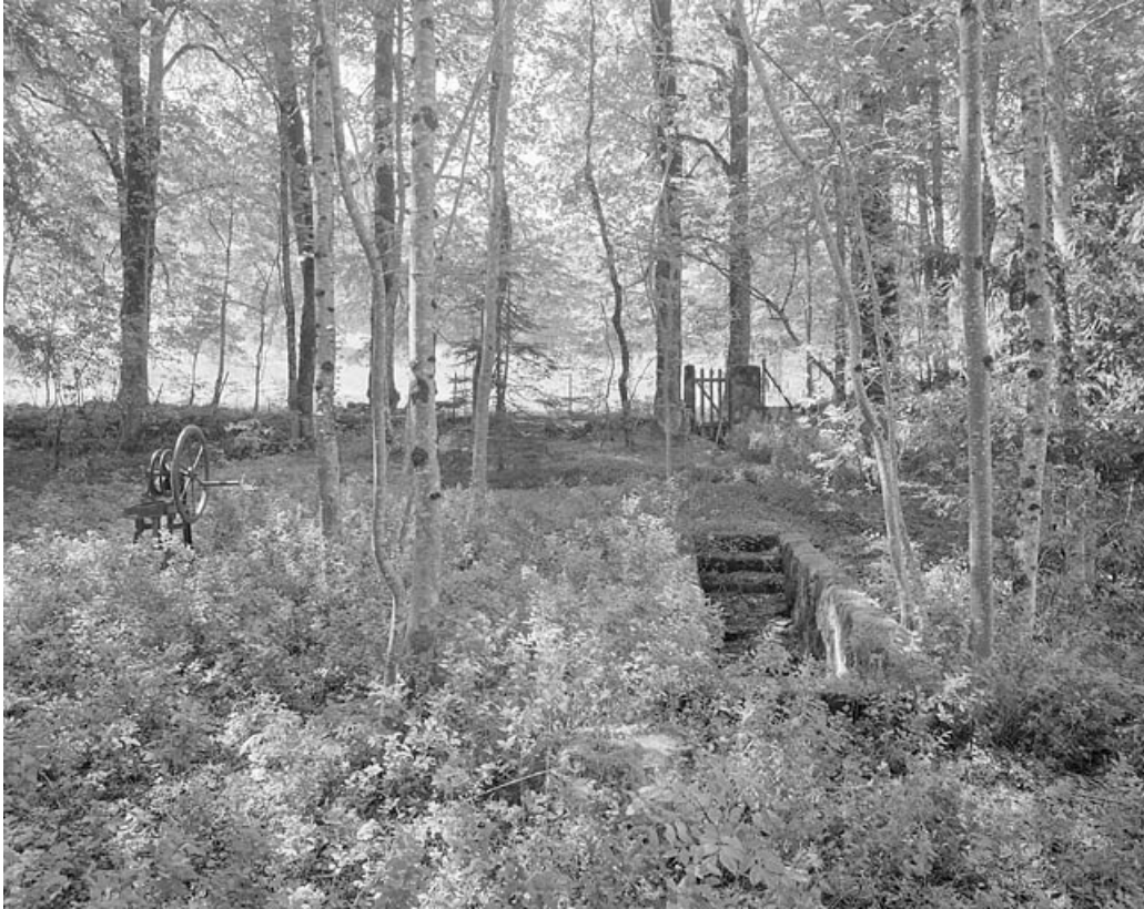
Dans le parc, accès à une citerne enterrée et pompe à eau reliée à cette citerne. 39, Avignon-lès-Saint-Claude, lieudit : sous la Goutte