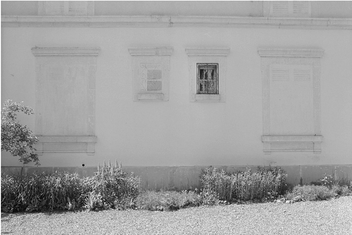
Fenêtres peintes en trompe-l'oeil sur la face gauche de la demeure.

39, Avignon-lès-Saint-Claude, lieudit : sous la Goutte