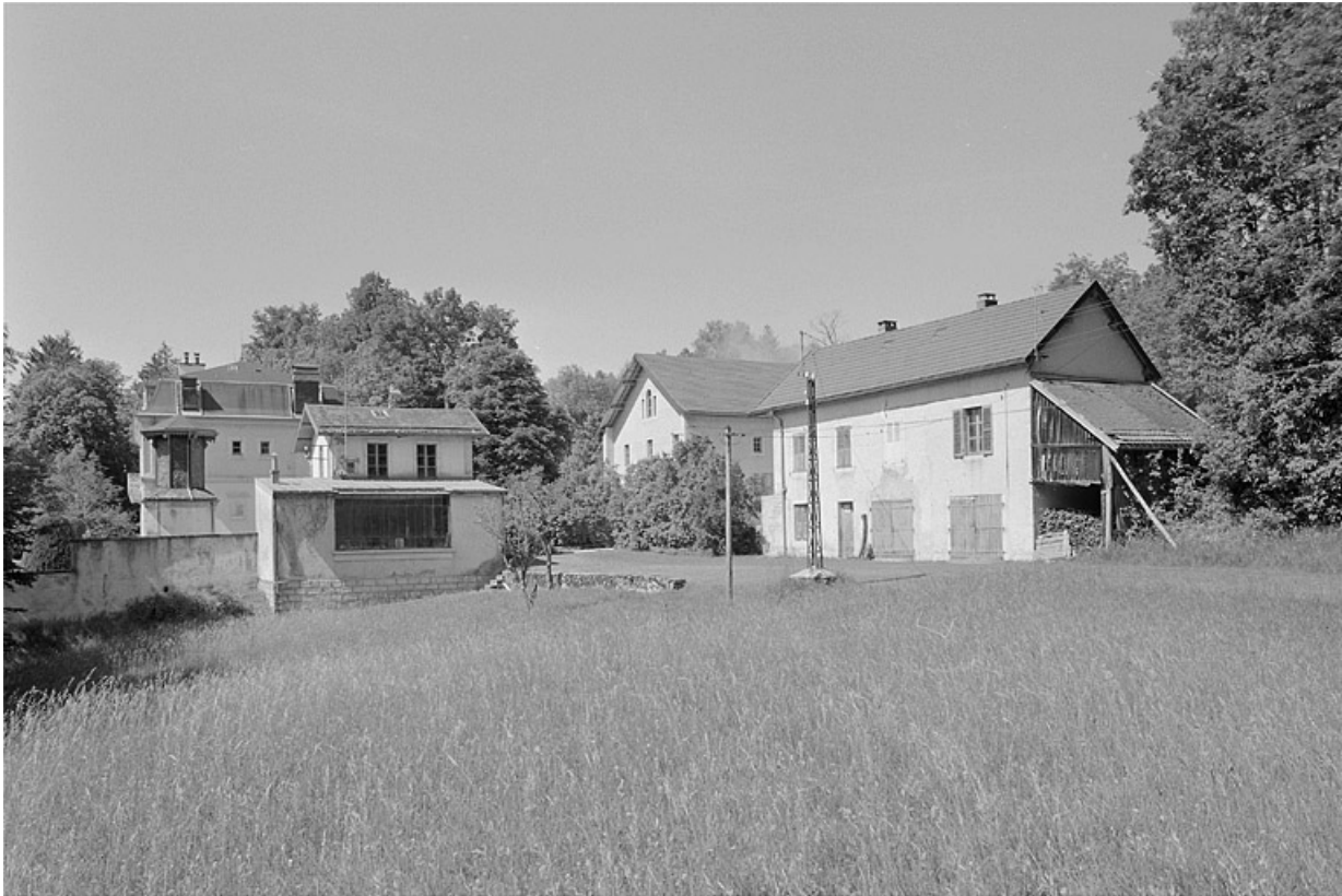
Vue éloignée de la demeure, de la façade postérieure de l'atelier et du logement des jardiniers.

39, Avignon-lès-Saint-Claude, lieudit : sous la Goutte