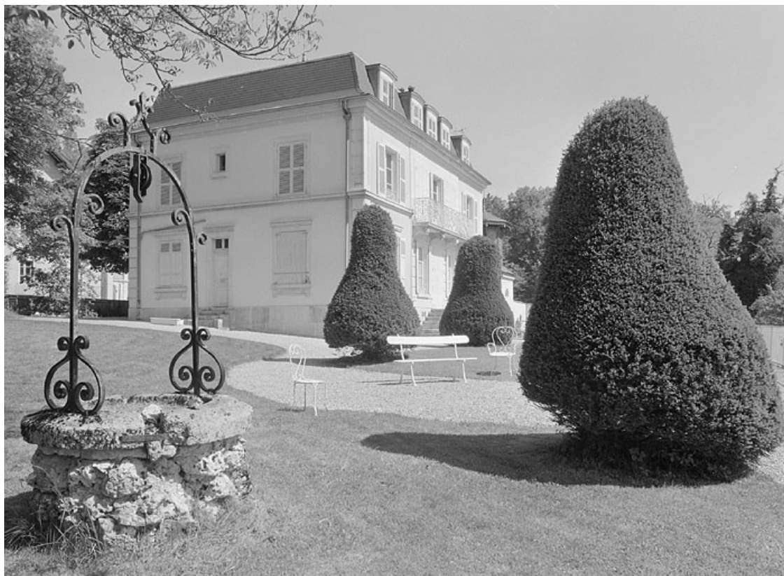
Façade sur jardin et face droite de la demeure.

39, Avignon-lès-Saint-Claude, lieudit : sous la Goutte