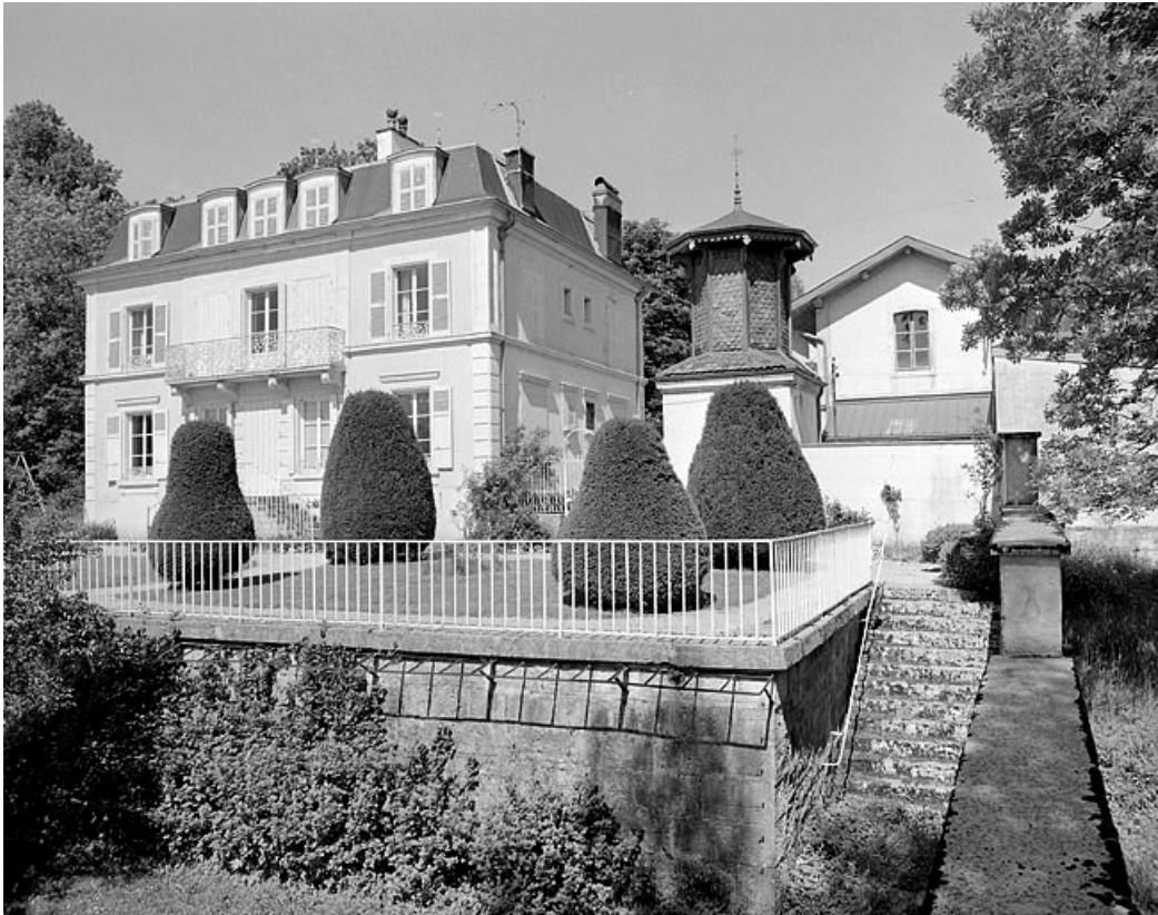
Façade sur jardin de la demeure, pigeonnier et face latérale de l'atelier.

39, Avignon-lès-Saint-Claude, lieudit : sous la Goutte