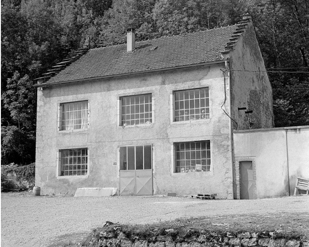
Façade antérieure du moulin.

39, Vaux-lès-Saint-Claude, 1750 route de la Vallée, lieudit : Moulin de Vaux