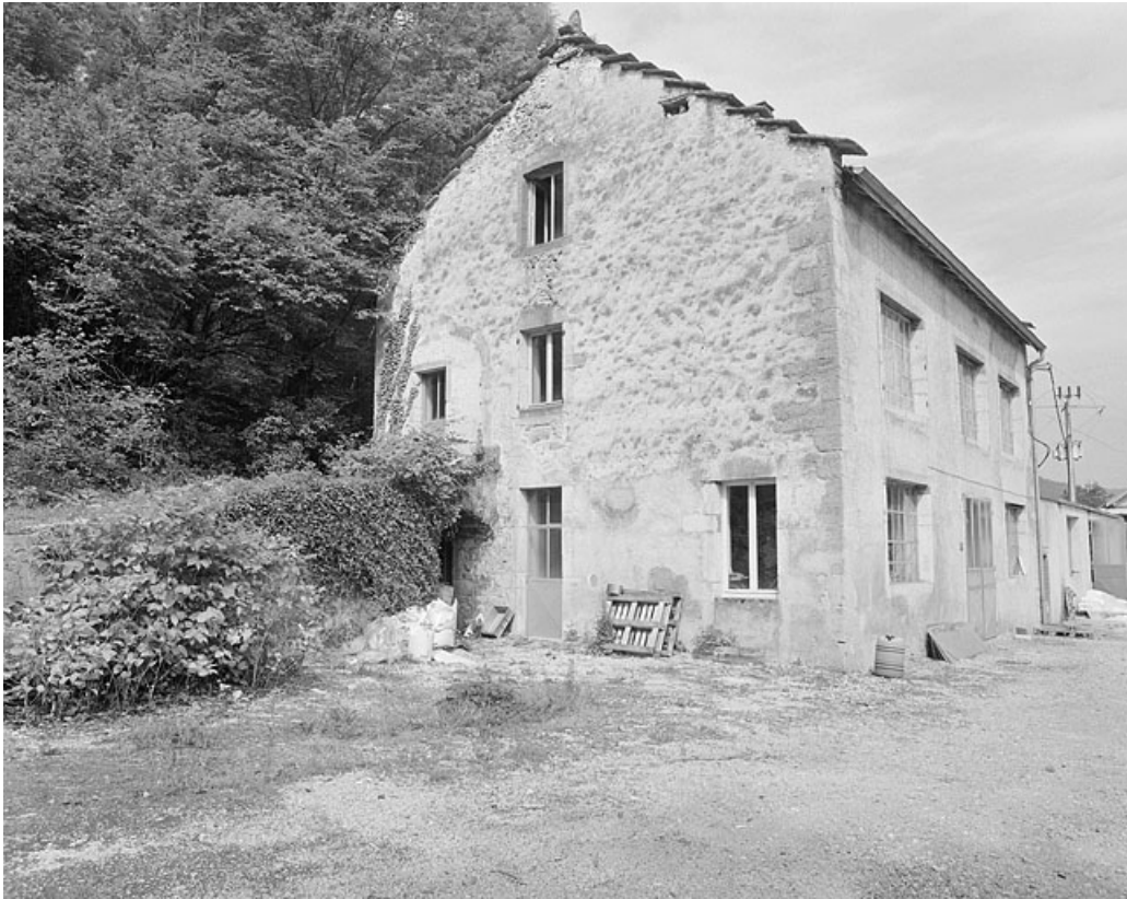
Façade antérieure et face gauche du moulin.

39, Vaux-lès-Saint-Claude, 1750 route de la Vallée, lieudit : Moulin de Vaux