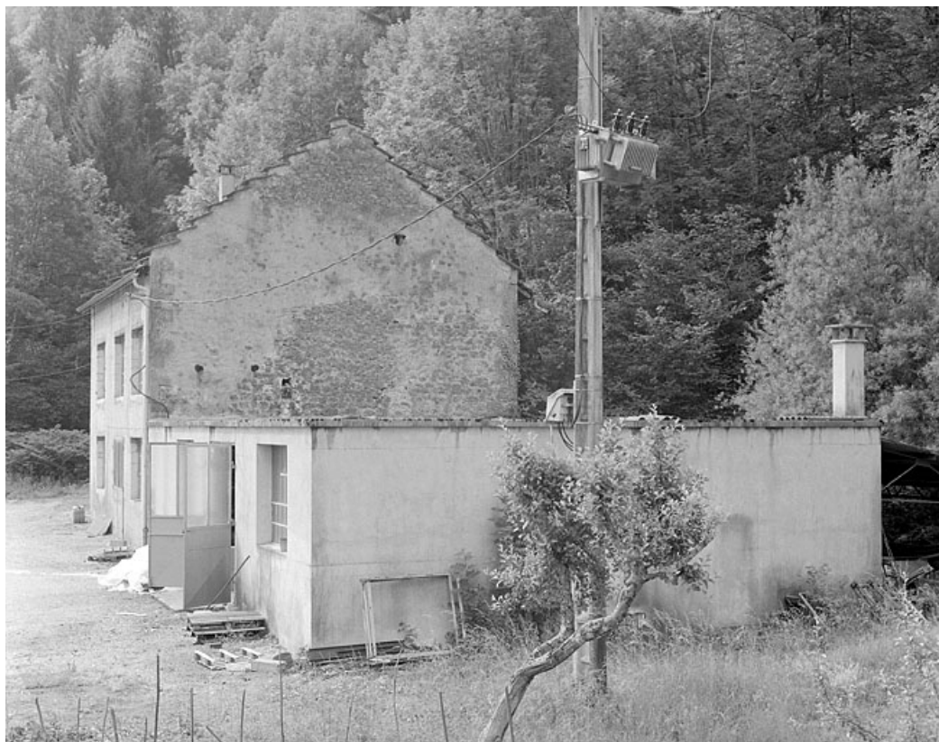
Face droite du moulin et de la partie construite en 1980.

39, Vaux-lès-Saint-Claude, 1750 route de la Vallée, lieudit : Moulin de Vaux