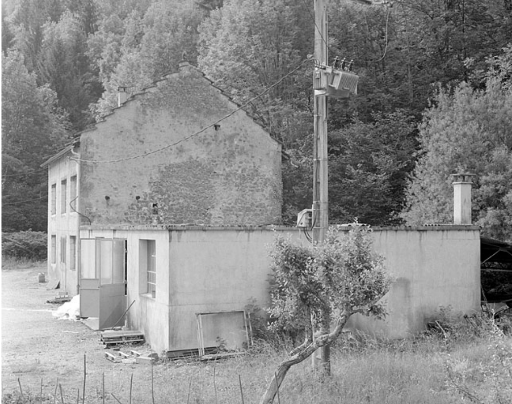
Face droite du moulin et de la partie construite en 1980.

39, Vaux-lès-Saint-Claude, 1750 route de la Vallée, lieudit : Moulin de Vaux