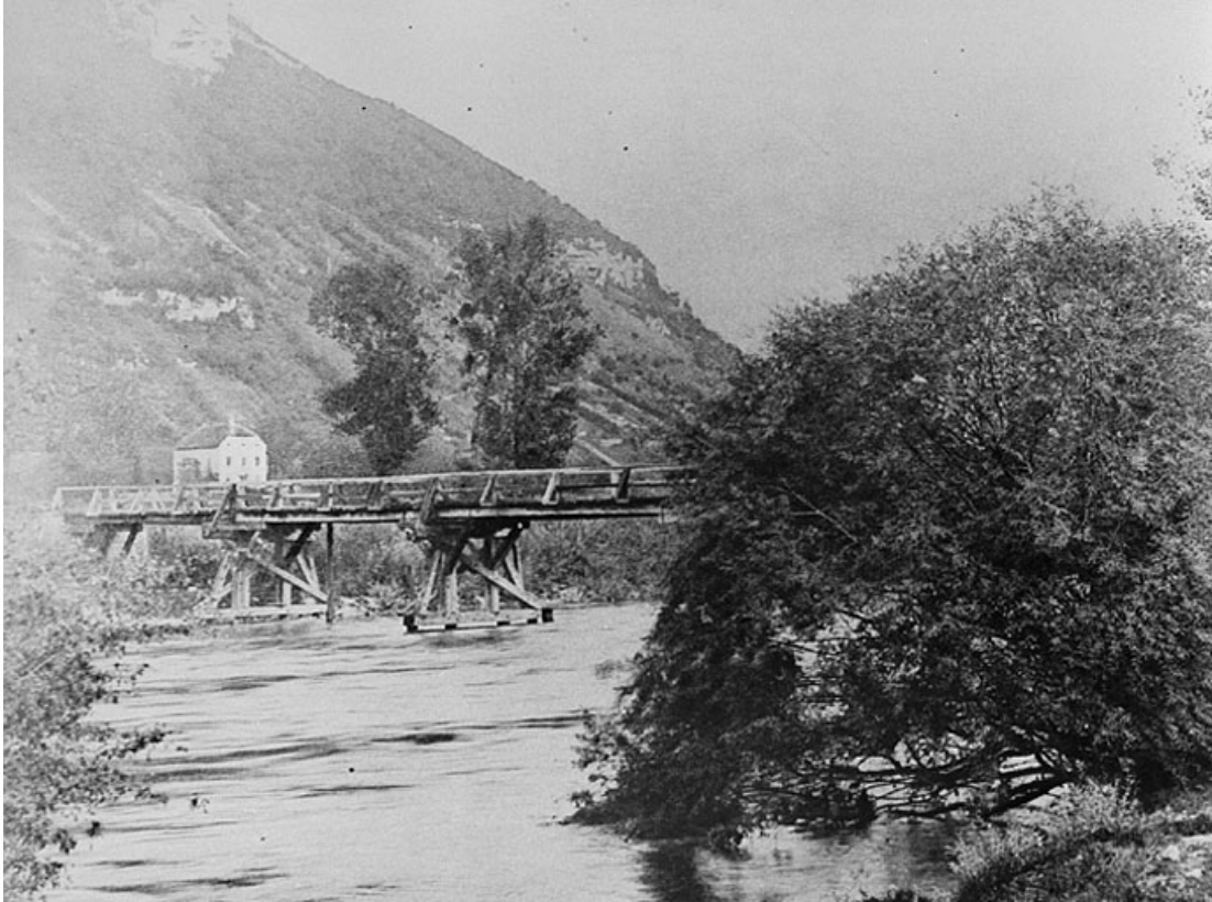
Pont en bois sur la Bienne et au loin le Château des Granges.