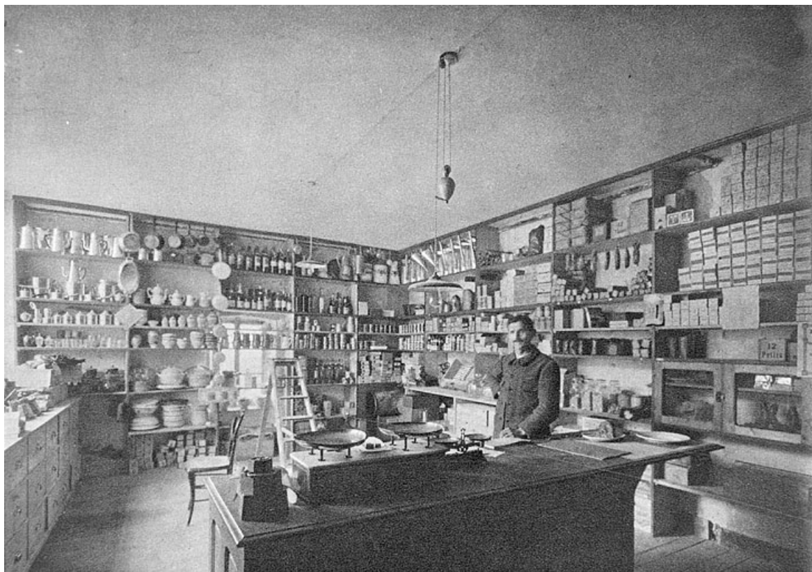
La Fraternelle, société coopérative d'alimentation ; succursale de Vaux-les-Saint-Claude. Magasin de détail. 39, Vaux-lès-Saint-Claude