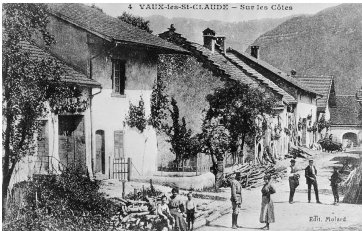
Vaux-lès-Saint-Claude - sur les Côtes.