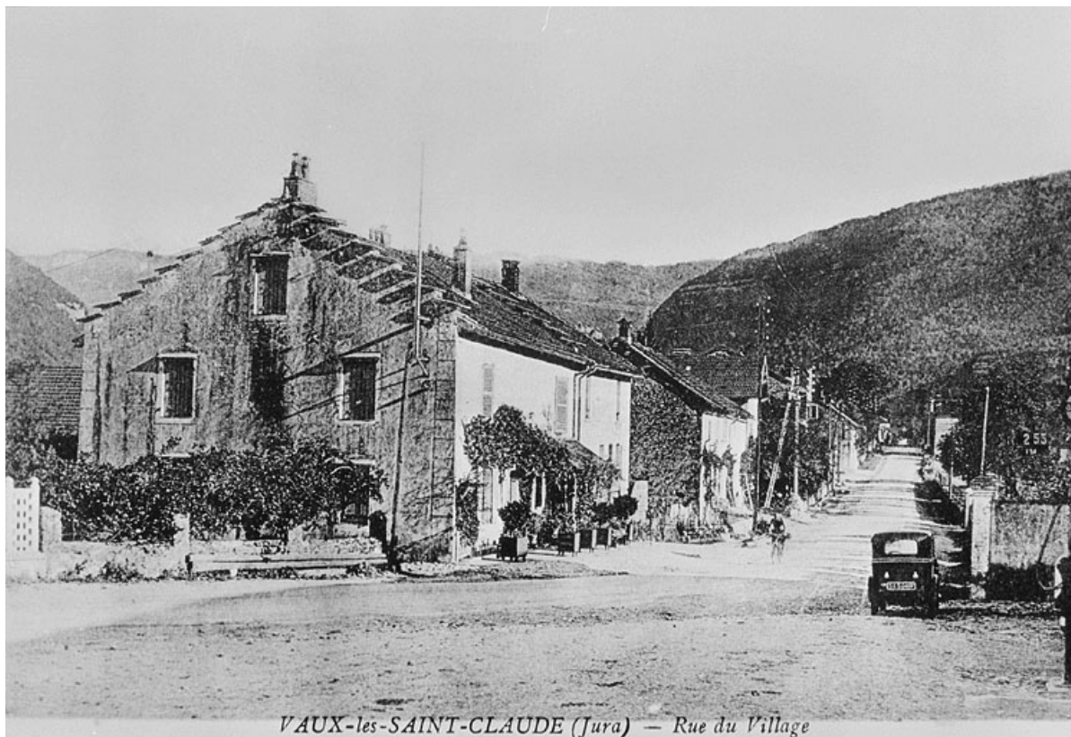
VAUX-lès-SAINTE-CLAUDE (Jura) — Rue du Village

Vaux-lès-Saint-Claude (Jura) - rue du village.