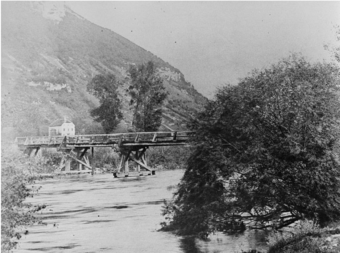
Pont en bois sur la Bienne et au loin le Château des Granges.