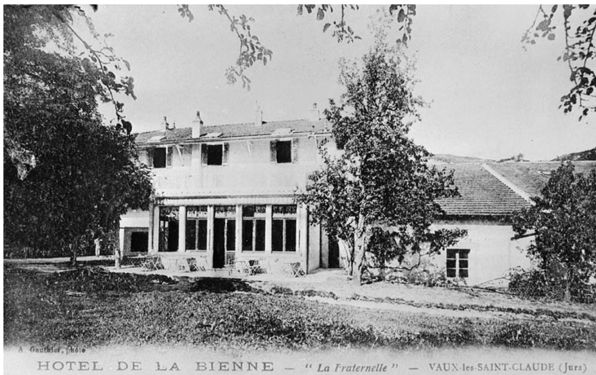
Hôtel de la Bienne - " la Fraternelle " - Vaux-lès-Saint-Claude.