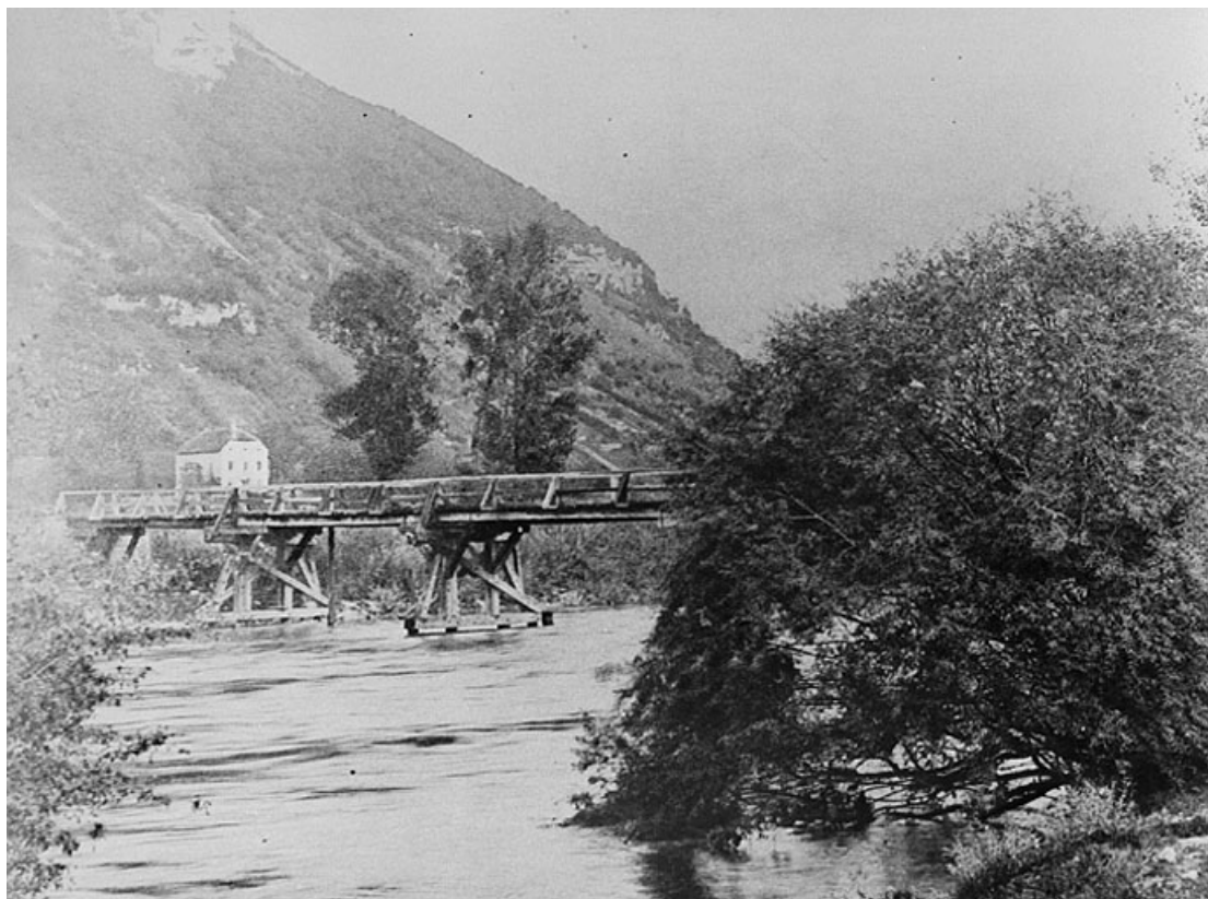
Pont en bois sur la Bienne et au loin le Château des Granges.