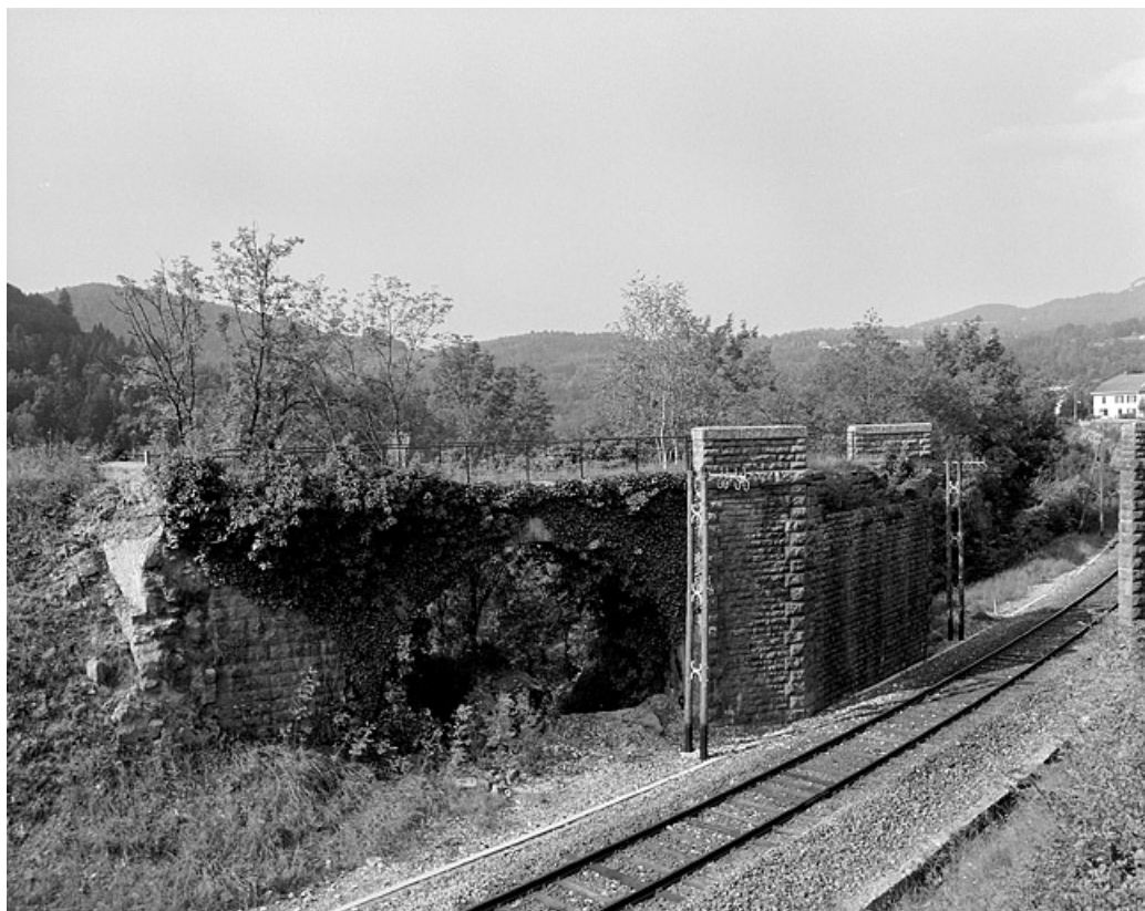
Ruines du pont du tramway enjambant la voie ferrée de Saint-Claude à Clairvaux-les-Lacs, à Lizon.