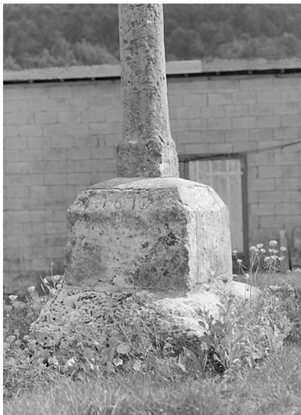
Date 1670 portée sur le socle.