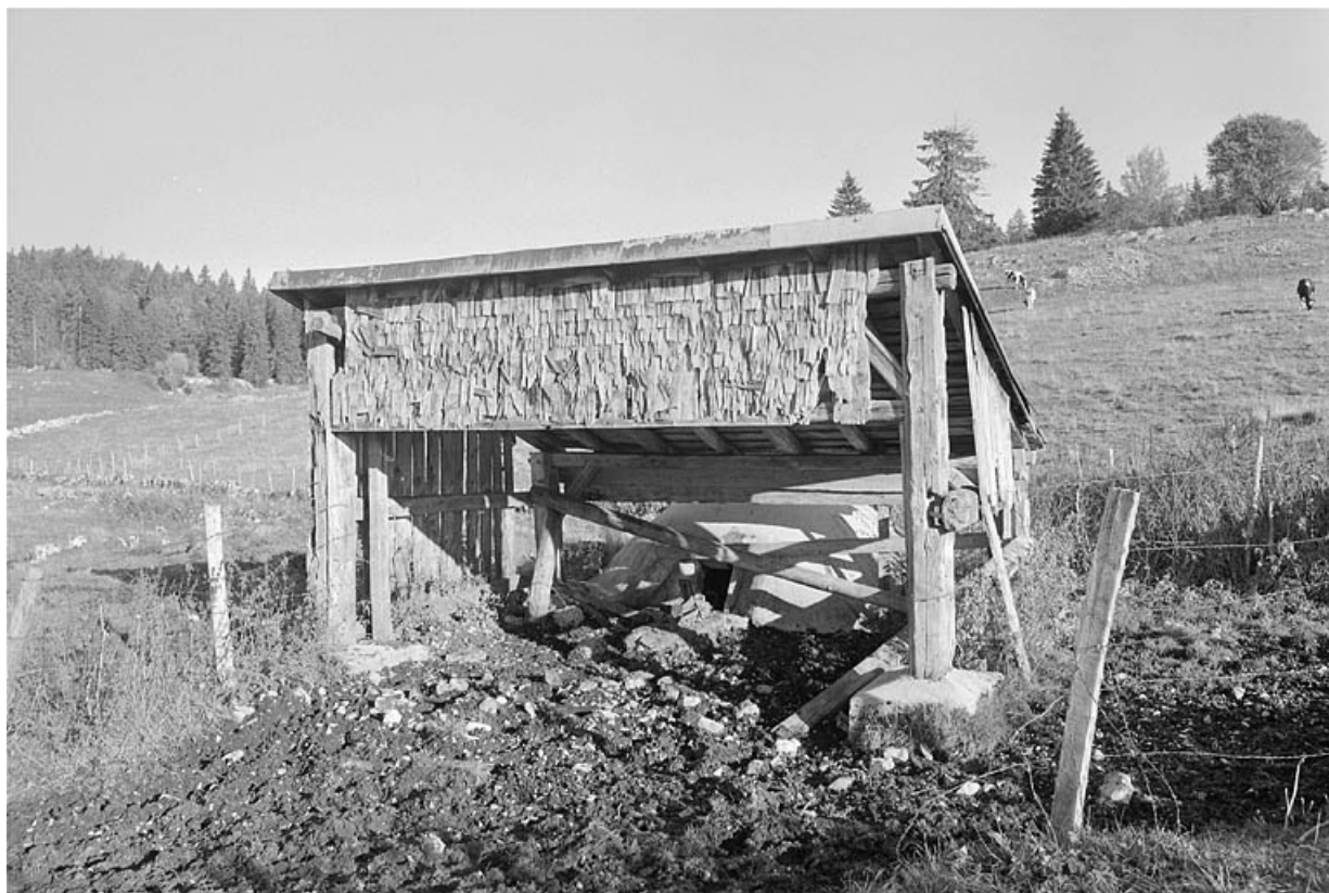
Façade antérieure d'un abreuvoir à Petite Joux. 39, Lajoux