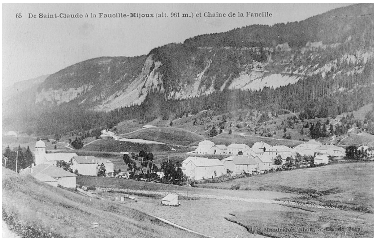
De Saint-Claude à la Faucille. Mijoux (alt. 961m.).