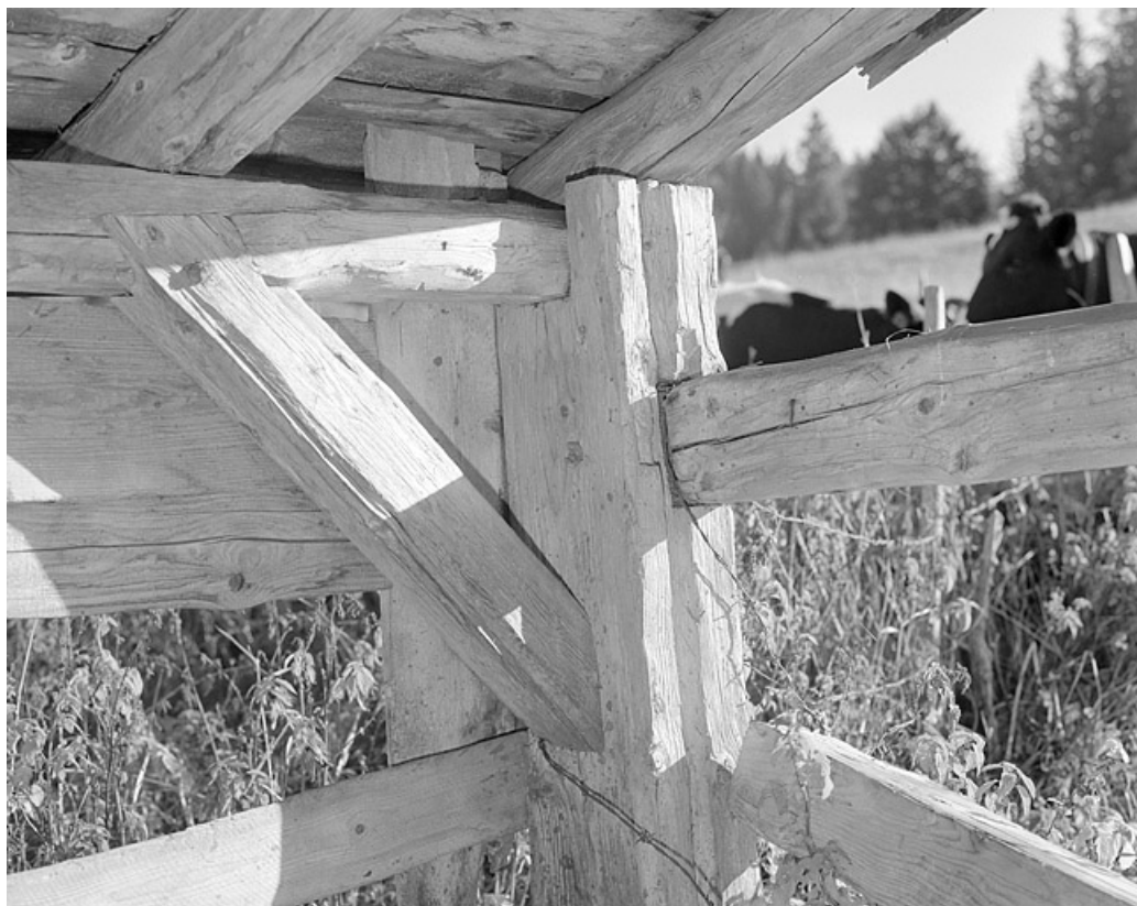
Assemblage de la charpente de l'abreuvoir.