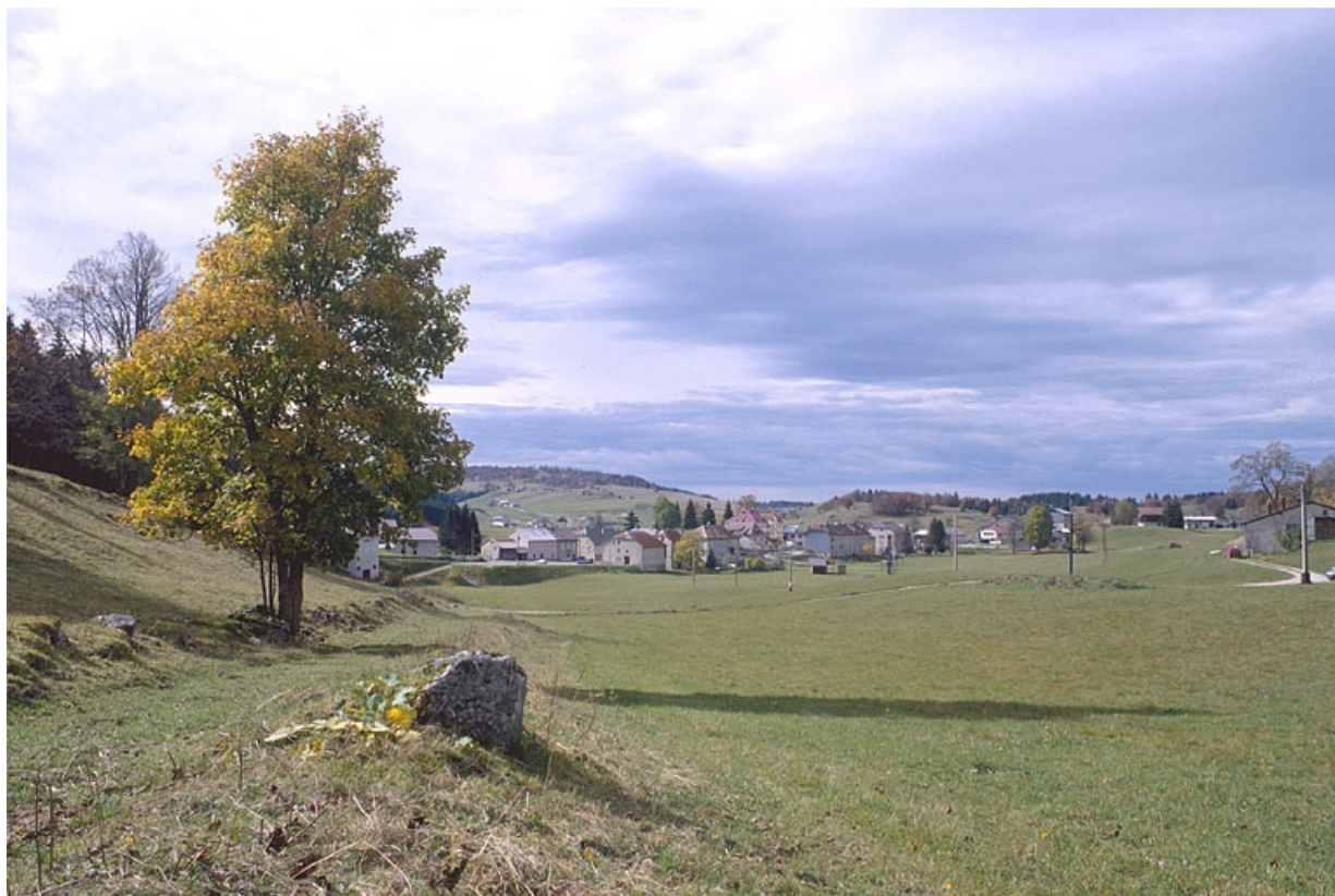
Vue générale du village.