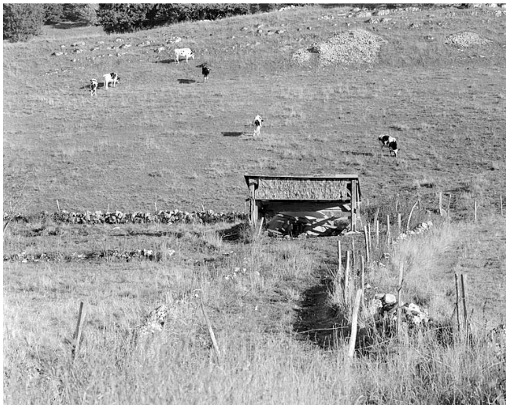
Abreuvoir à Petite Joux.