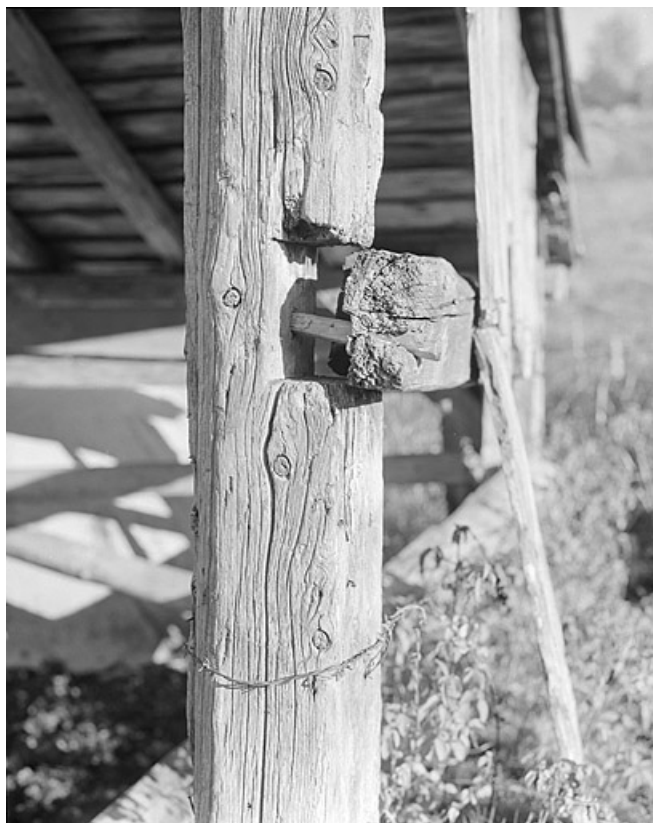
Assemblage à mi-bois poteaux-panne par une cheville.