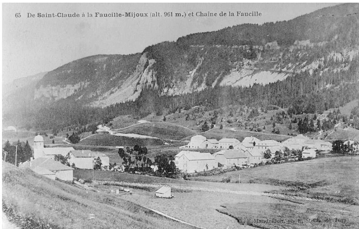
De Saint-Claude à la Faucille. Mijoux (alt. 961m.).