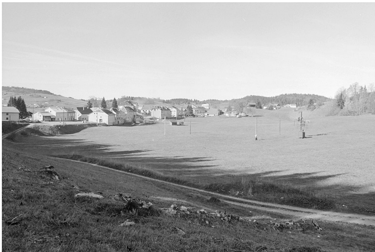
Le village de Lajoux depuis la route de la forêt du Massacre.