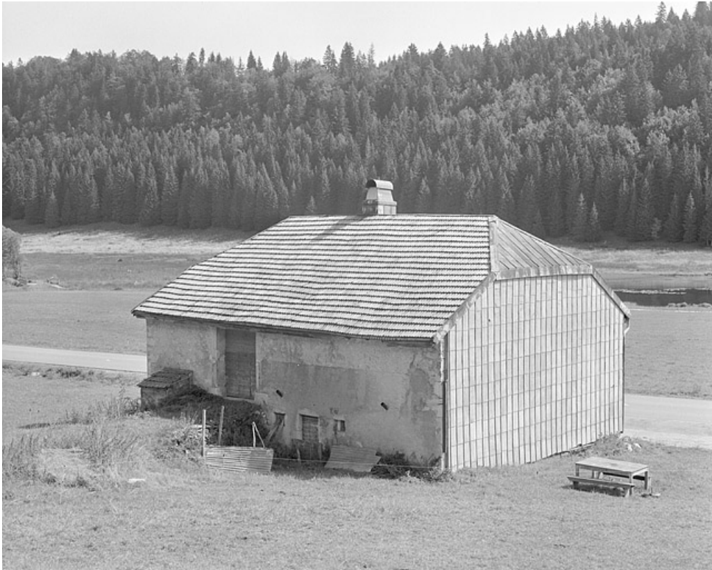
Face sud-ouest et façade postérieure.