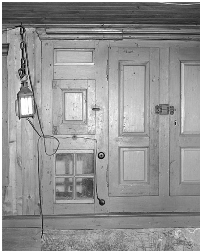
Guichet permettant de surveiller l'étable.