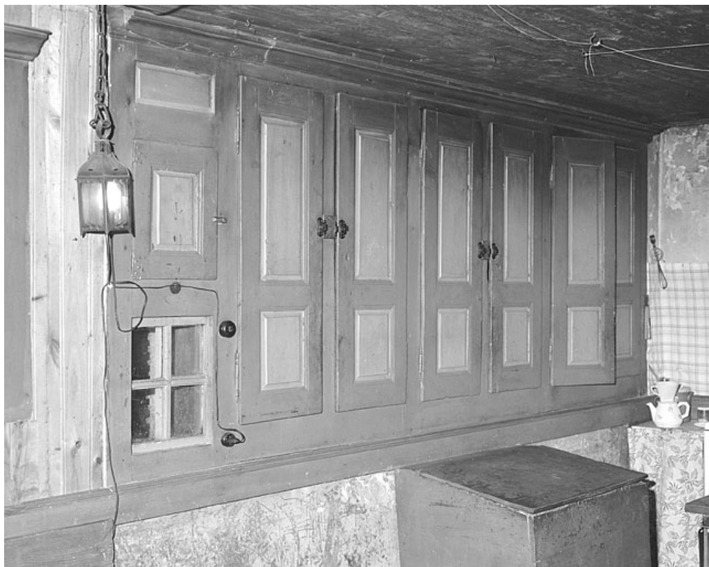
Placard intégré dans le mur de la pièce de séjour.