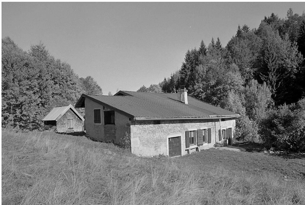
Façade antérieure et face sud-ouest.