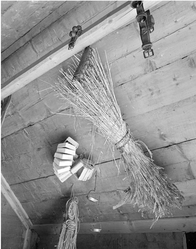
Boîtes à chevrets (copette) et lampe à huile de lapidaire (croésu). 39, Lamoura chemin Sous la Roche