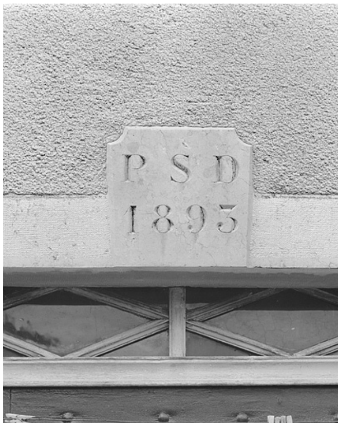
Date et initiales sur le linteau de la façade antérieure.