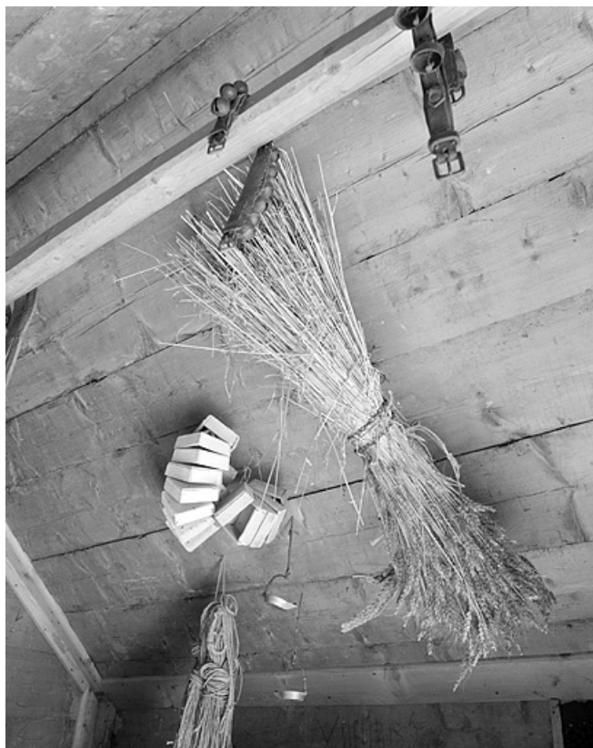
Boîtes à chevrets (copette) et lampe à huile de lapidaire (croésu). 39, Lamoura chemin Sous la Roche