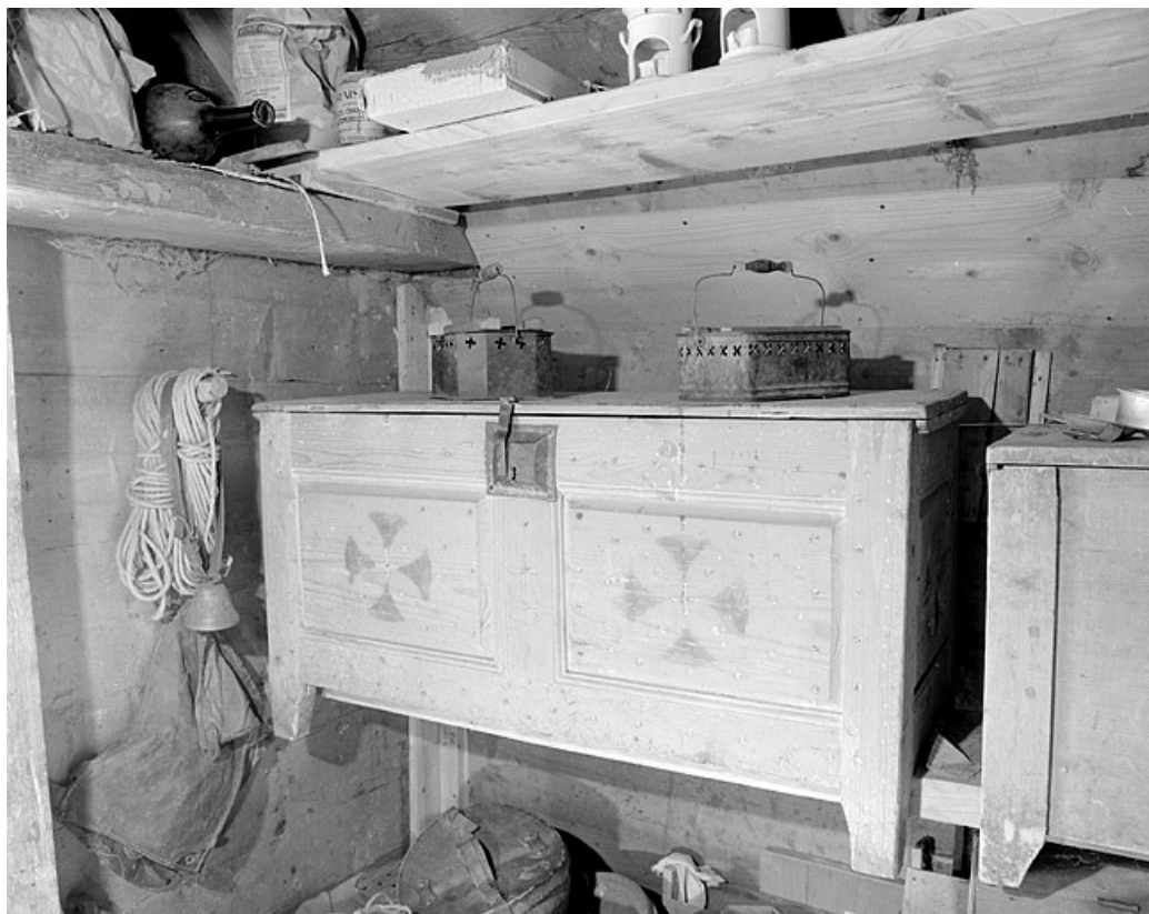
Coffre à vêtement dans le grenier fort.