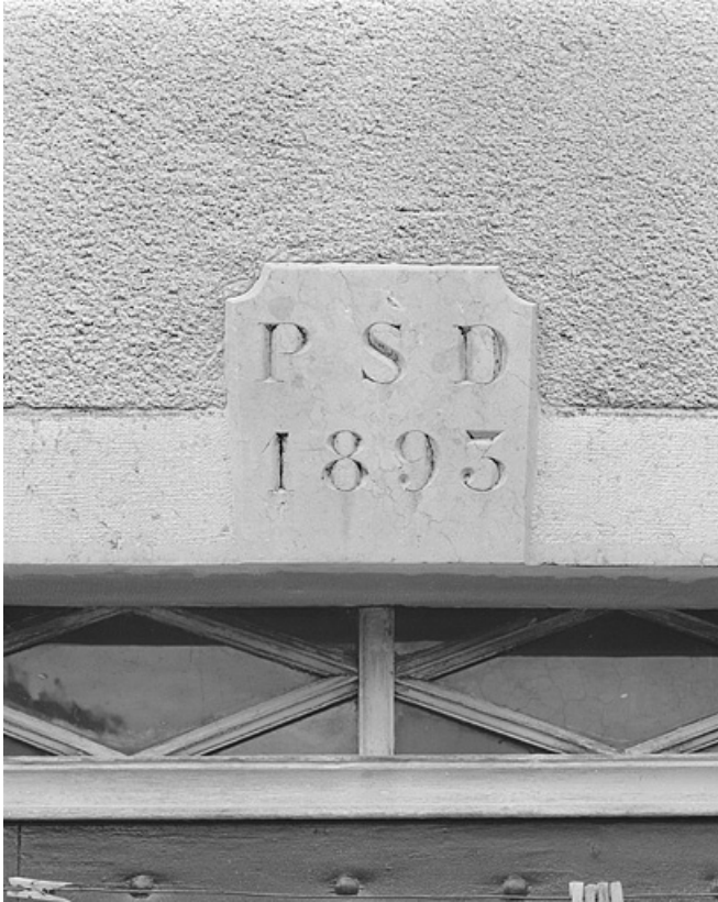
Date et initiales sur le linteau de la façade antérieure.