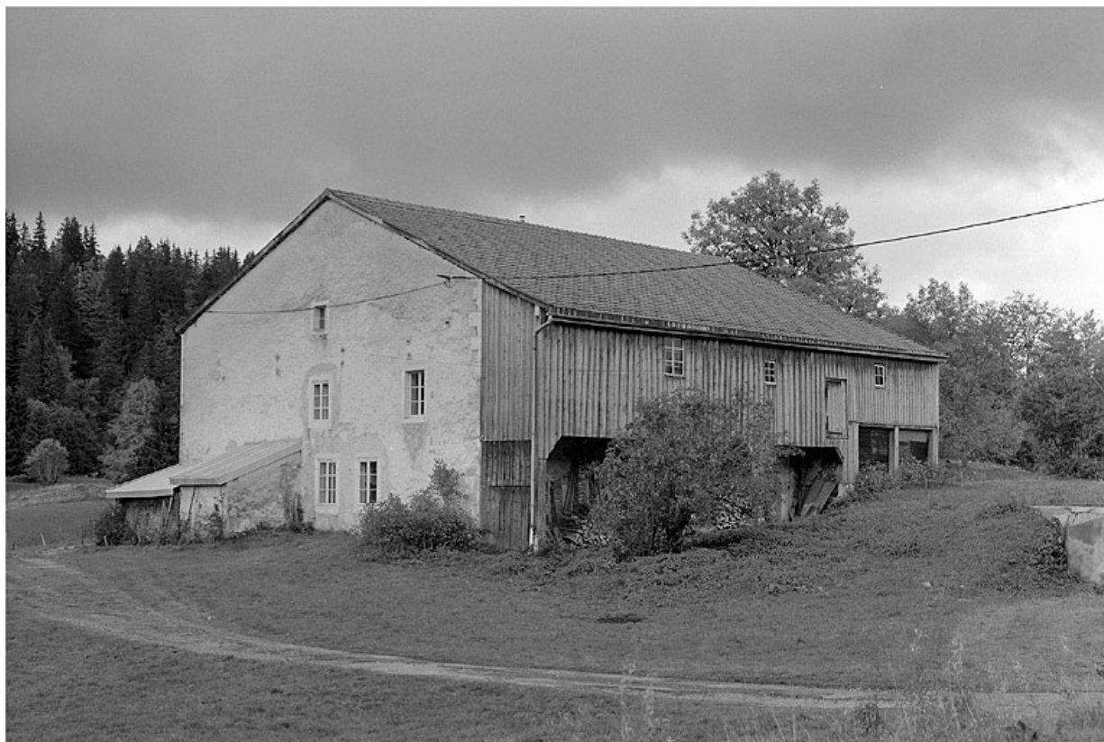
Face nord-est et façade postérieure.