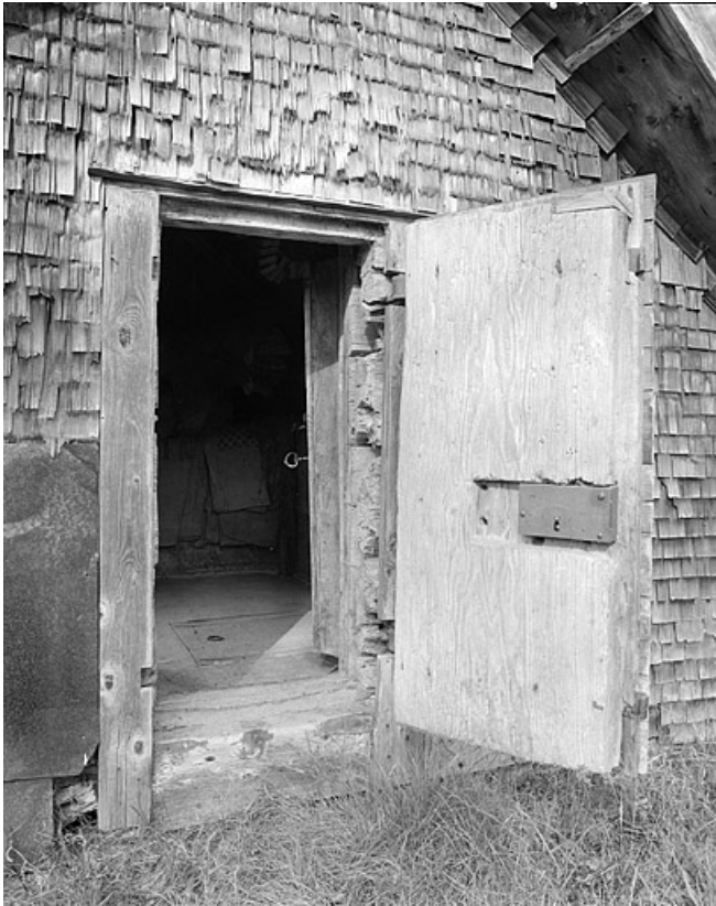
Les deux portes du grenier fort ouvertes.