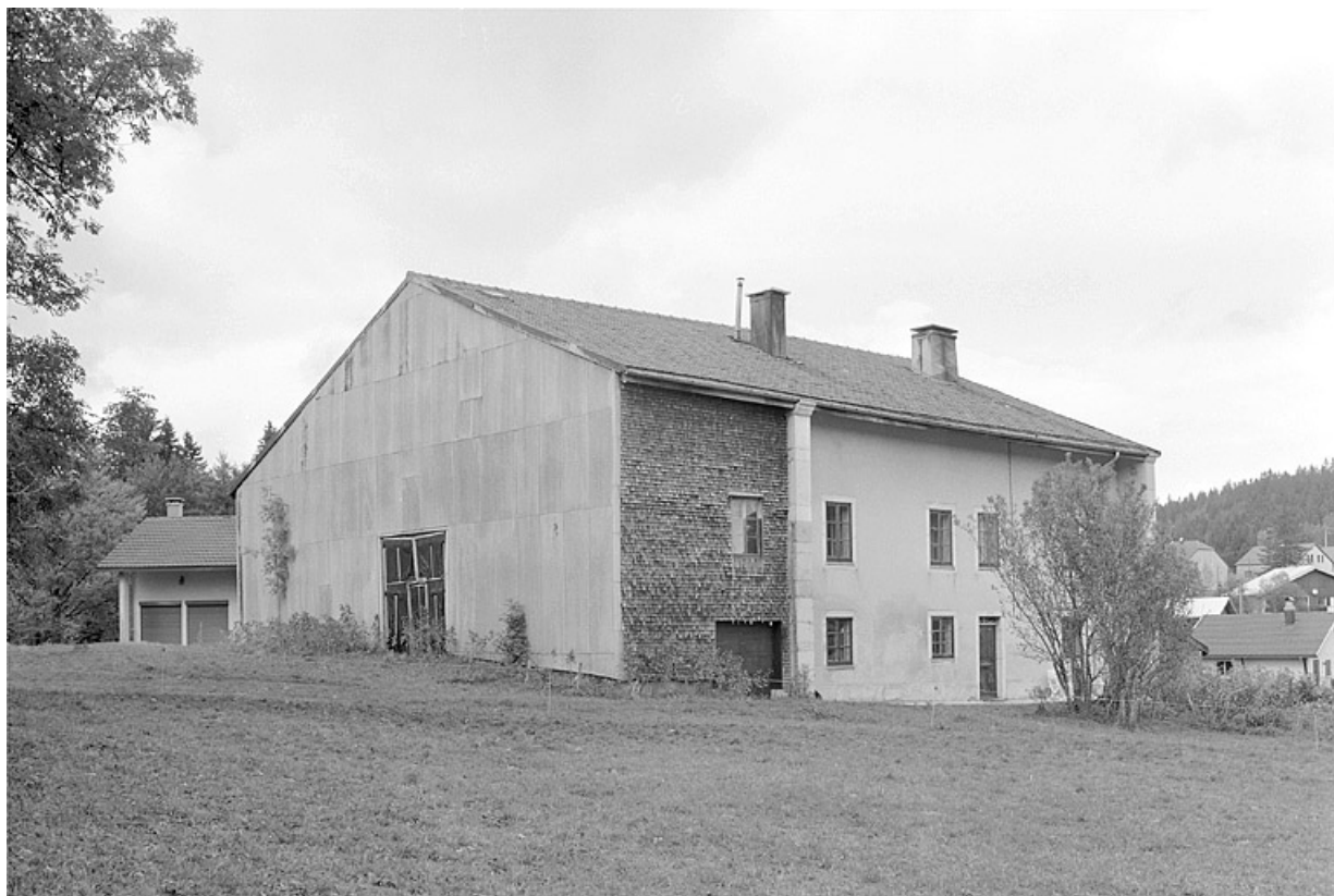
Façade antérieure et face sud-ouest.