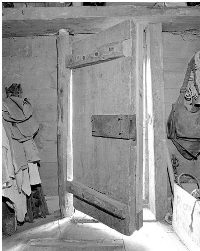
Porte intérieure du grenier fort. 39, Lamoura chemin Sous la Roche