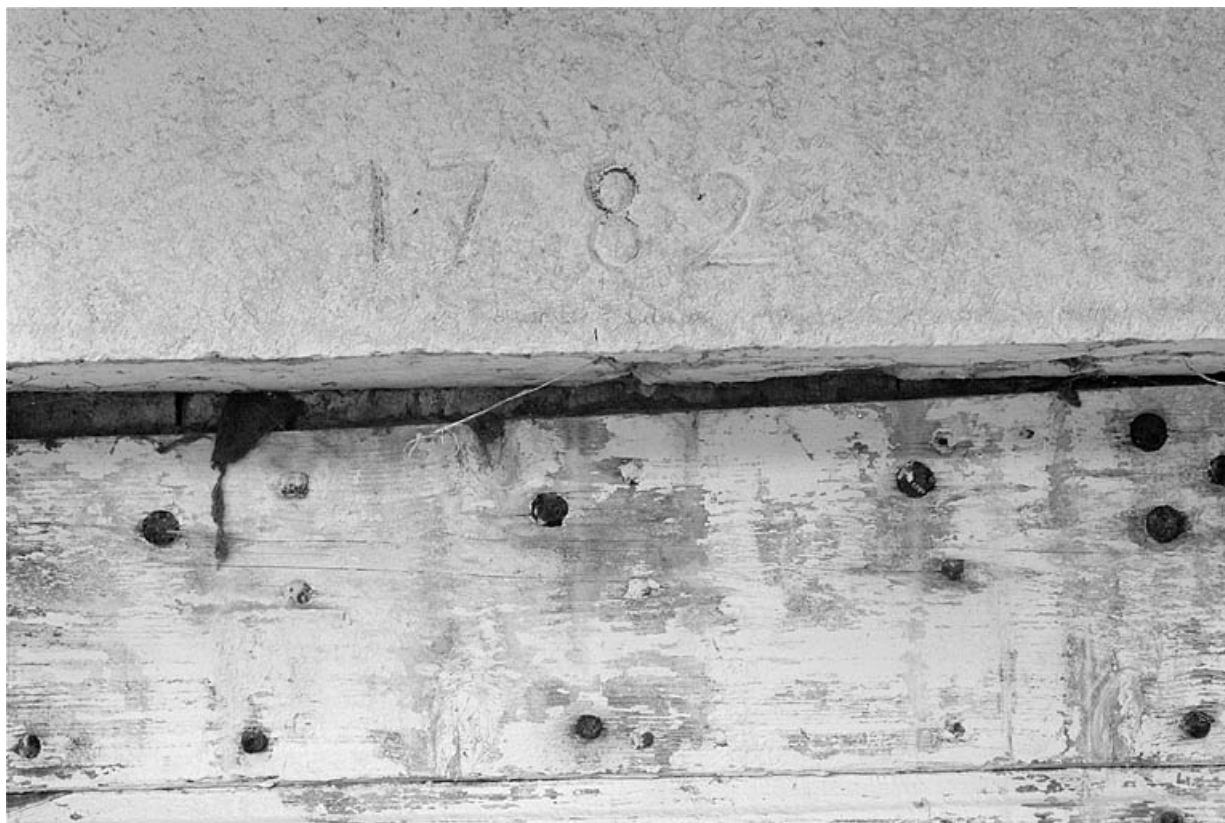
Date portée par l'entrée de l'étable sur la façade postérieure.