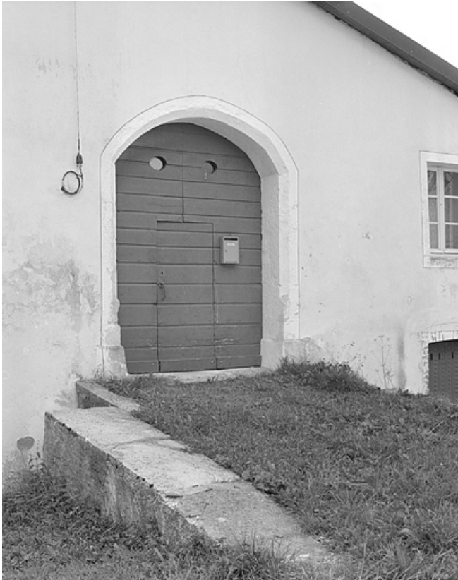
Porte de la grange haute. 39, Lamoura Grande Rue