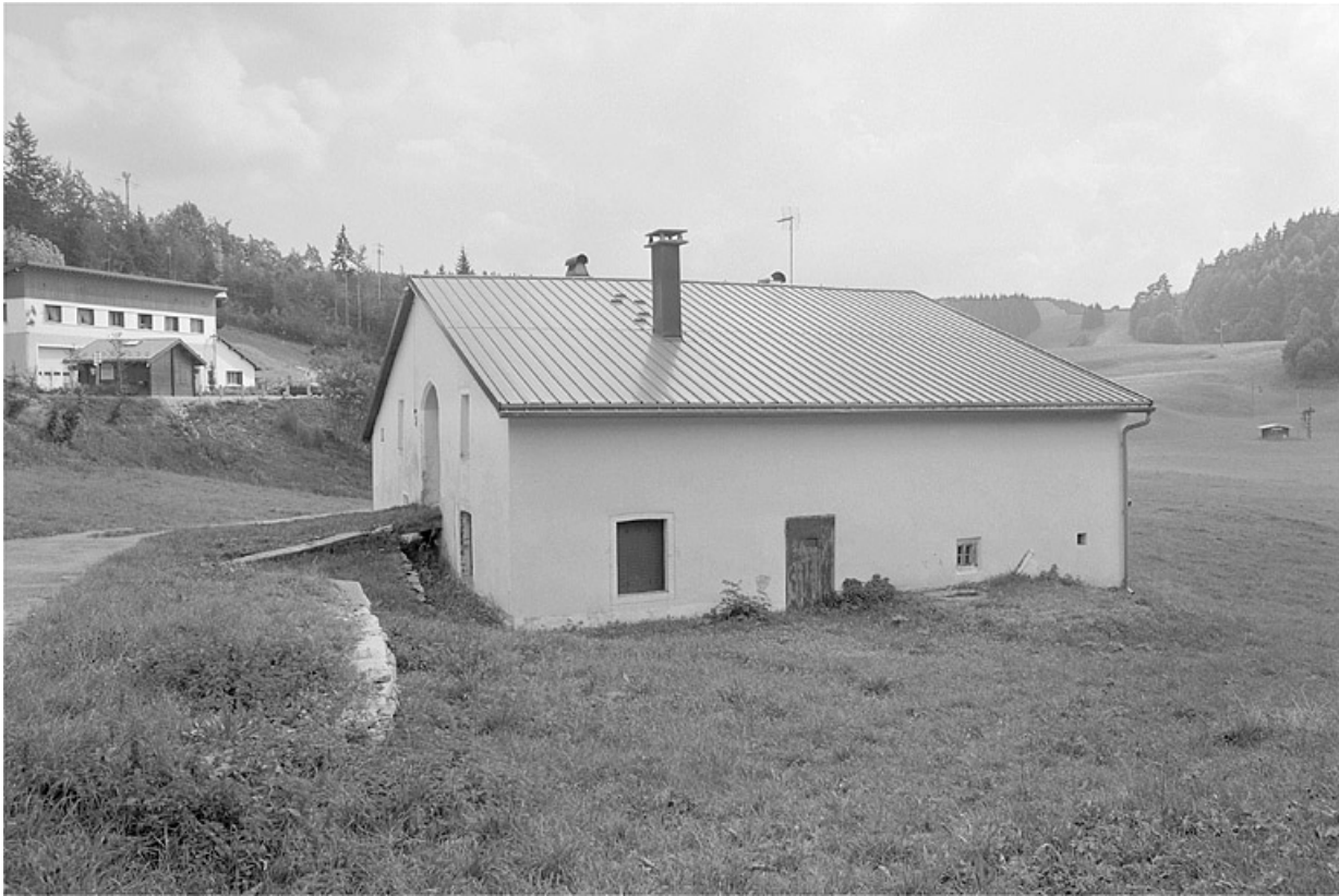
Façade postérieure et face nord-est.