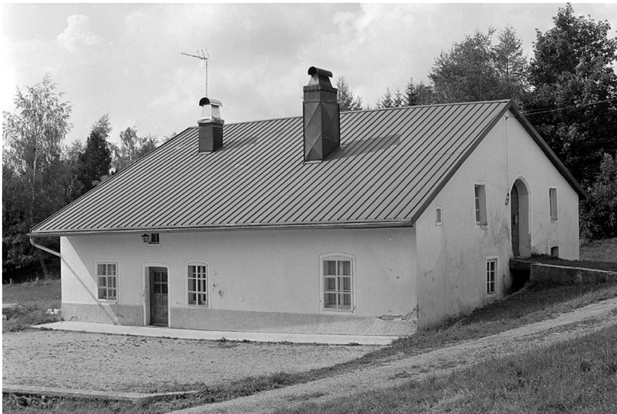
Vue générale de la ferme : façade antérieure et face droite.