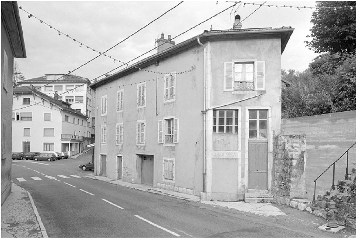
Façade sur la rue.