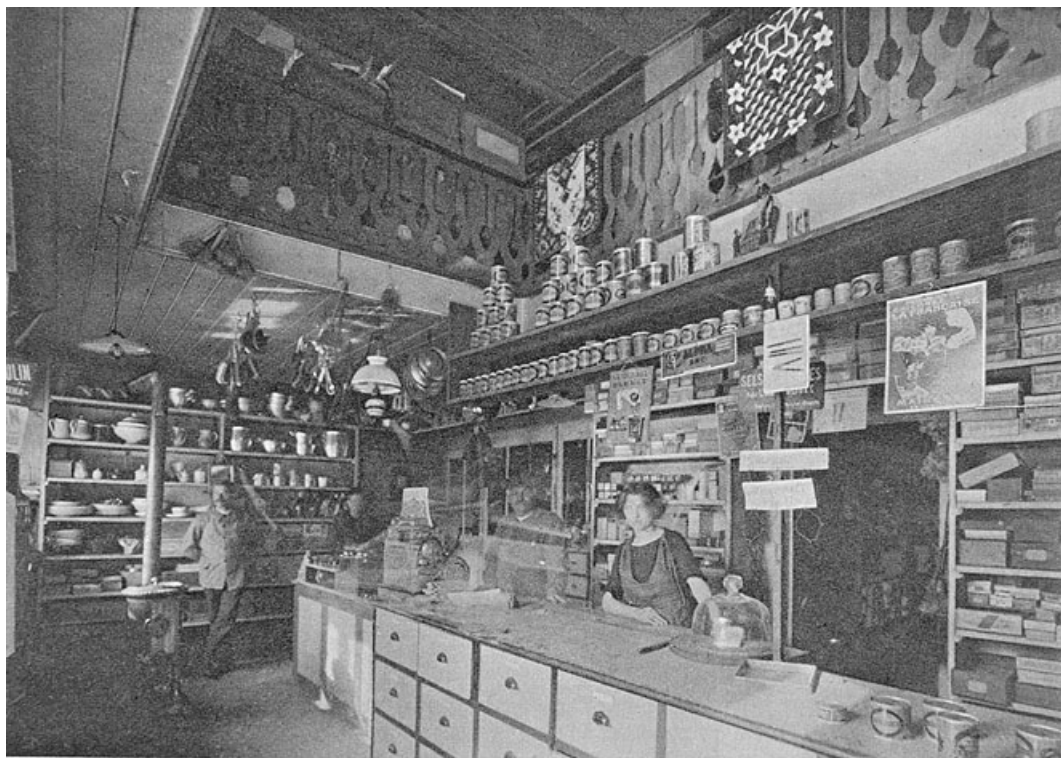
49. — La Fraternelle , Société coopérative d'alimentation ; succursale de Septmoncel — Magasin de détail.

La Fraternelle, Société coopérative d'alimentation ; succursale de Septmoncel - Magasin de détail. 39, Septmoncel Désiré Dalloz