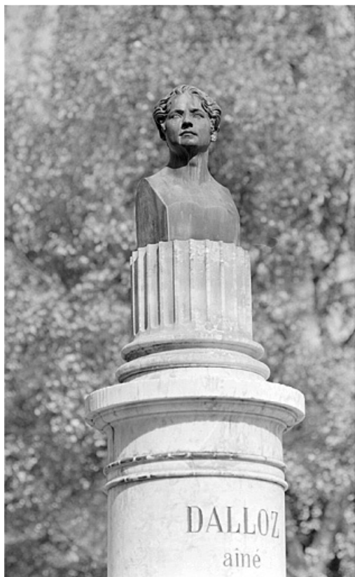
Le buste de Désiré Dalloz.