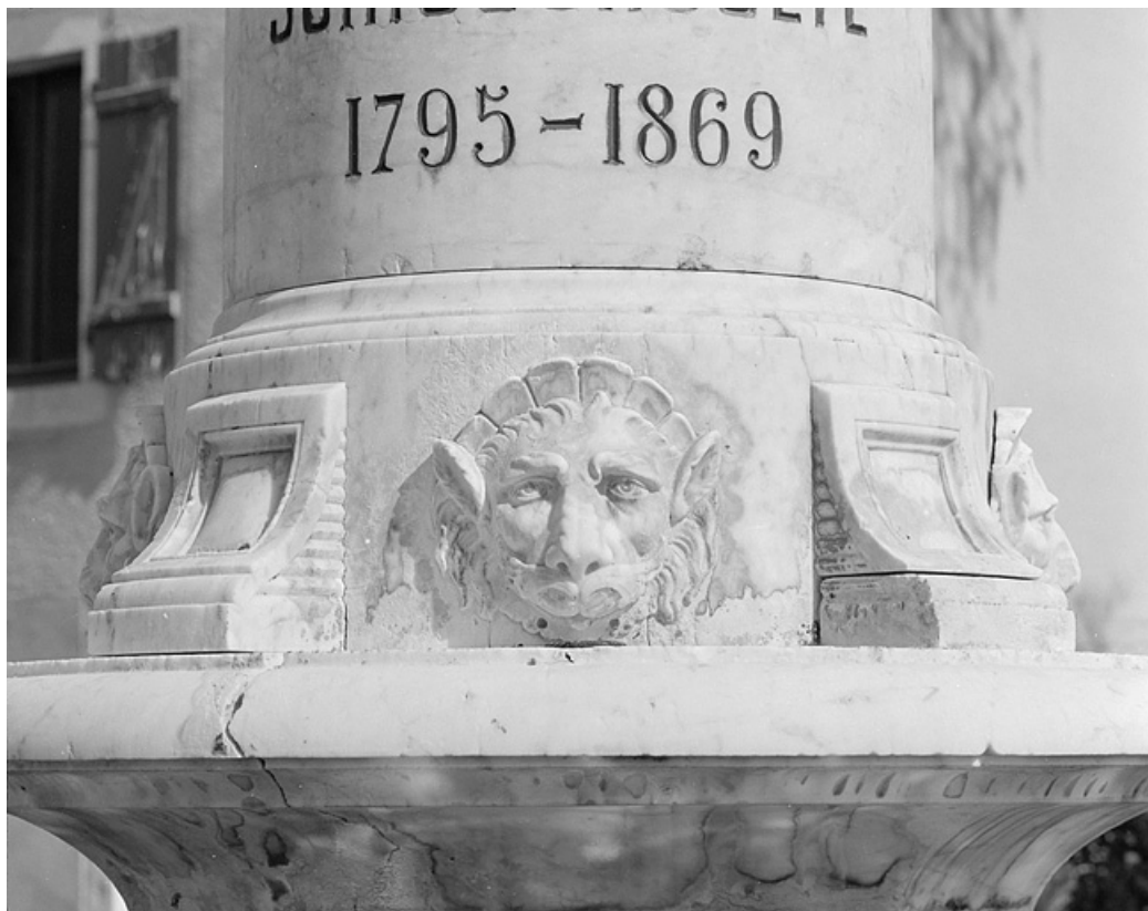
Tête de lion sur la base de la colonne.