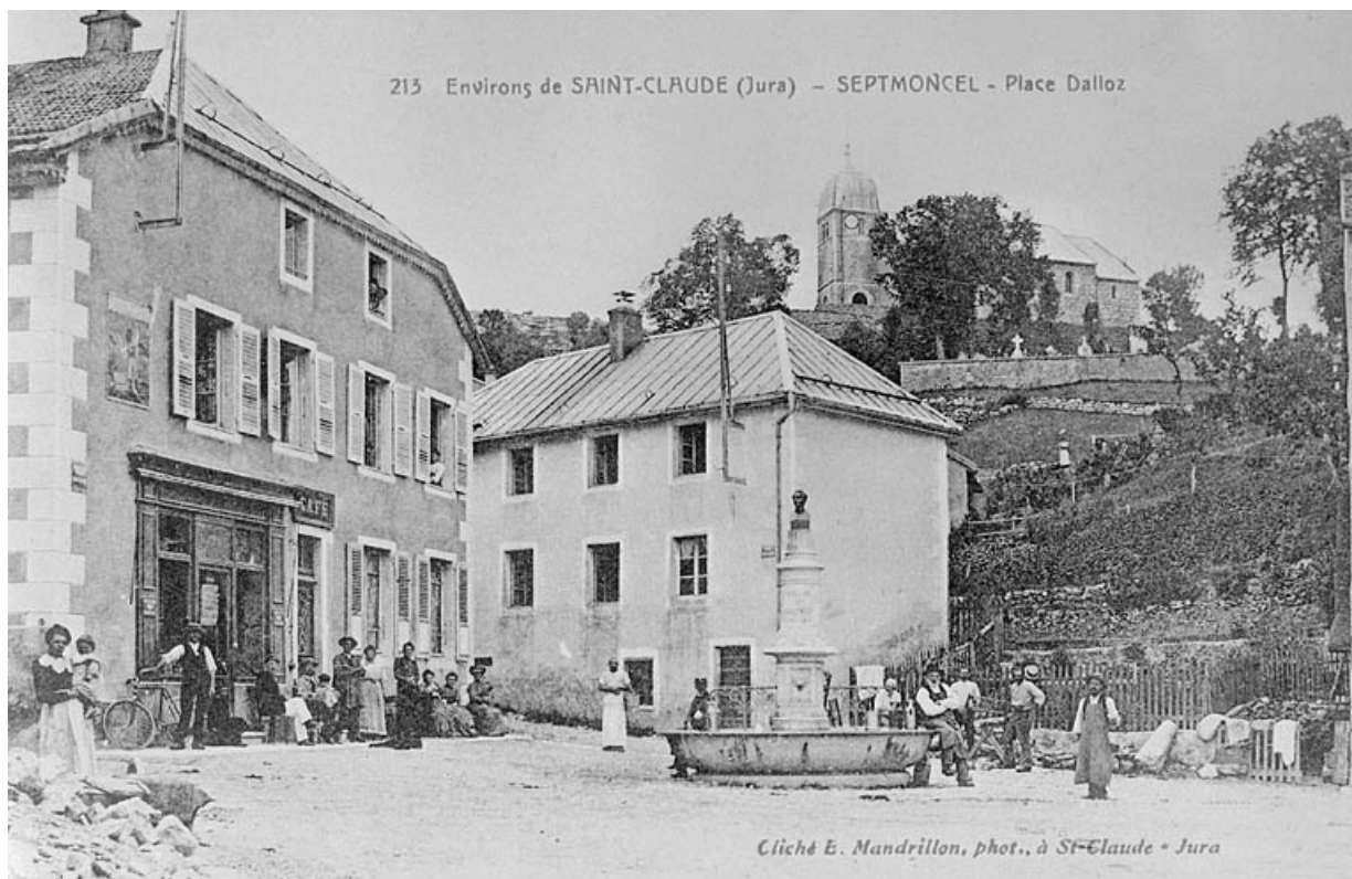
Environs de Saint-Claude (Jura) - Septmoncel. Place Dalloz.