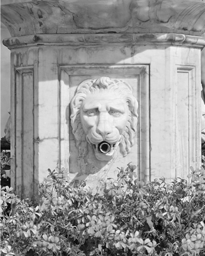
Tête de lion sur la colonne en marbre.