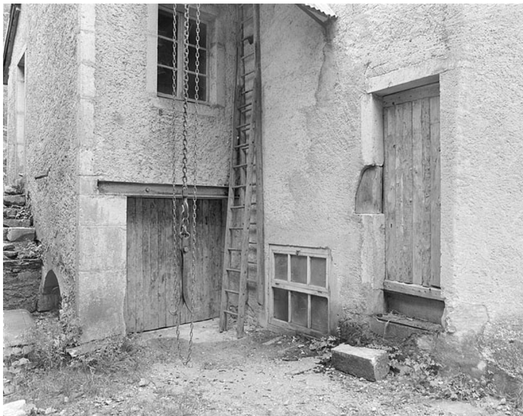
Angle du bâtiment par lequel les bois sont introduits.