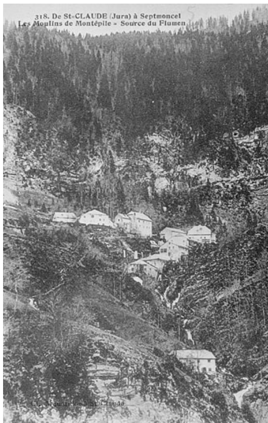
De Saint-Claude (Jura) à Septmoncel. Les Moulins de Montépile = Source du Flumen.