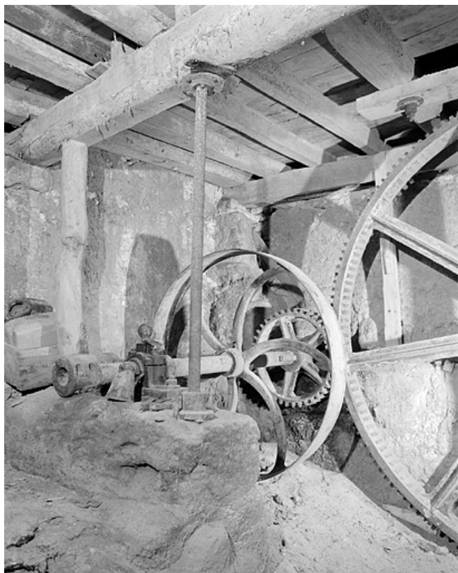
Roue entraînée par le rouet et transmettant le mouvement au chassis multiple.