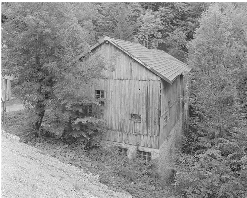
Façade postérieure et face droite de la scierie.