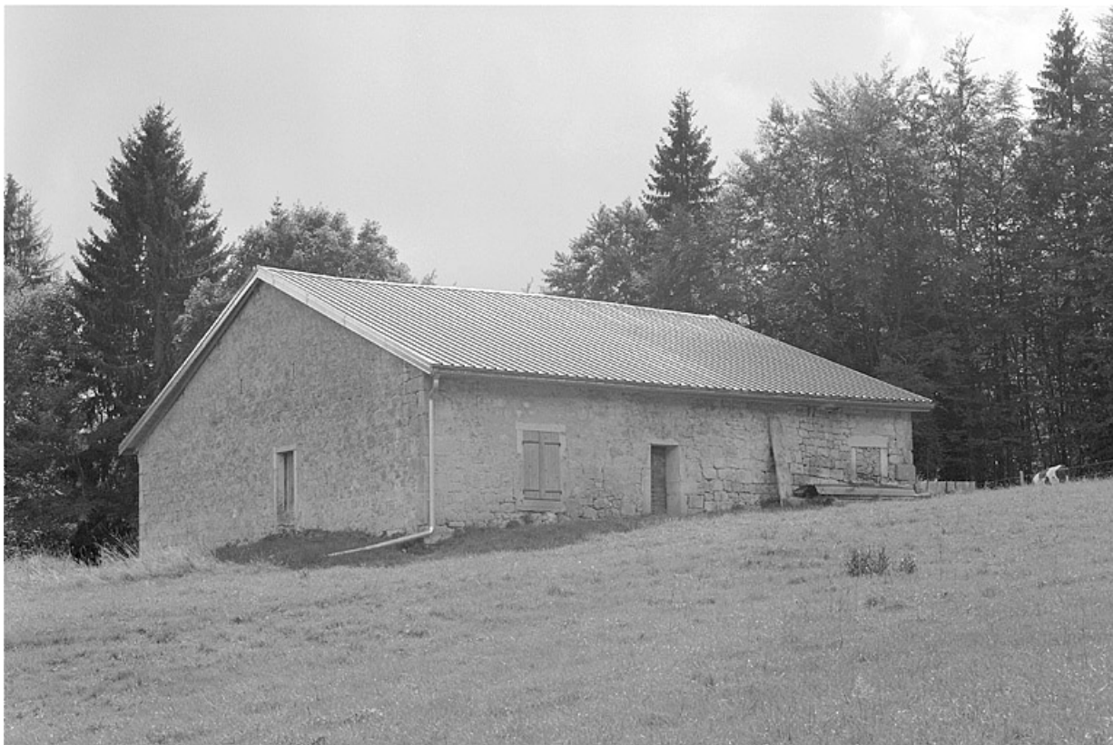
Face nord-est et façade postérieure.