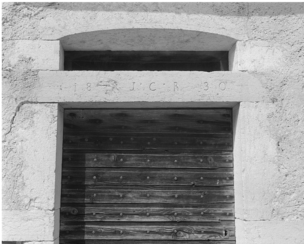
Détail de la date portée par le linteau de la porte du logis.