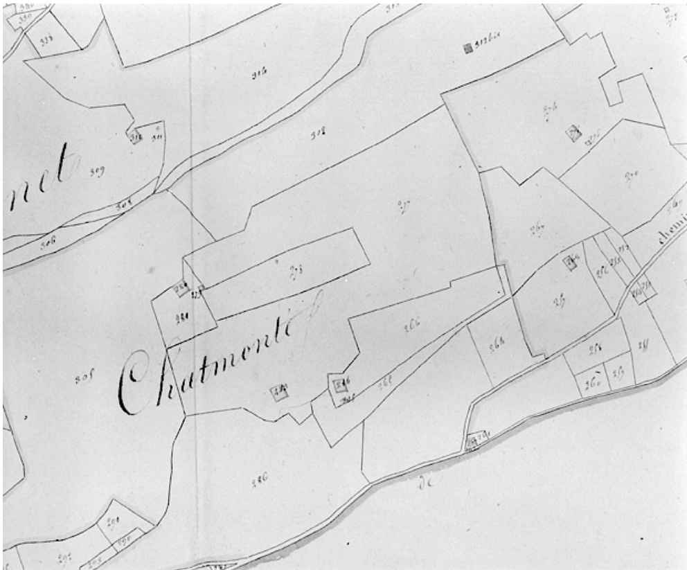
Plan-masse et de situation. Dessin, 1812. Extrait du plan cadastral, commune de Septmoncel, section F, feuille 1, échelle 1:5000. 39, Septmoncel, lieu-dit : Chamonté