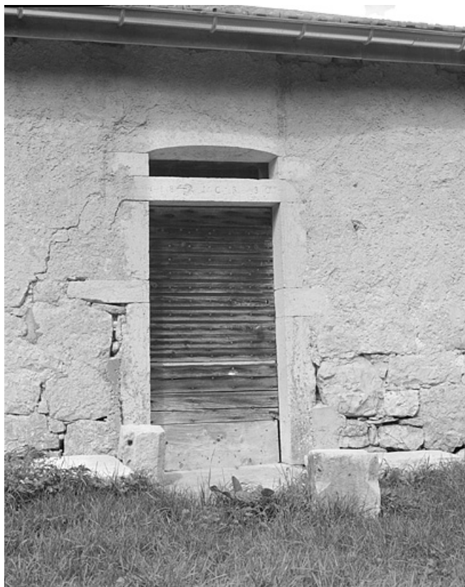
Porte du logis sur la façade antérieure.