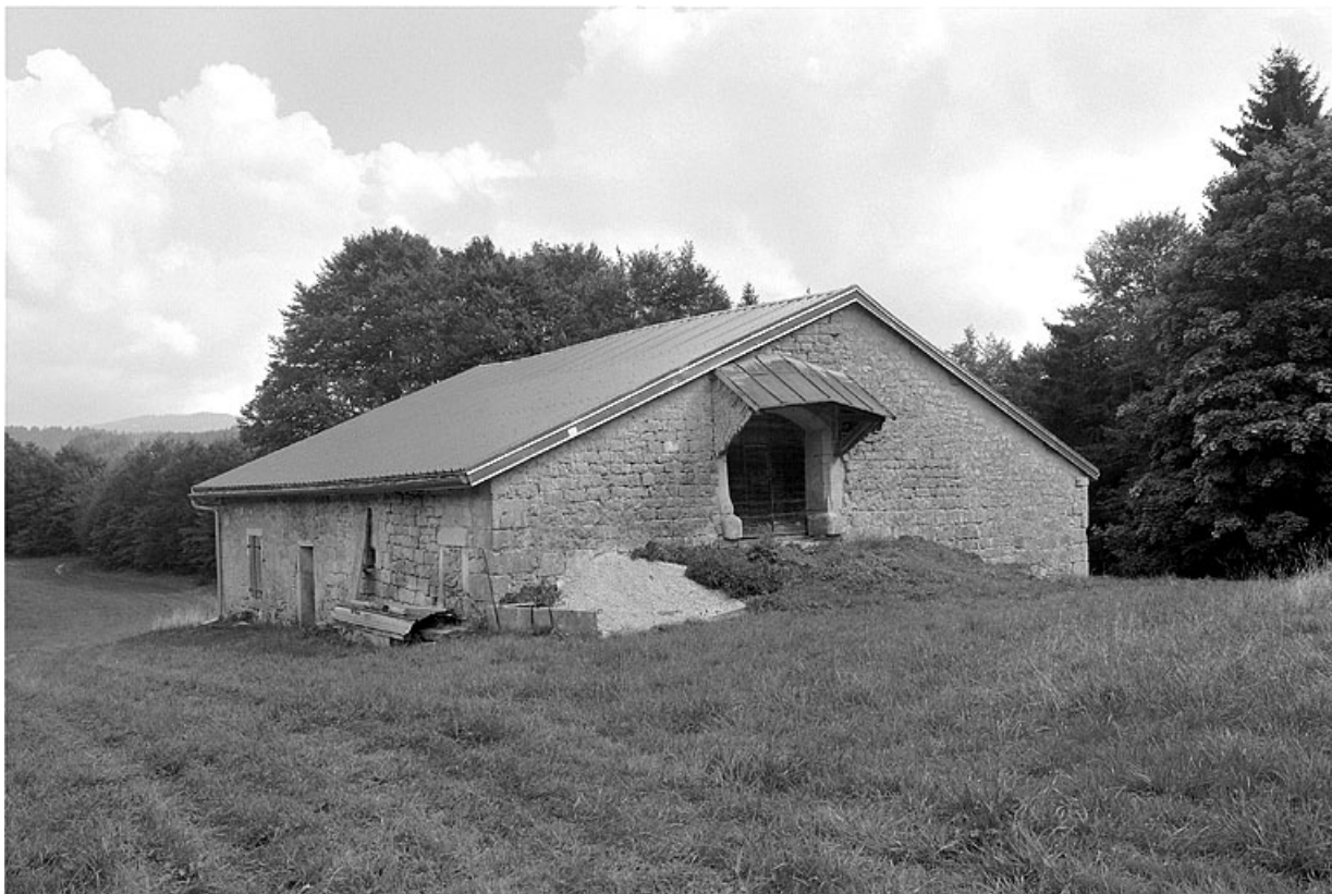
Face sud-ouest et façade postérieure.