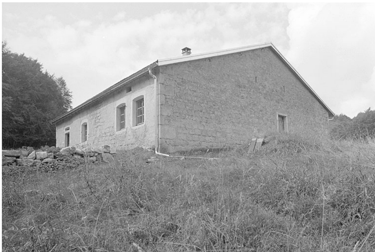
Façade antérieure et face nord-est.