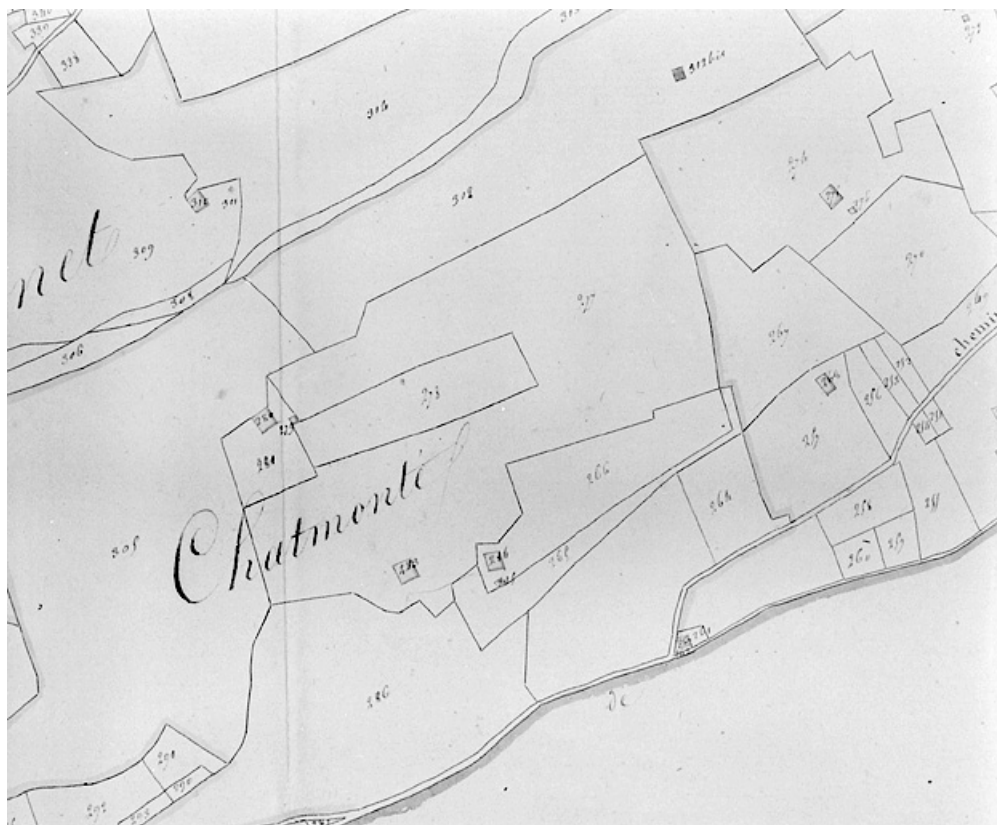
Plan-masse et de situation. Dessin, 1812. Extrait du plan cadastral, commune de Septmoncel, section F, feuille 1, échelle 1:5000. 39, Septmoncel, lieudit : Chamonté