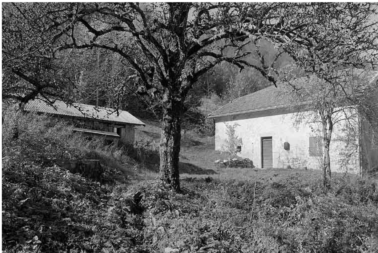
Façade antérieure de la ferme, la fontaine et le fournil.

39, Villard-Saint-Sauveur, lieudit : la Riôte