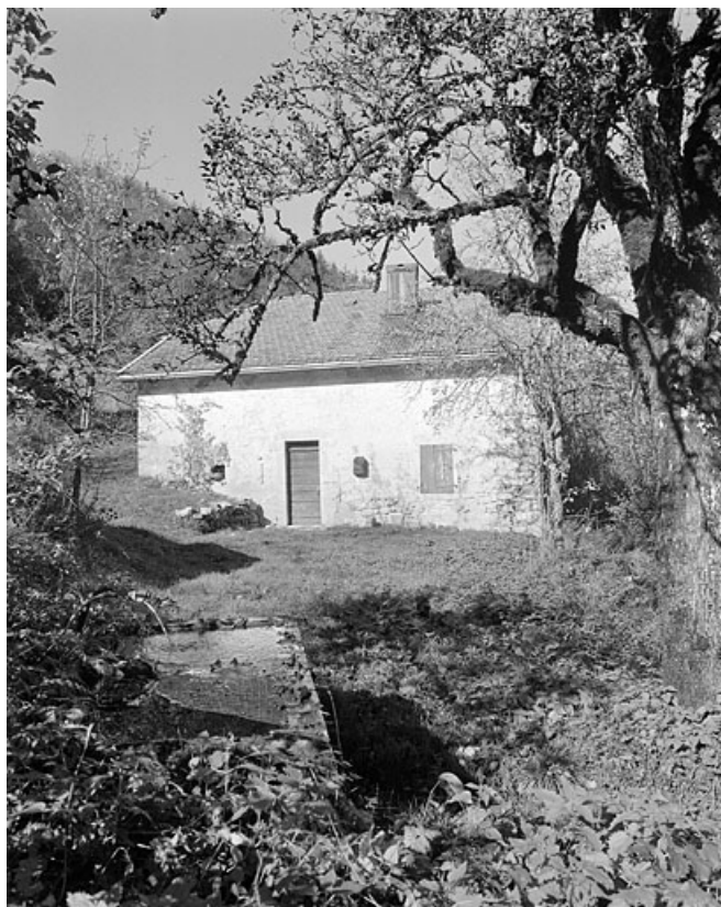
Façade antérieure et fontaine.

39, Villard-Saint-Sauveur, lieudit : la Riôte