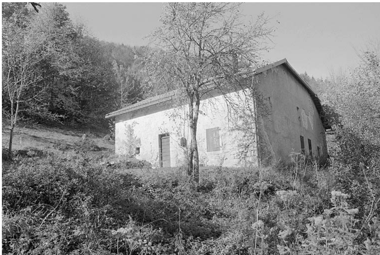
Façade antérieure et face est.

39, Villard-Saint-Sauveur, lieudit : la Riôte