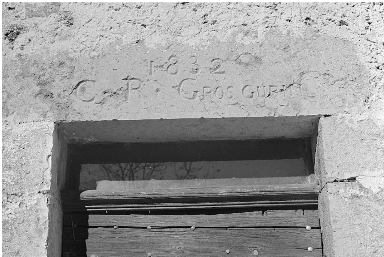
Inscription sur le linteau de la porte d'entrée.

39, Villard-Saint-Sauveur, lieudit : la Riôte