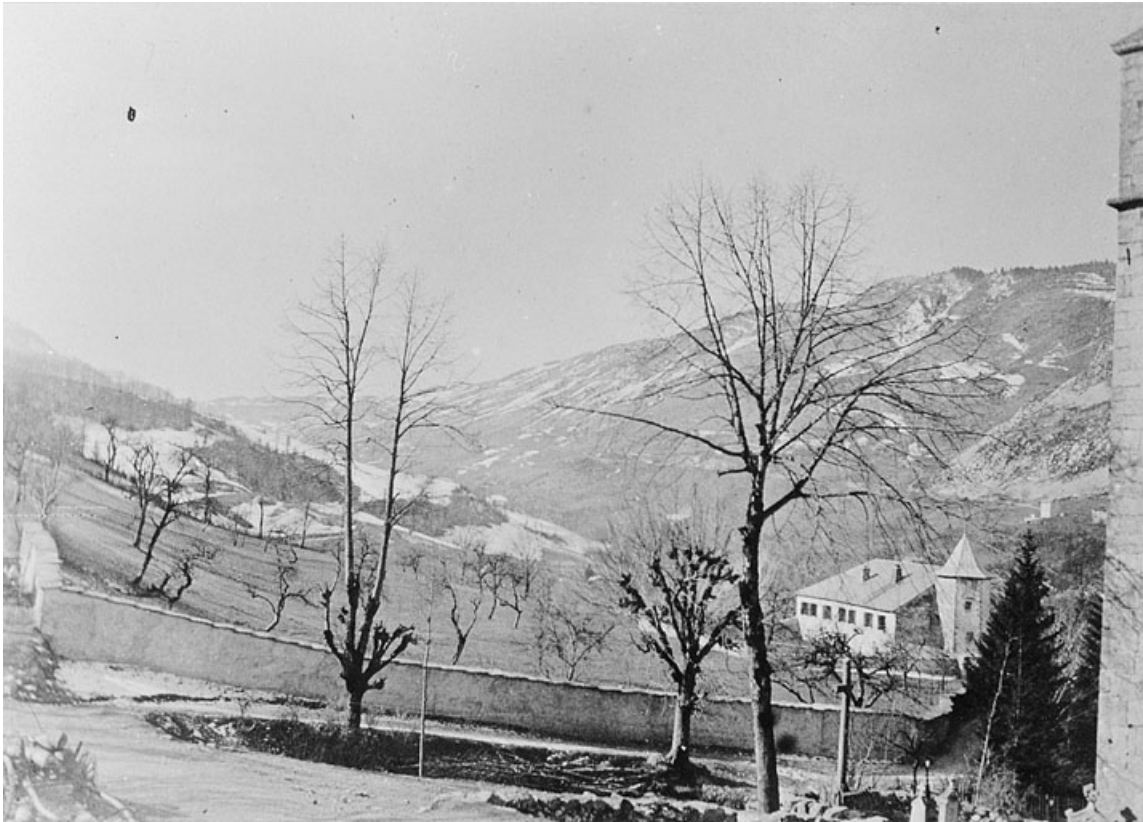
Le château de Villard-Saint-Sauveur.

39, Villard-Saint-Sauveur, lieudit : le Villard