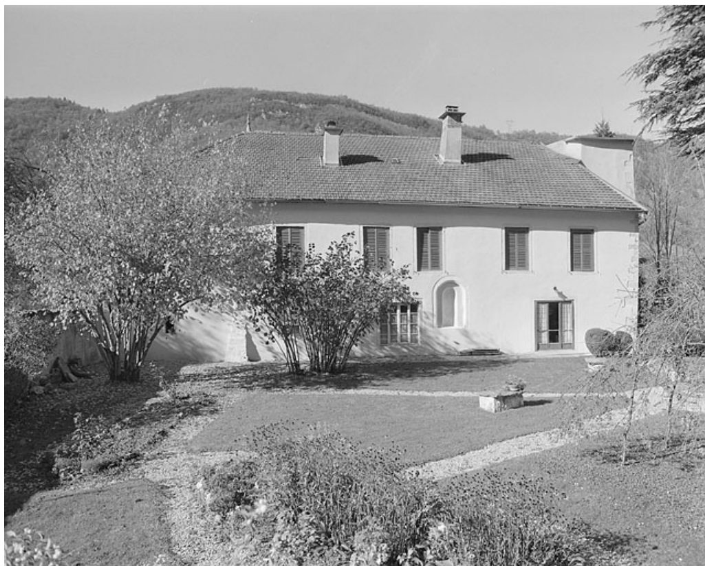
Façade principale, vue de trois quarts.

39, Villard-Saint-Sauveur, lieudit : le Villard