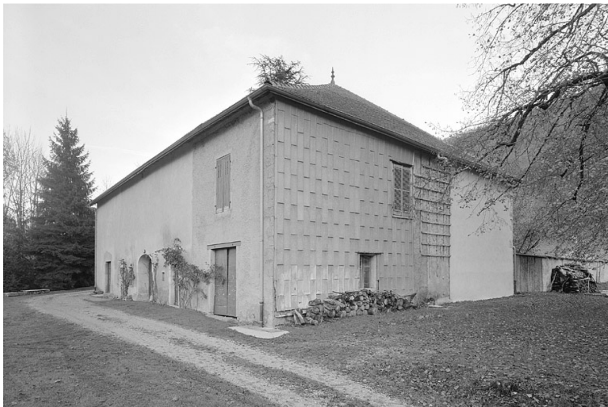
Face sud-ouest et façade postérieure.

39, Villard-Saint-Sauveur, lieudit : le Villard