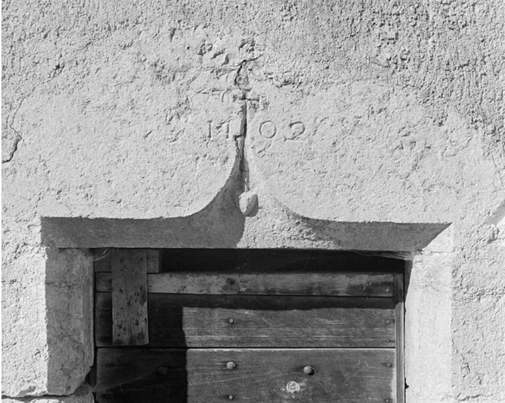
Accolade du 16e siècle, remployée au 18e siècle, au hameau du Maréchet. 39, Villard-Saint-Sauveur