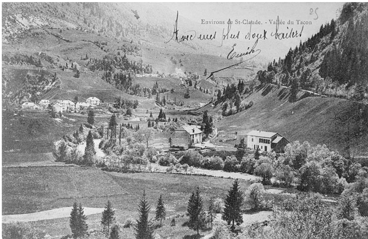
Environ de St-Claude.- Vallée du Tacon.