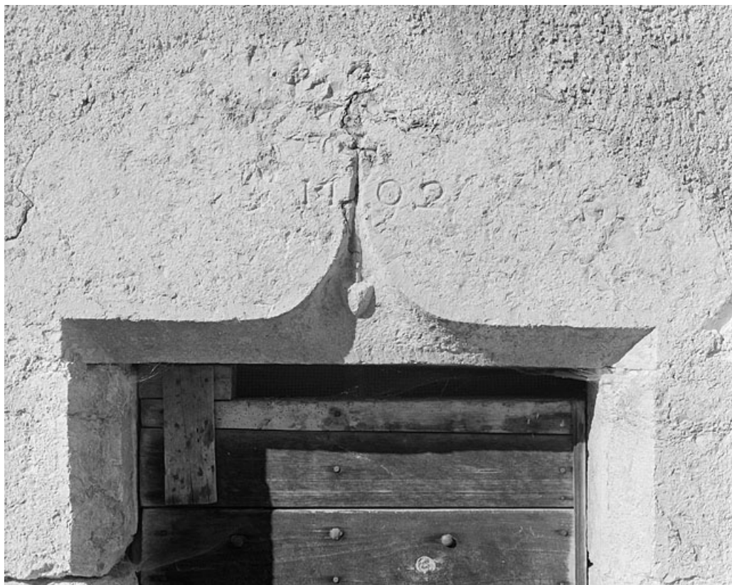
Accolade du 16e siècle, remployée au 18e siècle, au hameau du Maréchet. 39, Villard-Saint-Sauveur