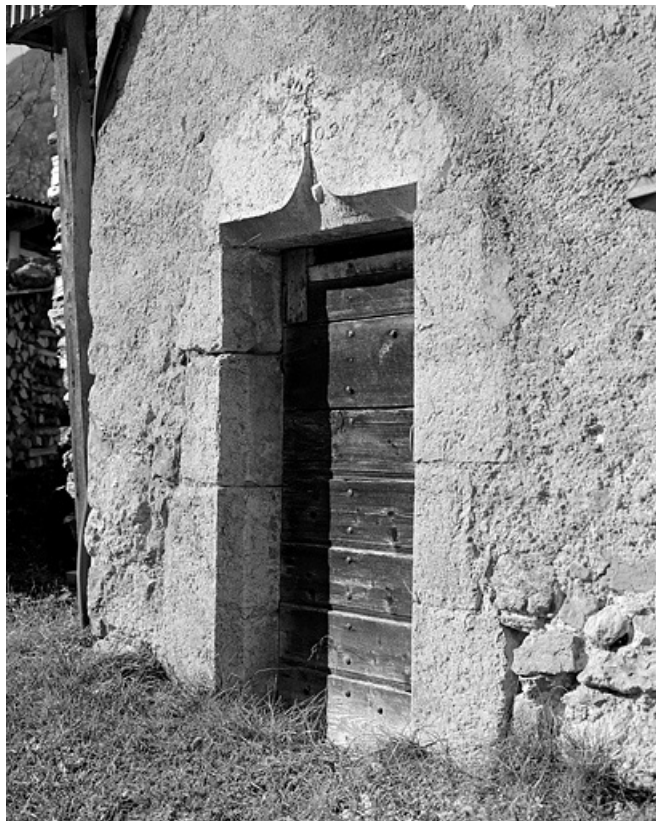
Porte avec accolade. 39, Villard-Saint-Sauveur