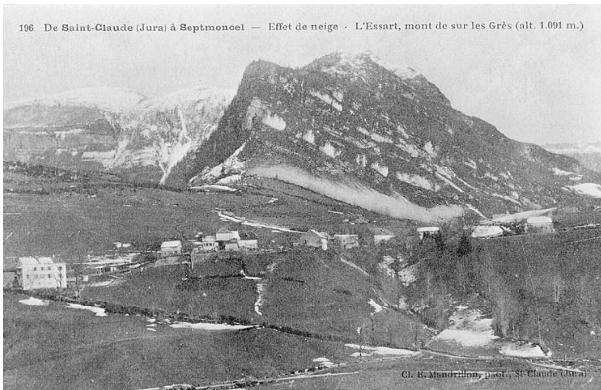
De Saint-Claude (Jura) à Septmoncel - Effet de neige. L'Essart, mont de sur les Grès (alt. 1091 m.). 39, Villard-Saint-Sauveur