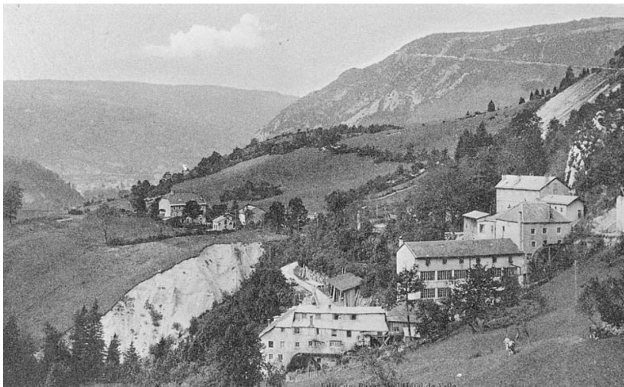
St-Claude (Jura) - Montbrillant - Route de St-Claude à Genève.