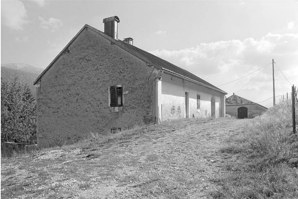
La Grande Chevalière, maison de marchand lapidaire à proximité de la ferme.

39, Les Molunes, lieudit : les Chevalières