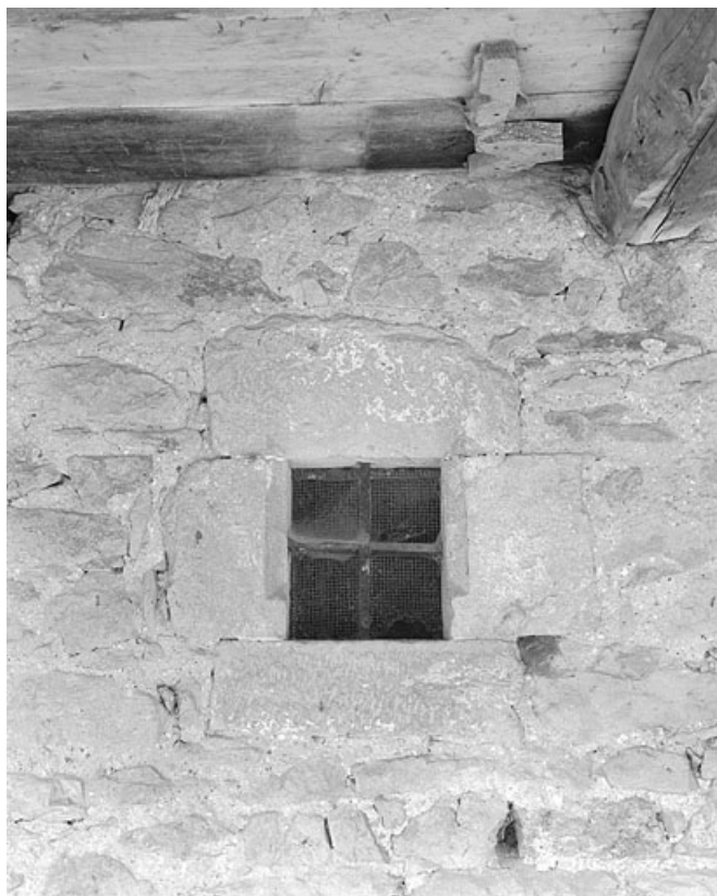
Fenêtre au linteau en accolade dans la galerie.

39, Les Molunes, lieudit : les Chevalières