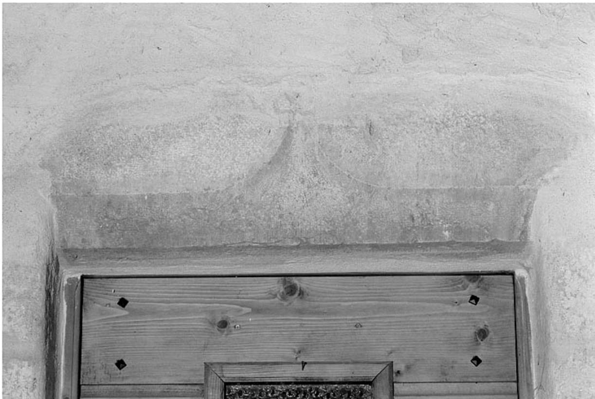
Linteau de la porte d'entrée en accolade.

39, Les Molunes, lieudit : les Chevalières