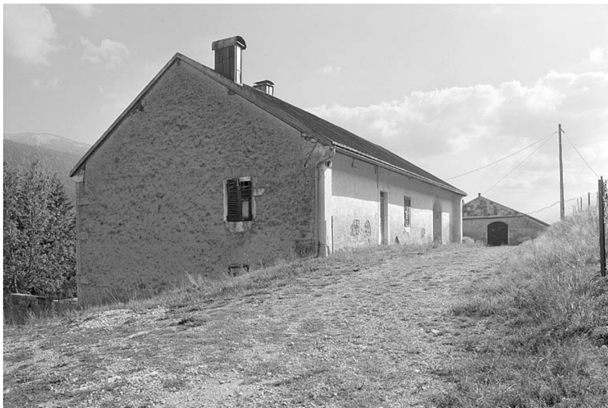
La Grande Chevalière, maison de marchand lapidaire à proximité de la ferme.

39, Les Molunes, lieudit : les Chevalières