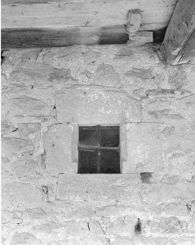
Fenêtre au linteau en accolade dans la galerie.

39, Les Molunes, lieudit : les Chevalières