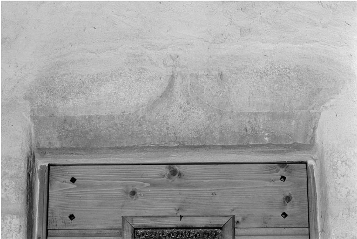
Linteau de la porte d'entrée en accolade.

39, Les Molunes, lieudit : les Chevalières