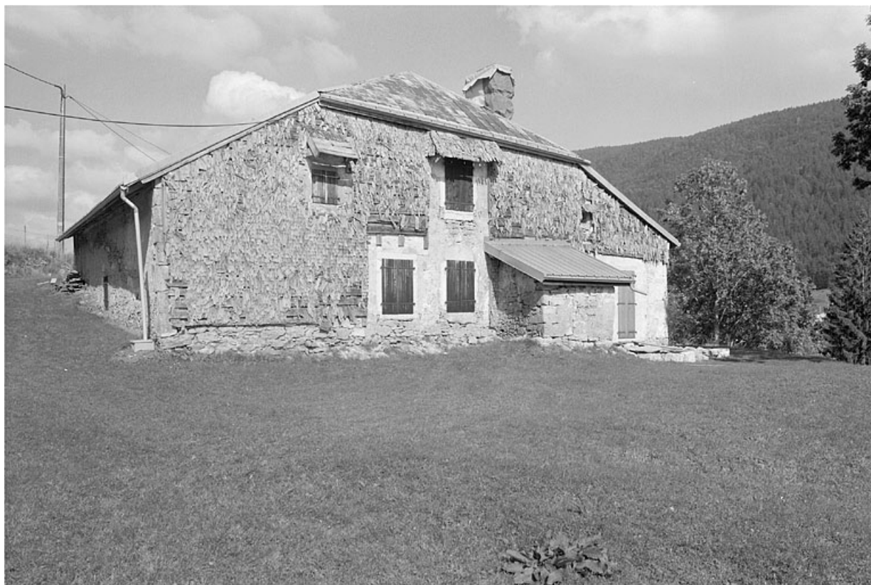
Face sud-ouest. 39, Les Molunes