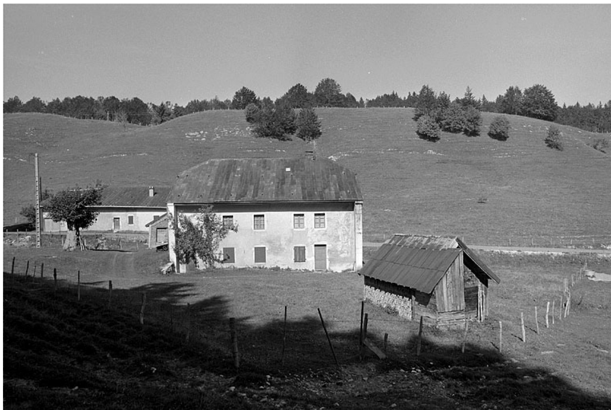
Vue générale de la ferme et du grenier fort.

39, Les Molunes, lieudit : Chez Chevassus