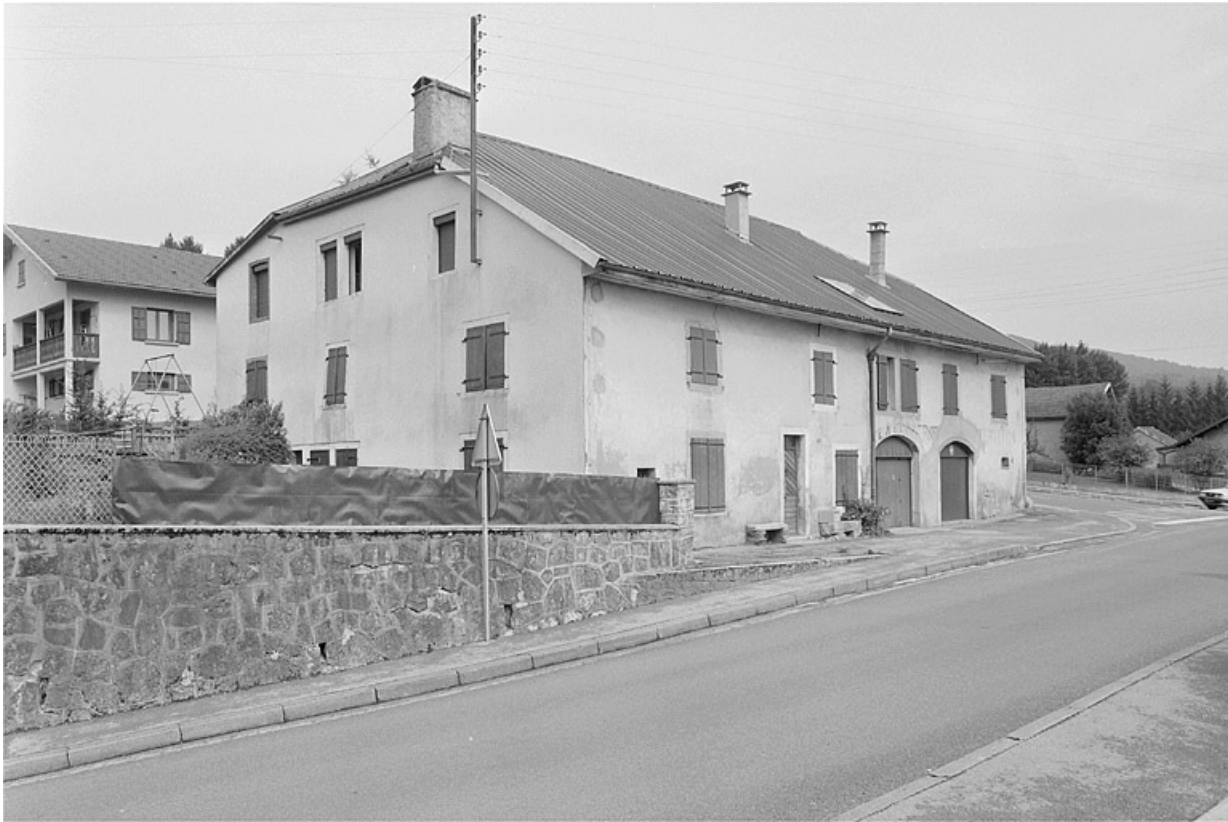
Face sud et façade sur rue.

39, Lavans-lès-Saint-Claude, 9 rue de la Cueille