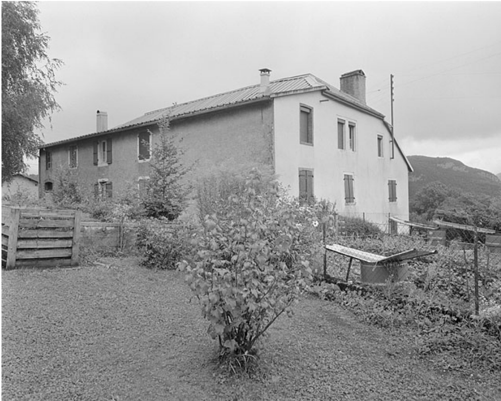
Façade postérieure et face sud.

39, Lavans-lès-Saint-Claude, 9 rue de la Cueilie