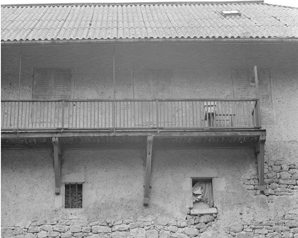
Détail de la façade postérieure.

39, Lavans-lès-Saint-Claude, 50, 52 quartier de Lizon, lieudit : Lizon