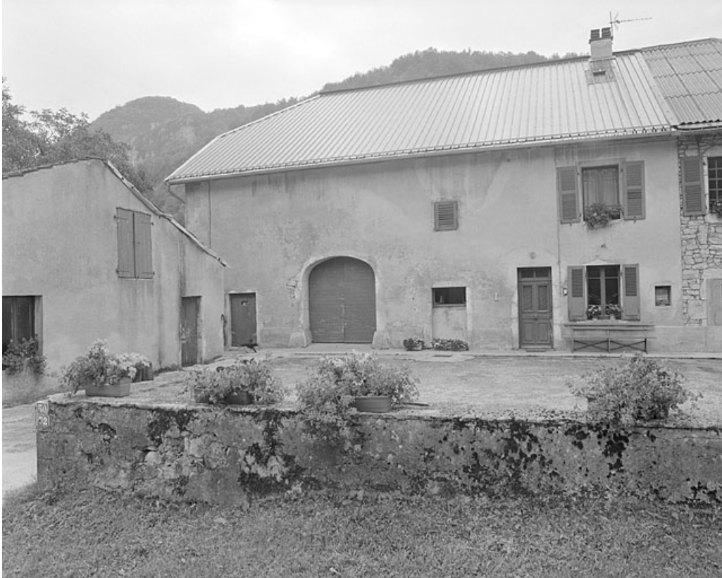
Façade antérieure de la ferme.

39, Lavans-lès-Saint-Claude, 50, 52 quartier de Lizon, lieudit : Lizon