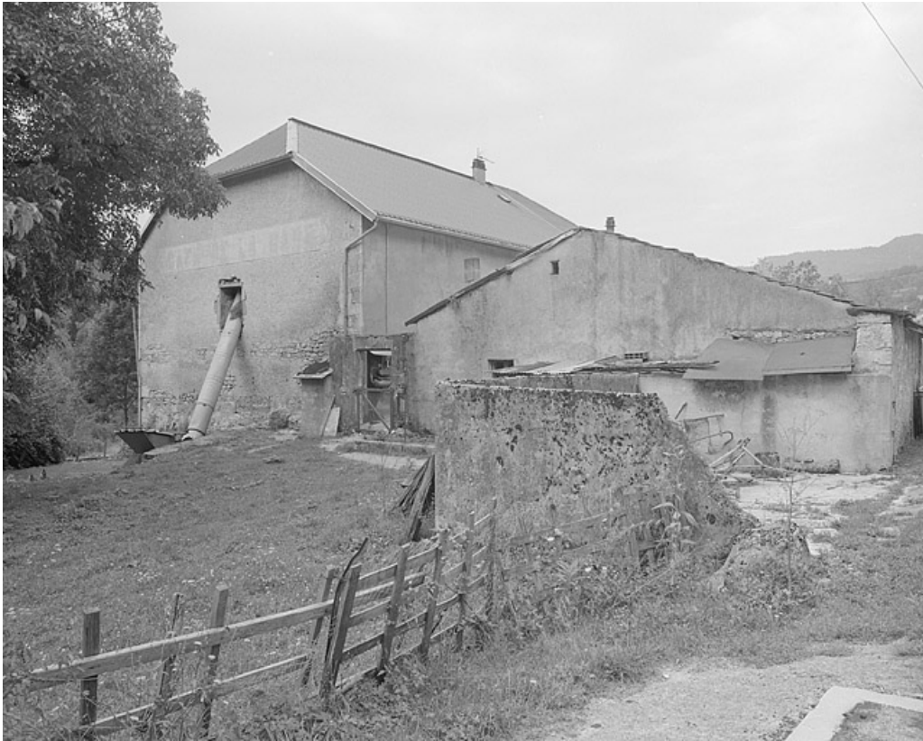
Face est de la ferme portant l'inscription « café de la gare ».

39, Lavans-lès-Saint-Claude, 50, 52 quartier de Lizon, lieudit : Lizon