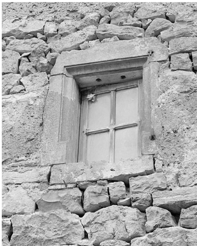
Détail d'une fenêtre sur la façade postérieure.

39, Lavans-lès-Saint-Claude, 50, 52 quartier de Lizon, lieudit : Lizon