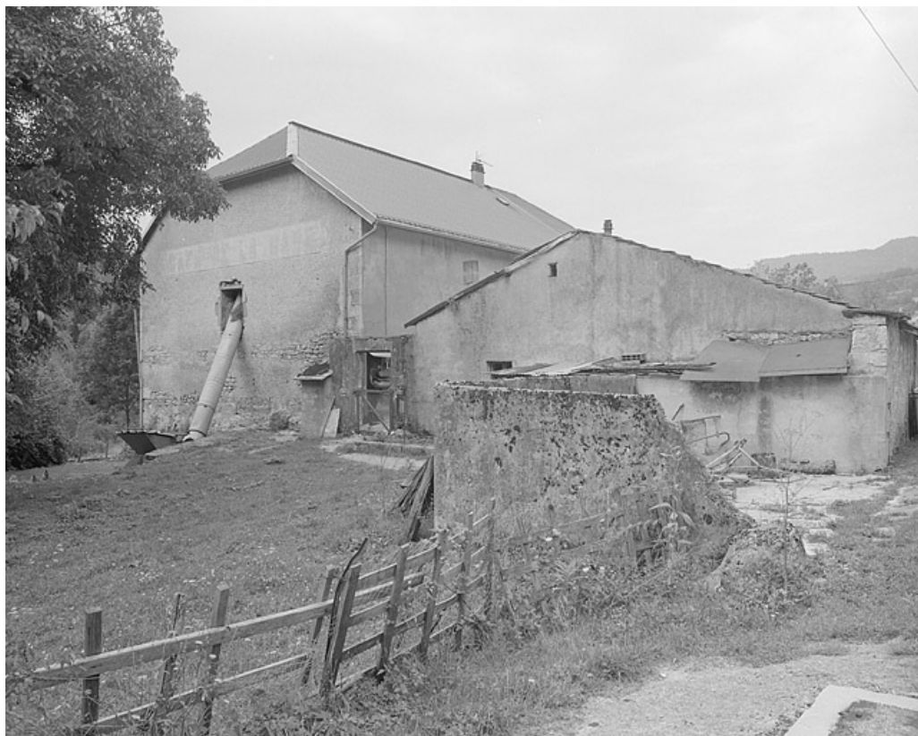
Face est de la ferme portant l'inscription « café de la gare ». 39, Lavans-lès-Saint-Claude, 50, 52 quartier de Lizon, lieudit : Lizon