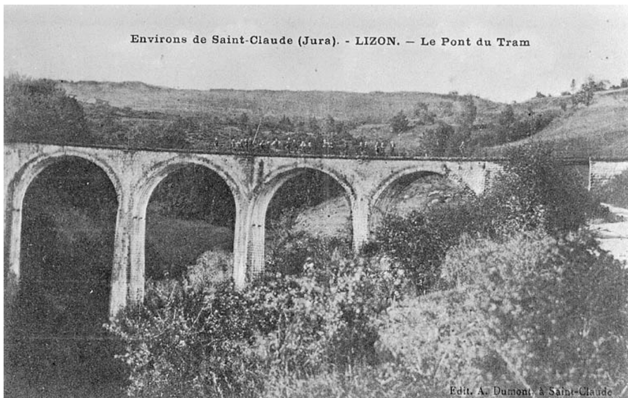
Environs de Saint-Claude (Jura) - Lizon - Le Pont du Tram.

39, Lavans-lès-Saint-Claude, lieudit : Lizon