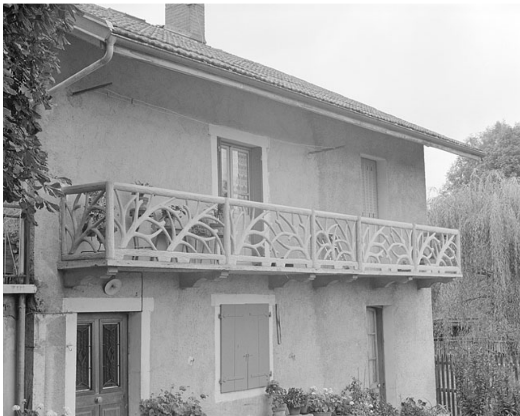
Garde-corps de balcon d'une ferme.