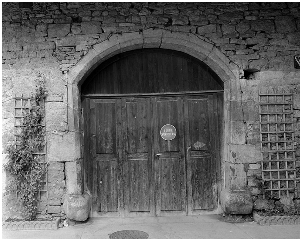
Porte de grange, place du Chêne.