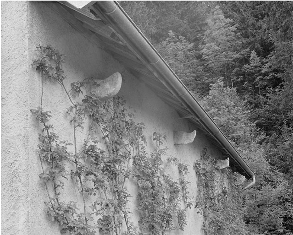
Corbeaux soutenant le chéneau amenant l'eau du toit à la citerne.