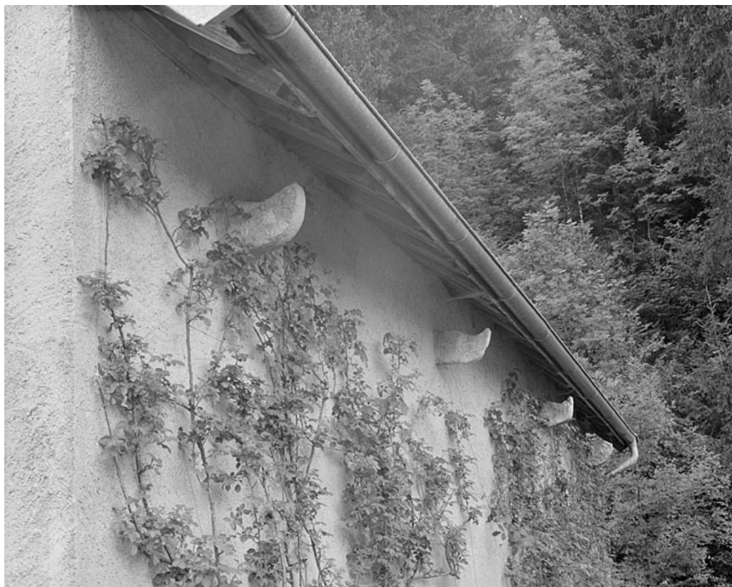
Corbeaux soutenant le chéneau amenant l'eau du toit à la citerne.