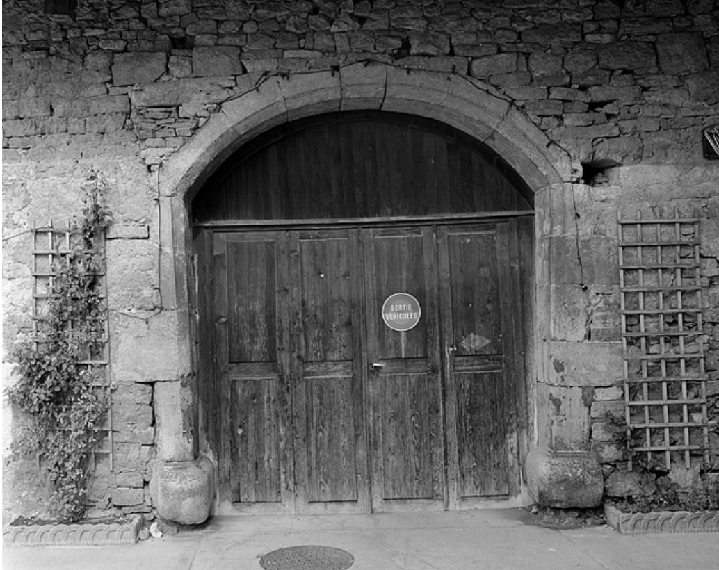
Porte de grange, place du Chêne.