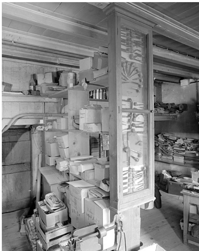
Vitrine de 1930 présentant les différents modèles de pipes.

39, Saint-Lupicin, 8, 10 rue de Ronchaud