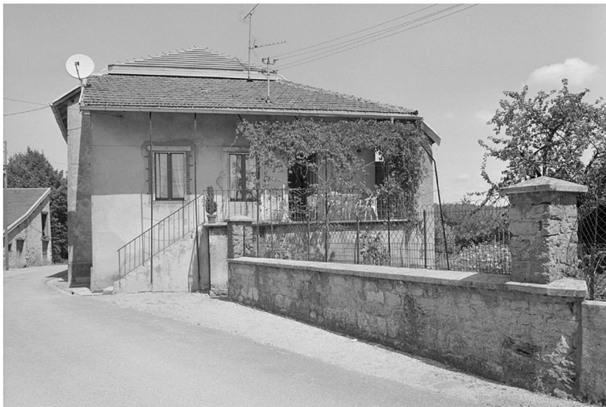
L'ancienne remise de la ferme transformée en logis.

39, Saint-Lupicin, 8, 10 rue de Ronchaud