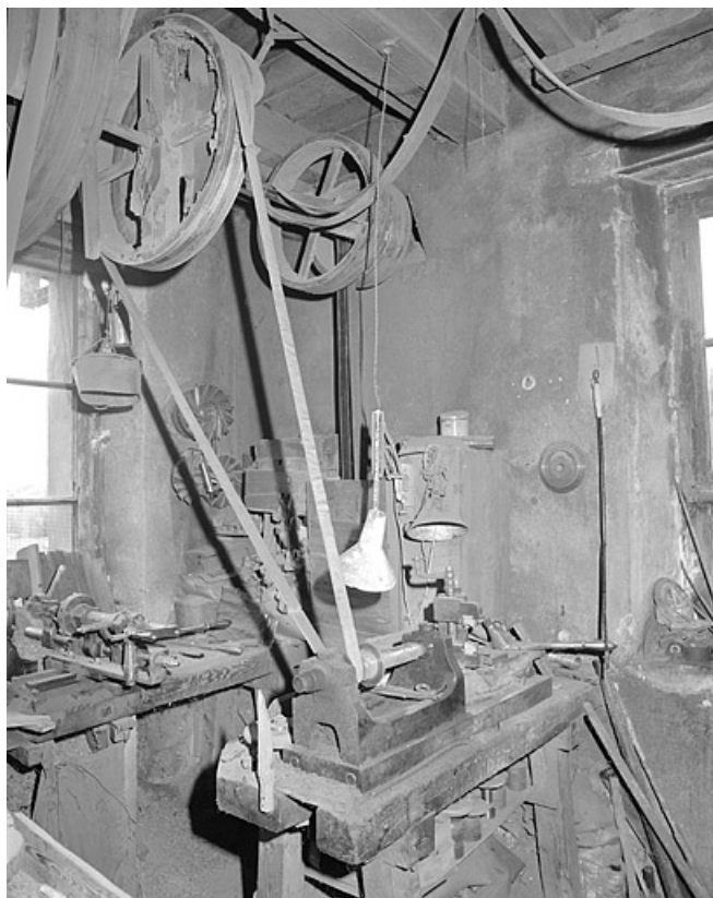
Machine servant à affûter les outils de tourneur.

39, Saint-Lupicin, 8, 10 rue de Ronchaud