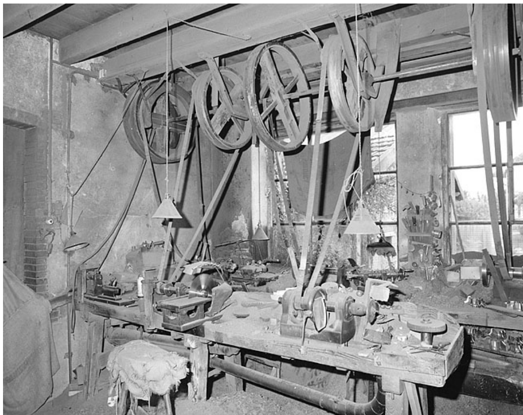
Partie de l'atelier abritant les différentes étapes de la fabrication des pipes.

39, Saint-Lupicin, 8, 10 rue de Ronchaud