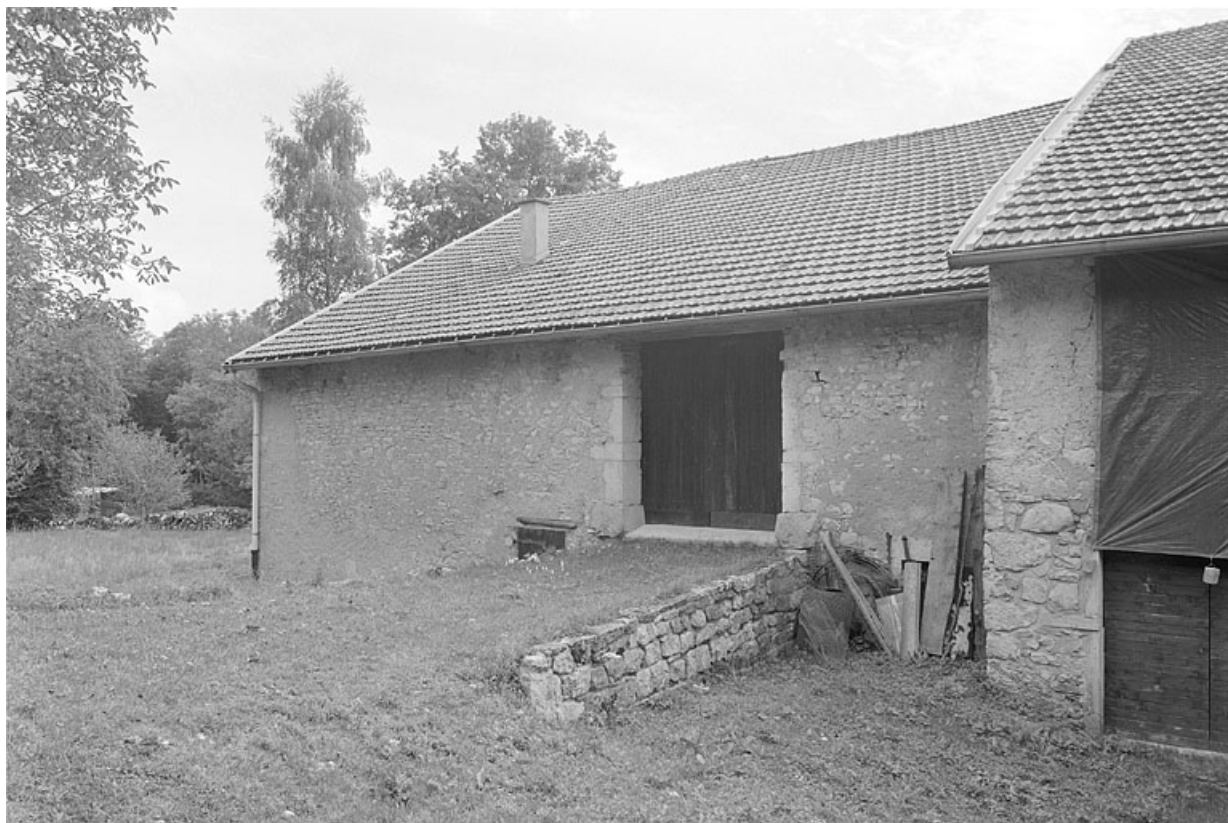
Façade postérieure, grange haute.

39, Saint-Lupicin, lieudit : les Thureys