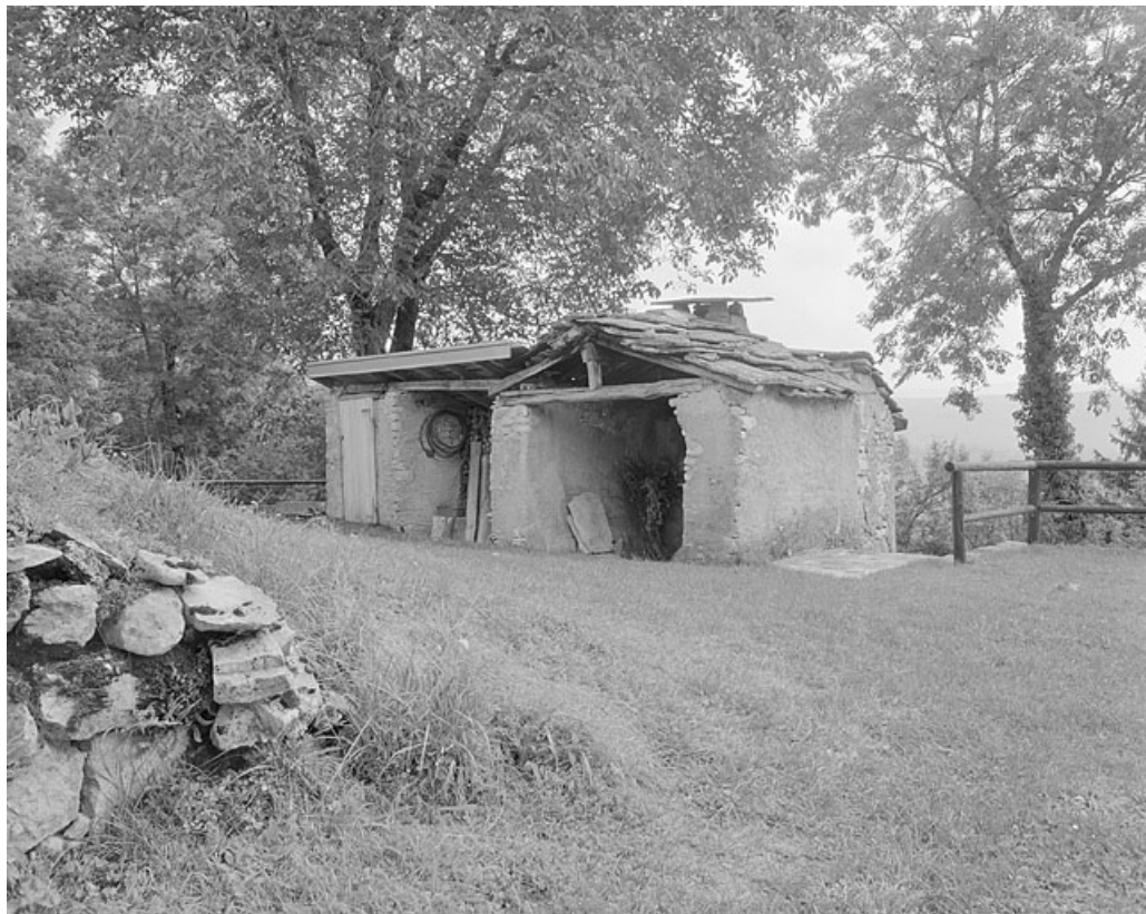
Le fournil et à sa gauche le bûcher.

39, Saint-Lupicin, lieudit : les Thureys