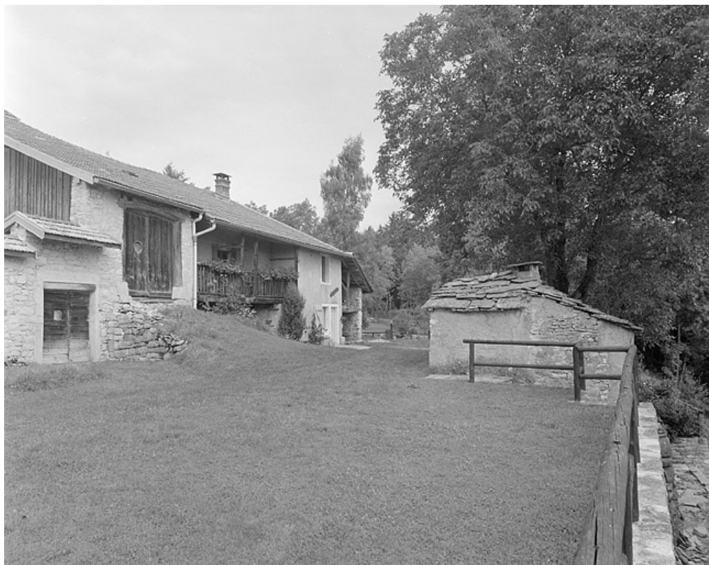
Façade antérieure et fournil.

39, Saint-Lupicin, lieudit : les Thureys