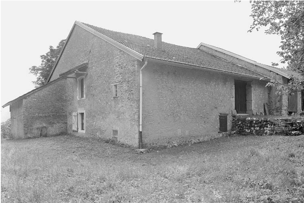
Face droite et façade postérieure.

39, Saint-Lupicin, lieudit : les Thureys