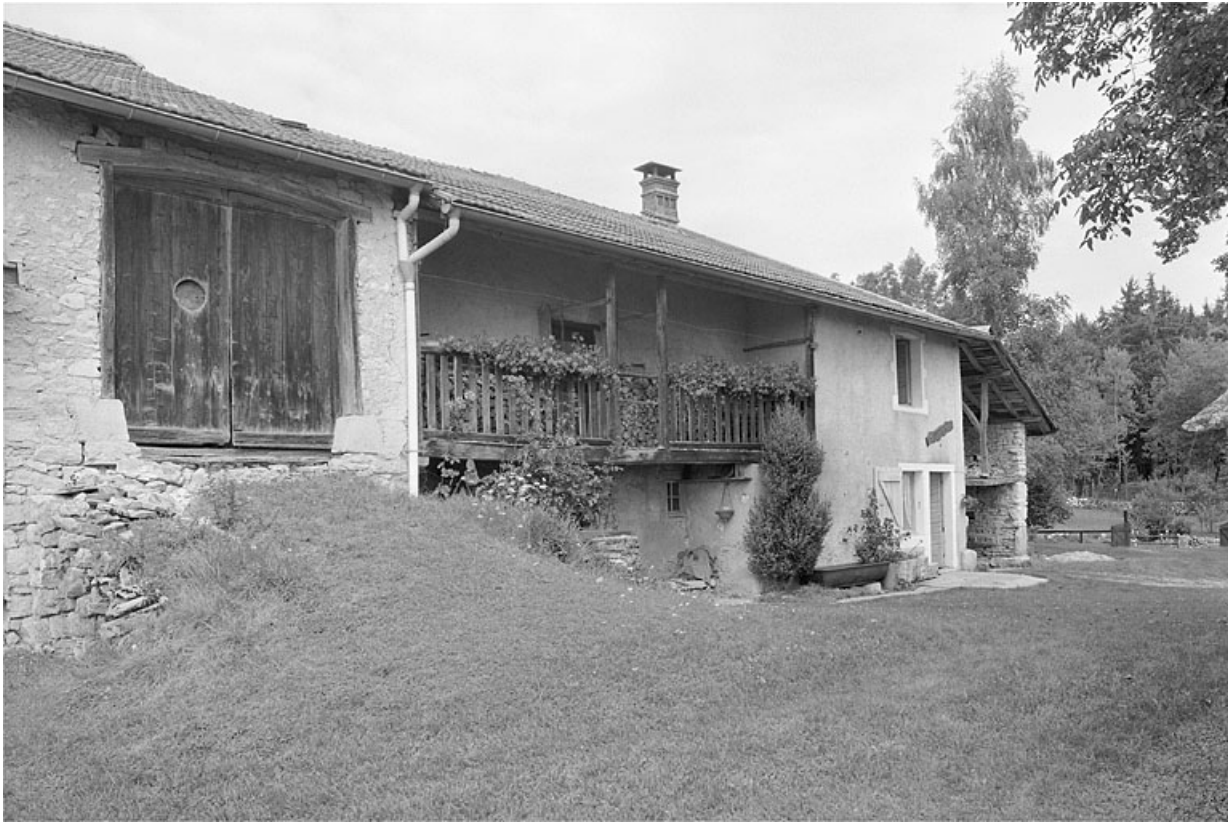
Façade antérieure, balcon en galerie.

39, Saint-Lupicin, lieudit : les Thureys